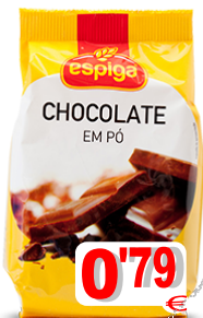
11420-CHOCOLATE PÓ ESPIGA 125 gr. Cx.24