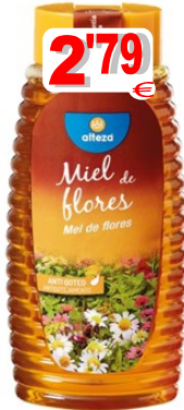
22052-MEL DE FLORES ALTEZA ANTI-GOTAS 500 gr. Cx.12