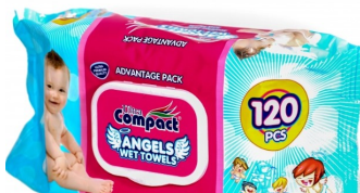
31185-TOALHITAS ANGELS Com TAMPA 120 un. Cx.12