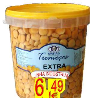
12172-TREMOÇO EXTRA MATIAS Calibre 13/15 Balde 5 Kg.