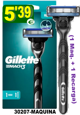
30207-MAQUINA BARBEAR GILLETTE MACH 3