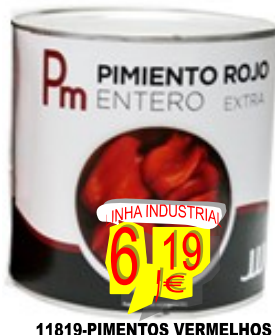
11819-PIMENTOS VERMELHOS INTEIROS EXTRA JJJ 2,500 gr.