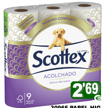
30965-PAPEL HIG. SCOTTEX ACOLCHOADO 9 Rolos