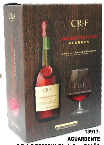
13917-AGUARDENTE CR & F RESERVA 70 cl. Com BALÃO