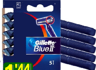
30229-MAQ. BARBEAR GILLETTE BLUE II FIXA 5 Maq.