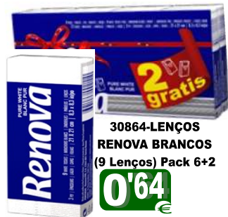
30864-LENÇOS RENOVA BRANCOS (9 Lenços) Pack 6+2