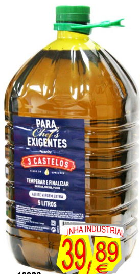
10926-AZEITE 3 CASTELOS VIRGEM EXTRA 5 Lt. Cx.3