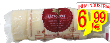
18110-QUEIJO LACTOSERÁ Nº1 CURADO 6 Un. (+- 420/440 gr.)