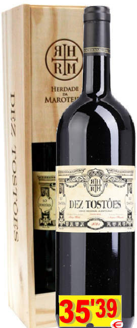
73824-V.ALT.DEZ TOSTOES MAGNUM 1,5lt Tinto cx.Mad.