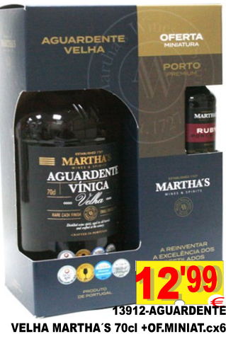
13912-AGUARDENTE VELHA MARTHA'S 70cl +OF.MINIAT.cx6