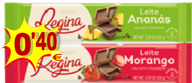
TAB. CHOC. REGINA 20 gr. 17190-MORANGO, 17191-ANANÁS