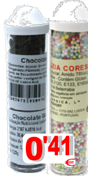
JAMAICA TUBO 18206-CHOC. GRANULADO 29 gr. 18207-GRANGEIA MISSANGA CORES 16 gr.