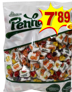
17088-CARAMELOS FRUTA PENHA Saco 1 Kg.