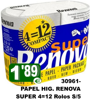
30961-PAPEL HIG. RENOVA SUPER 4=12 Rolos S/5