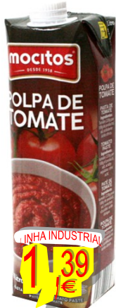
11838-POLPA TOMATE MOCITOS T. BRICK 1 Lt.