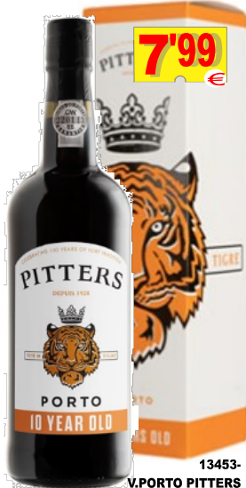
13453-V.PORTO PITTERS 10 ANOS TINTO 75cl cxIND.6gf