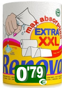
30897-ROLOS COZ. RENOVA MAXI ABSORV. EXTRA XXL (1=4) Cx.20