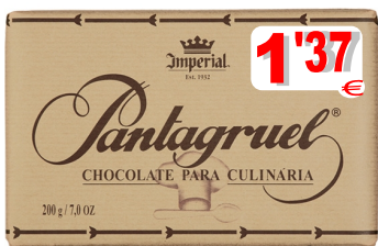
17248-CHOC. CULINÁRIA PANTAGRUÉL 200 gr.