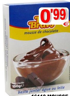
16110-MOUSSE CHOC. R. BRAVO 150 gr.