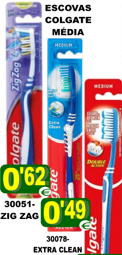
ESCOVAS COLGATE MÉDIA