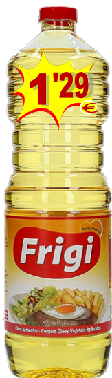
10464-OLEO ALIM. FRIGI 1 Lt.

COD. OFERTA: 17059-REBU. VILLA SORTIDO FESTAS Saco 1 Kg.