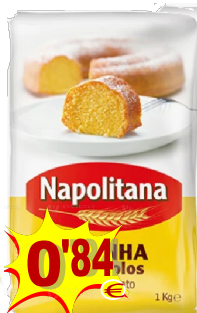
10425-Com FERMENTO FARINHA TRIGO NAPOLITANA