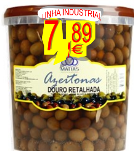
12104-AZEITONAS RETALHADAS ALHO/OREGÃOS MATIAS Balde P.L 3 Kg.