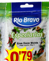
22528-ERVA DOCE MOIDA 50 gr. Cx.15