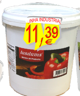
23410-MASSA PIMENTÃO LUSITANIS BALDE 5 kg.