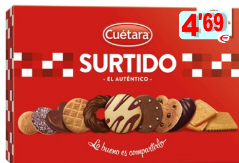
14992-BOLO SORTIDO CUÉTARA 420 gr. Cx.8