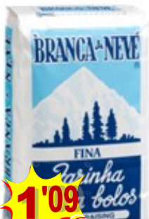
10400-FARINHA TRIGO BRANCA NEVE 1 Kg.