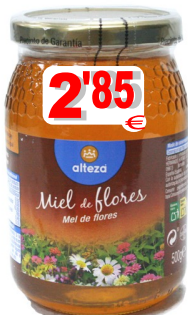
17312-MEL DE FLORES ALTEZA 500 gr. Cx.8