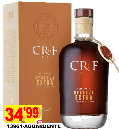
13961-AGUARDENTE CR & F RESERVA 70 cl. Com BALÃO