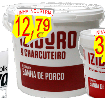
18835-BANHA DE PORCO BALDE 4,750 Kg.