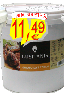
23420-TEMPERO P/FRANGOS LUSITANIS BALDE 5 kg.