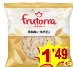
23036-AMENDOA LAMINADA FRUTORRA 150 gr.