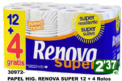
30972-PAPEL HIG. RENOVA SUPER 12 + 4 Rolos