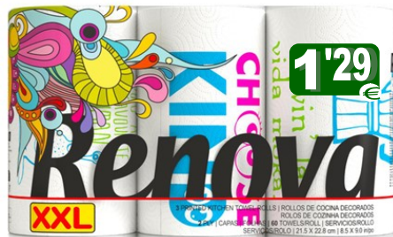
34014-ROLOS COZ. RENOVA DESIGN XXL 3 Rolos Pt.10