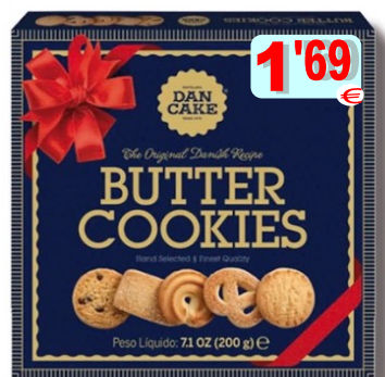
15843-BOLO SORTIDO BUTTER COOKIES 200 gr. Cx.10