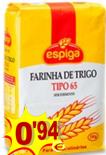
10401-FARINHA TRIGO Tipo 65 ESPIGA 1 Kg.

REDE ABAESTECEDORA DE MERCEARIAS DO CENTRO, S.A Avenida 21 Junho, Apartado 5 2435-087 CAXARIAS