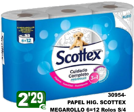
30954-PAPEL HIG. SCOTTEX MEGAROLLO 6=12 Rolos S/4