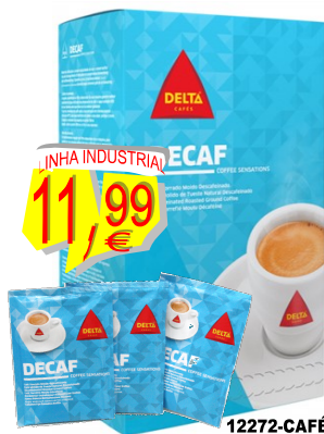
12272-CAFÉ DELTA DESCAFEINADO (100x6,5 gr.)