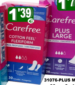
31064-FLEXIFORM 30 un. Cx.10