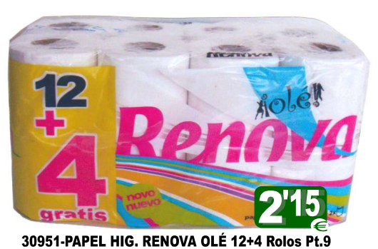
30951-PAPEL HIG. RENOVA OLÉ 12+4 Rolos Pt.9