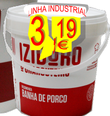
18834-BANHA DE PORCO BALDE 900 gr.