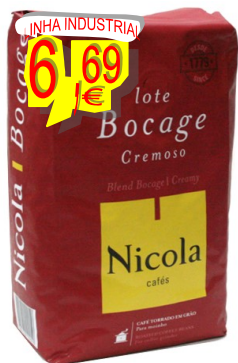
11094-CAFÉ NICOLA LOTE BOCAFE GRÃO 1 Kg.