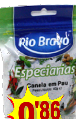
11993-CANELA PAU 40 gr. Cx.15