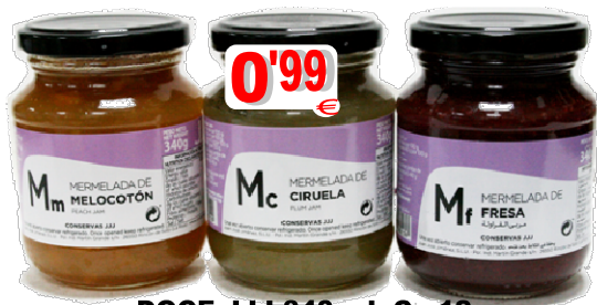
DOCE JJJ 340 ml. Cx.12 17347-PÊSSEGO, 17341-AMEIXA, 17346-MORANGO