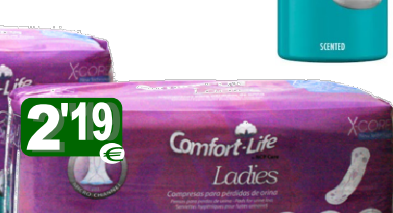
31087-NORMAL 14 un. Cx.12