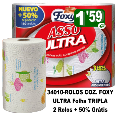
34010-ROLOS COZ. FOXY ULTRA Folha TRIPLA 2 Rolos + 50% Grátis