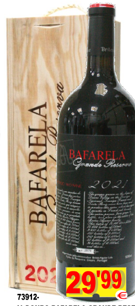
73912-V. DOURO BAFARELA GRANDE RESERVA MAGNUM Tinto 1,5 Lt. Cx. Mad.