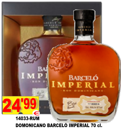
14033-RUM DOMINICANO BARCELÓ IMPERIAL 70 cl.