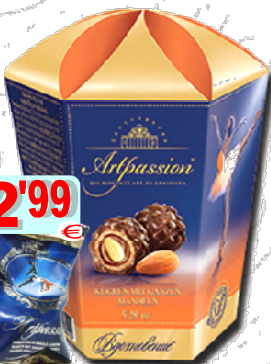
17850-BOMBONS ARTPASSION CHOC./AMENDOIA 150 gr. Cx.5