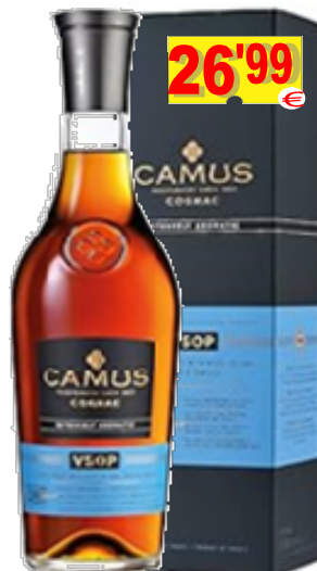
13931-COGNAC CAMUS VSOP 70 cl.