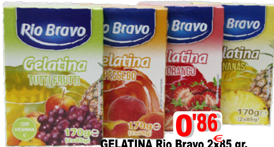
GELATINA Rio Bravo 2x85 gr. 16107-PÊSSEGO, 16109-T. FRUTTI, 16108-MORANGO, 16106-ANANÁS