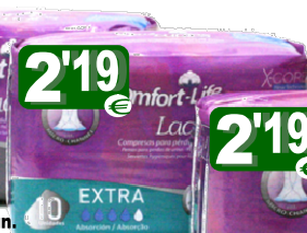
31047-EXTRA 10 un. Cx.12