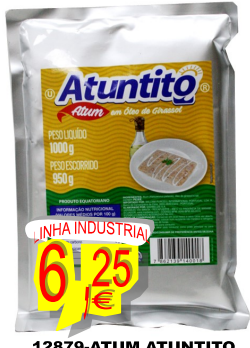
12879-ATUM ATUNTITO POSTA OLEO GIRASSOL BOLSA 1 Kg. Cx.12