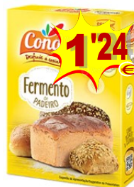
16259-FERMENTO PADEIRO CONDI (4x11 gr.) 44 gr. Cx.12