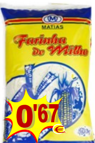
10417-FARINHA MILHO AMARELA MATIAS 500 gr. Cx.10