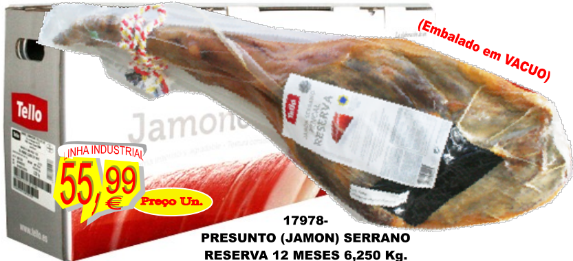
17978-PRESUNTO (JAMON) SERRANO RESERVA 12 MESES 6,250 Kg. (Embalado em VACUO)