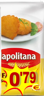
10424-Sem FERMENTO FARINHA TRIGO NAPOLITANA