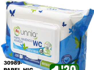
30989-PAPEL HIG. TOALHITAS WC IFFA UNNIA 100 un. Cx.12