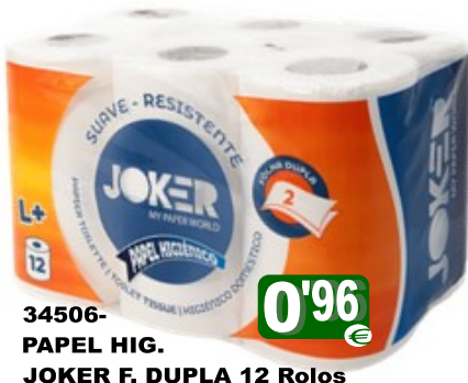
34506-PAPEL HIG. JOKER F. DUPLA 12 Rolos