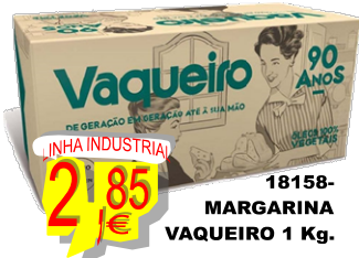
18158-MARGARINA VAQUEIRO 1 Kg.