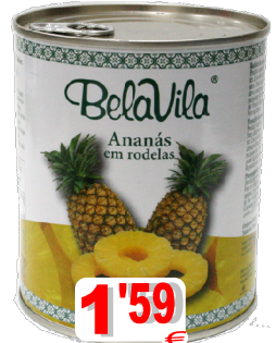
11908-ANANÁS RODELAS BELAVILA P.Liq. 825 Gr.