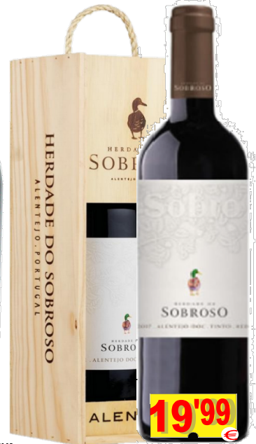
73893-V.ALT. HERDADE DO SOBROSO DOC Tinto MAGNUM 1,5 Lt. cx.Mad.