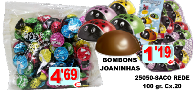
25264-SACO 500 gr.