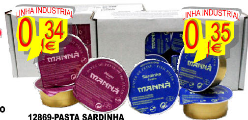
12869-PASTA SARDINHA MANNA 22 gr. Cx.24