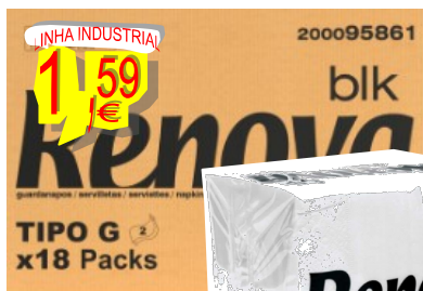
34022-GUARDANAPOS RENOVA Tipo G 40x40 BLK Branco F. DUPLA Com 75 Un.