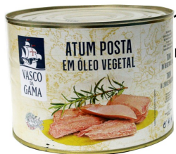
12863-ATUM POSTA VASCO GAMA Lata 1,730 Kg. Cx.6