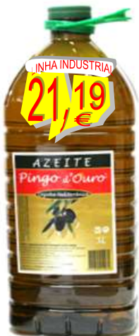
10559-AZEITE PINGO D'OURO REF. e VIRGEM 3 Lt.