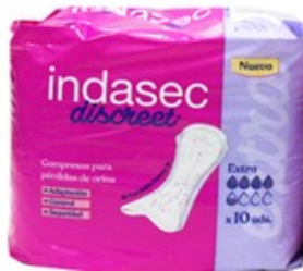
PENSOS INDASEC INCONTINENCIA DISCREET