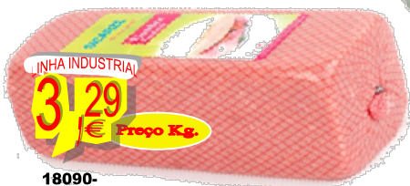
18090-FIAMBRE SANDWICH BARRA SICARZE