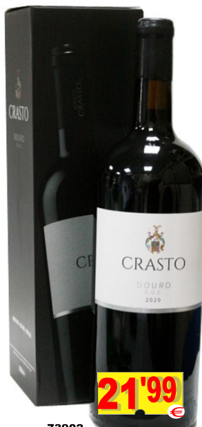
73902-V. DOURO QTA. do CRASTO DOC Tinto MAGNUM 1,5 Lt.