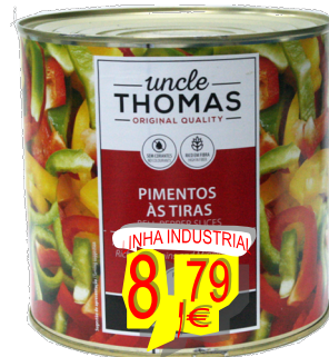
11806-PIMENTOS TIRAS 3 CORES UNCLE THOMAS PL 2,550 Kg.