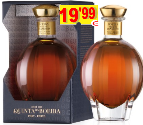
13529-V.PORTO Qta da BOEIRA DIAMOND 75 cl.