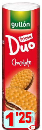
15023-BOL. MEGA DUO CHOCOLATE GULLÓN 500 gr.