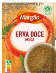
ERVA DOCE MOIDA 22388-MARGÃO 14 gr. Cx.14 22567-MARGÃO 25 gr. Cx.20