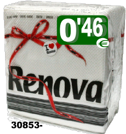
30853-GUARDANAÇOS RENOVA T/E Cx.36