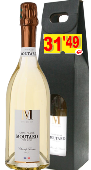
13230-CHAMPAGNE MOUTARD BLANC DE BLANCS 75 cl.