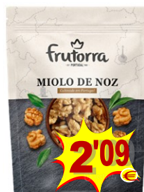
23014-MIOLO NOZ PORTUGAL FRUTORRA 125 gr. Cx.10