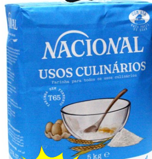
10420-FARINHA TRIGO NACIONAL T/65 Saco 5 kg.