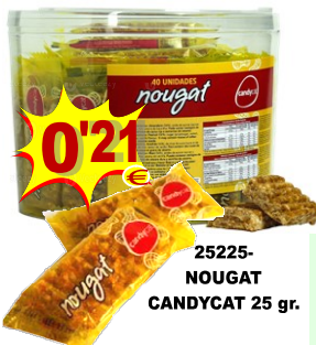
25225-NOUGAT CANDYCAT 25 gr.

11897-CHUPA POPS SABORES SORTIDOS Boião 80 un.