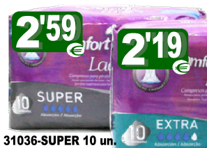
31036-SUPER 10 un. Cx.12