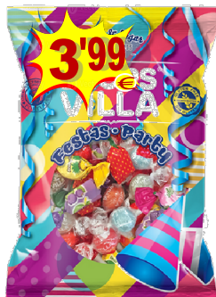
17059-REBUÇADOS VILLA SORTIDO FESTAS Saco 1 Kg.