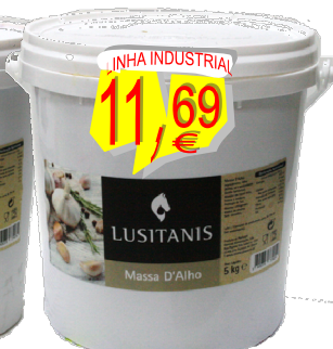
23430-MASSA D'ALHOS LUSITANIS BALDE 5 kg.