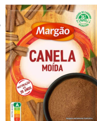
CANELA MOIDA 22575-MARGÃO 60 gr. Cx.18 22559-MARGÃO 30 gr. Cx.22

OS PREÇOS INCLUEM CUSTOS DE DISTRIBUIÇÃO