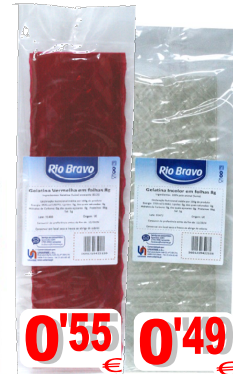
GELATINA FOLHAS RIO BRAVO 8 gr. 16262-VERMELHA 16114-INCOLOR