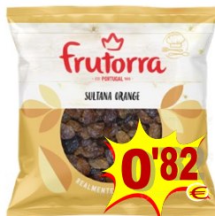
23038-SULTANAS ORANGE TURQUIA FRUTORRA 150 gr.