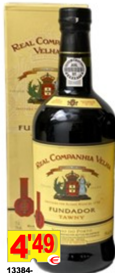
13384-V. PORTO REAL COMP. VELHA FUNDADOR Tinto 75 cl.