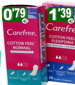
31013-PROTEGE SLIP 20 un. Cx.10