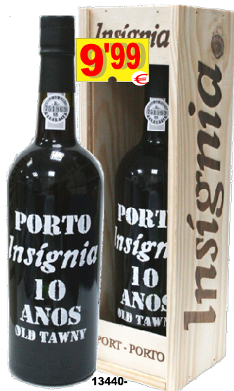
13440-V. PORTO INSIGNIA 10 Anos 75 cl. Cx. Mad.