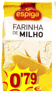
10426-FARINHA MILHO AMARELO ESPIGA 500 gr. Cx.10