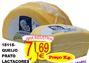
18118-QUEIJO PRATO LACTAÇORES ILHA AZUL METADES (+- 500 gr. P/Unidade)