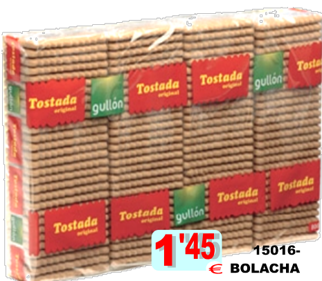
15016-BOLACHA TOSTADA GULLÓN 800 Cx.14