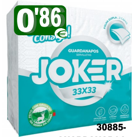
30885-GUARDANAÇOS JOKER 33x33 cm. F. Dupla