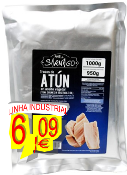
12876-ATUM VILLA SARNAGO Bolsa 1 Kg.