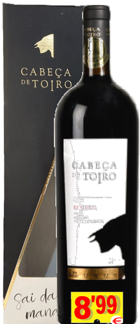
73638-V.TEJO CABEÇA TOIRO RESERVA MAGNUM Tinto 1,5 Lt. Cx. Ind.