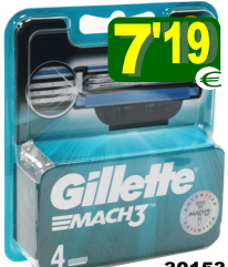
30153-LAMINAS GILLETTE MACH 3 - 4 Recargas