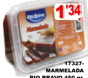
17327-MARMELADA RIO BRAVO 450 gr.