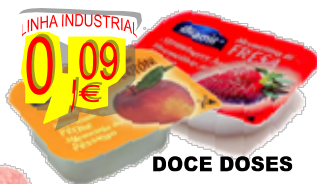
DOCE DOSES DIAMIR Cx.144 un. 17309-PÊSSEGO, 17342-MORANGO