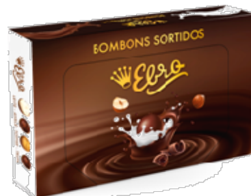
25172-BOMBONS SORTIDOS EBRO 4 RECHEIOS 125 gr. 2'09