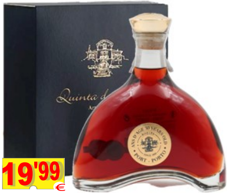
13401-V. PORTO PRIME'S SPECIAL RESERVA DECANTER 75 cl.