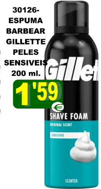
30126-ESPUMA BARBEAR GILLETTE PELES SENSÍVEIS 200 ml.