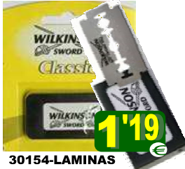
30154-LAMINAS WILKINSON SCHIK CLASSIC/PREMIUM