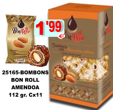
25165-BOMBONS BON ROLL AMENDOIA 112 gr. Cx11