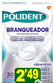
30049-POLIDENT PAST. BRANQUEADOR 30 un.