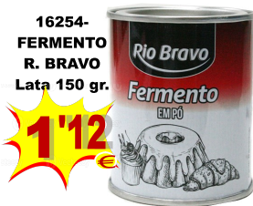
16254-FERMENTO R. BRAVO Lata 150 gr.