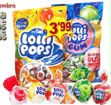
CHUPA ROSHEN 920 gr. (48 un.) 25203-MIX YOGURTE 25204-GUM FRUIT MIX