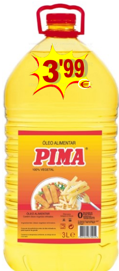
10465-OLEO ALIM. PIMA 3 Lt.