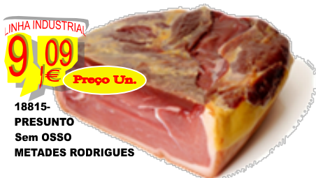
18815-PRESUNTO Sem OSSO METADES RODRIGUES