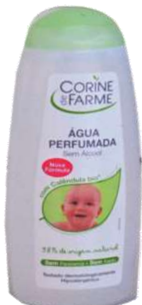
31701-AGUA PERFUMADA BÉBÉ C. FARME 250 ml. Cx.12