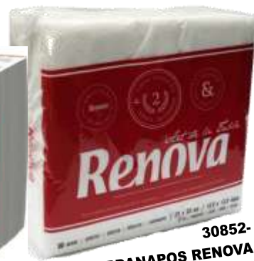
30852- GUARDANAPOS RENOVA Folha DUPLA A-100