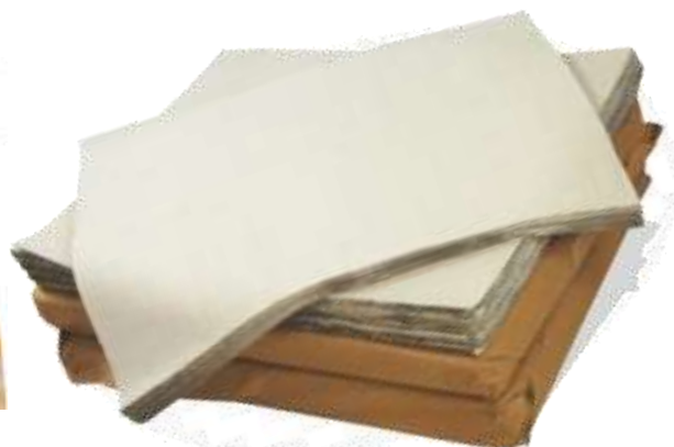
19552-PAPEL VEGETAL RESMA JOKER 50x75 cm.