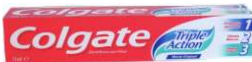
30028-DENT. COLGATE TRIPLE ACTION 75 ml.