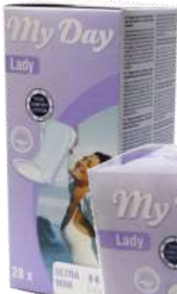
31069- ULTRA 28 Un. Cx.8