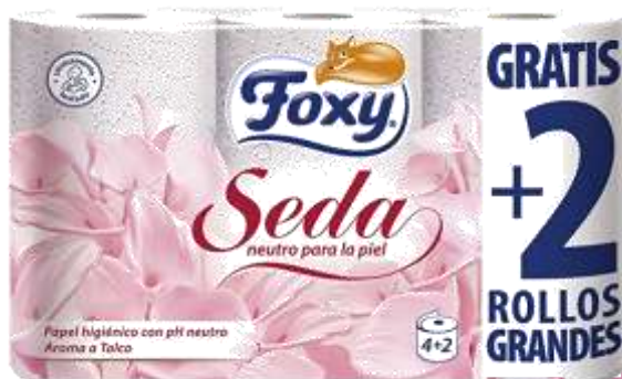
PAPEL HIG. FOXY F. TRIPLA 4+2 Rolos Grátis 30997-SEDA