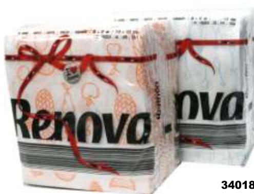
34018- GUARDANAPOS RENOVA Tipo E DECO