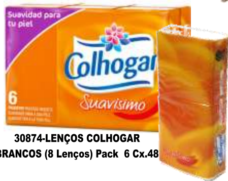
30874-LENÇOS COLHOGAR BRANCOS (8 Lenços) Pack 6 Cx.48