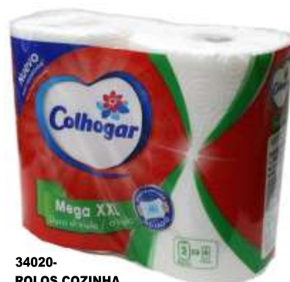
34020- ROLOS COZINHA COLHOGAR MEGA XXL 2=6 Rolos Pt.12