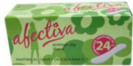
31079-PENSOS AFECTIVA PROTEGE SLIP 24 un. Cx.24