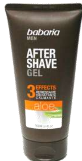
30243- AFTER SHAVE BABARIA GEL 3 EFEITOS 150 ml.