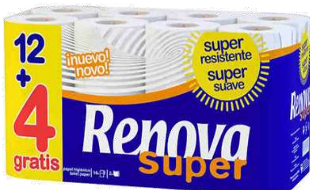
30972-PAPEL HIG. RENOVA SUPER 12 + 4 Rolos Saco 4