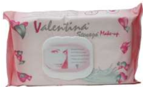
31106-TOALHITAS DESMAQUILHANTES VALENTINA 40 un.