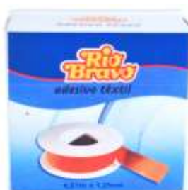
18339-Adesivo R. BRAVO 4,7x1,25 Cm. Cx.12