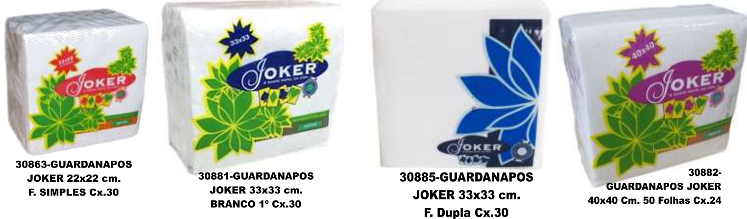
30863-GUARDANAPOS JOKER 22x22 cm. F. SIMPLES Cx.30