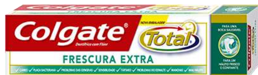
30005-DENT. COLGATE TOTAL FRESCURA EXTRA 75 ml.