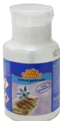
18424-ACETONA PERFUMADA C/Doseador 200 ml.