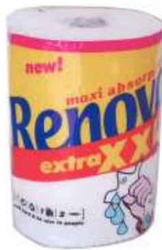
30897-ROLOS COZ. RENOVA MAXI ABSORV. EXTRA XXL (1=4) Cx.20