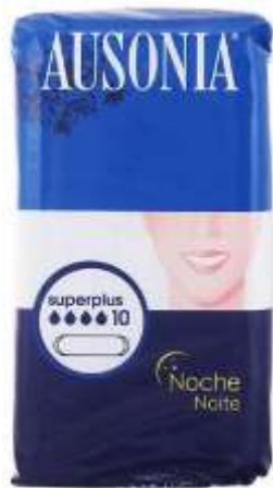
31043-NOITE AUSONIA SUPER PLUS 10 Un. Cx.10