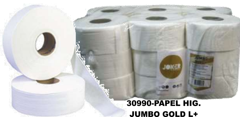
30990-PAPEL HIG. JUMBO GOLD L+ S/18 Rolos