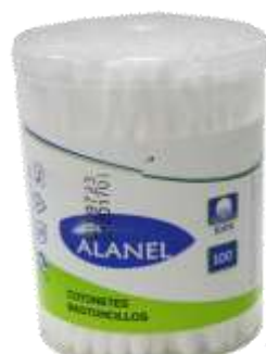
30472-COTONETES ALANEL 100 Unidades