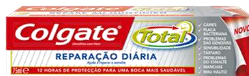
30013-DENT. COLGATE TOTAL REPARAÇÃO DIÁRIA 75 ml.