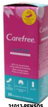
31013-PENSOS CAREFREE COTTON 20 un. Cx.12