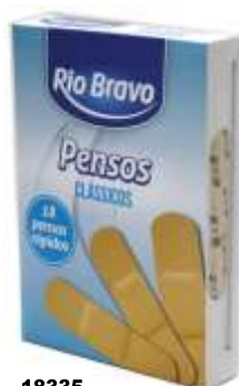
18335-PENSOS RAPIDOS R. BRAVO 18 un. Cx.12