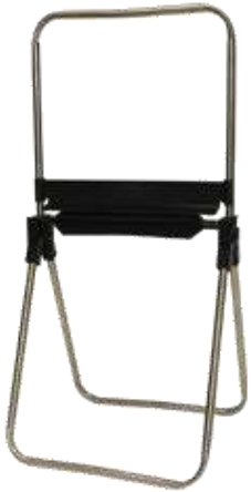
40734-SUPORTE P/ROLO INDUSTRIAL INOX P/CHÃO A-18007