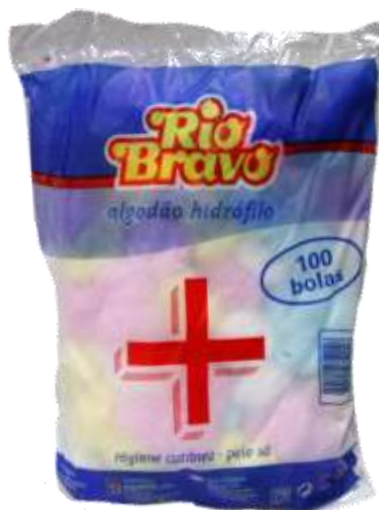
18415-ALGODÃO BOLAS CORES RIO BRAVO (100bolas) Cx.10