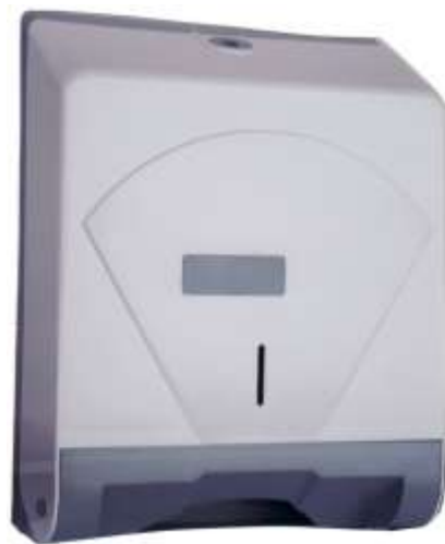
40736-SUPORTE P/TOALHAS MÃOS ZIG ZAG Ref.1231