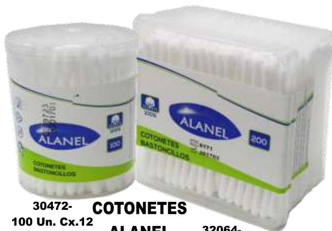
30472- COTONETES ALANEL 100 Un. Cx.12