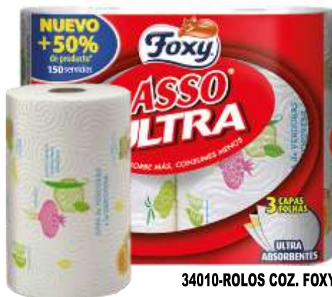
34010-ROLOS COZ. FOXY ASSO ULTRA F. TRIPLA 2 Rolos + 50% Grátis