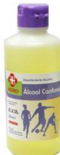
18404-ALCOOL CANFORADO 85 % 250 ml. Cx.24