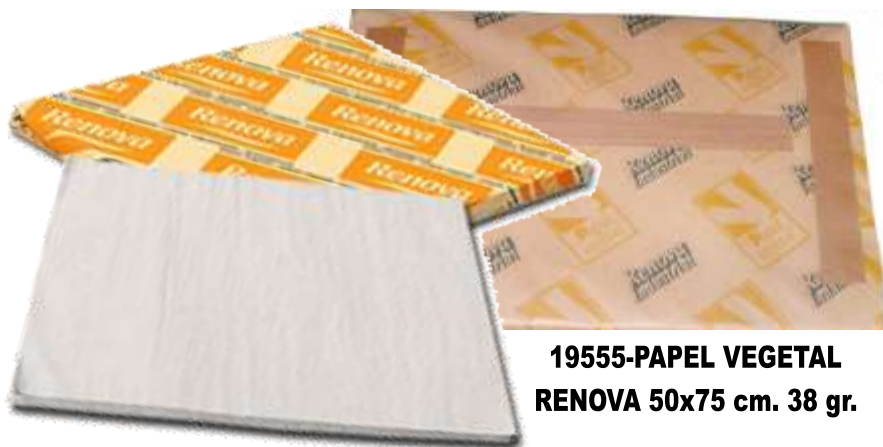
19555-PAPEL VEGETAL RENOVA 50x75 cm. 38 gr.