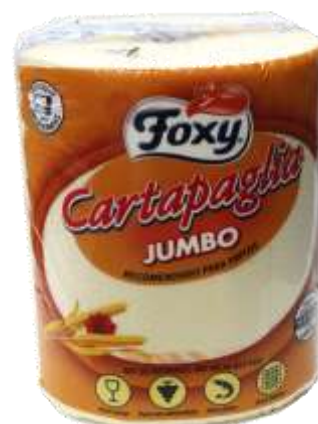
34025-ROLOS COZ. FOXY CARTAPLAGIA JUMBO ESPECIAL FRITOS F. DUPLA