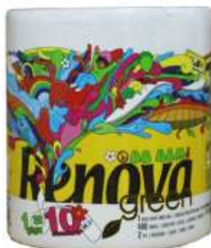
30884-ROLOS COZ. RENOVA GREEN GIGAROLO 1=10 Rolos S/12