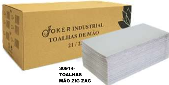
30914- TOALHAS MÃO ZIG ZAG JOKER RECICLADO GROFADO 21x23 cm. Cx.20 Maços