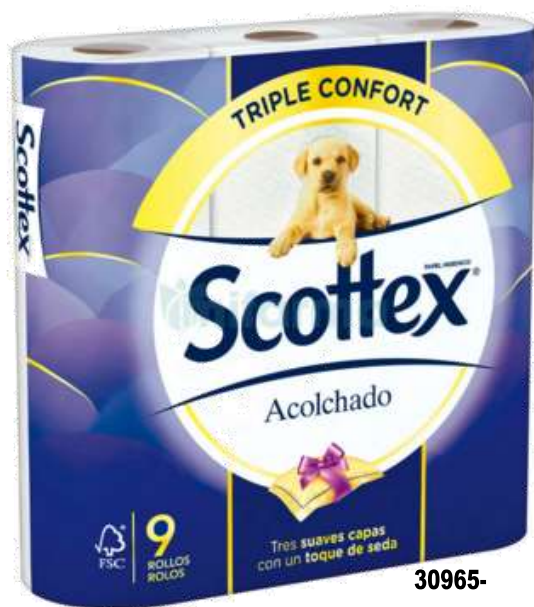
30965- PAPEL HIG. SCOTTEX ACOLCHOADO 9 Rolos Saco 7