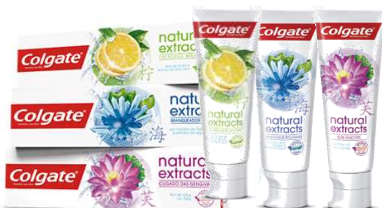
DENT. COLGATE NATURAL 75 ml.