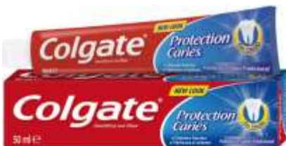
30025-DENT. COLGATE PROTECTION CARIES 50 ml.