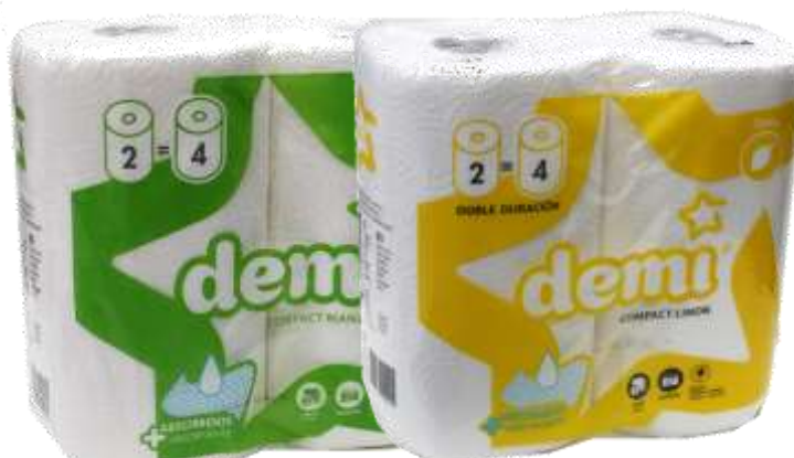
ROLOS COZ. DEMI COMPACT 2=4 Rolos S/12