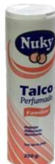
30456-TALCO PERFUMADO NUKY 200 gr.