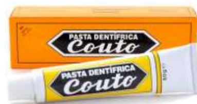
30003-DENTIFRICO COUTO 60 ml. Cx.12