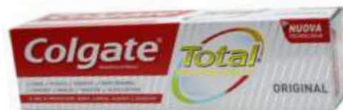
30041-DENT. COLGATE TOTAL ORIGINAL 75 ml.