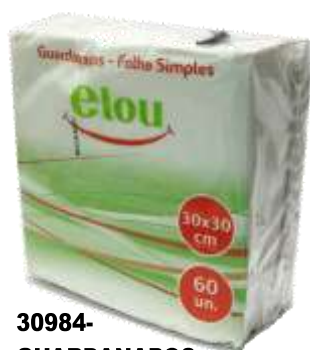
30984-GUARDANAPOS ELOU Folha SIMPLES 30x30 cm. 60 Un.