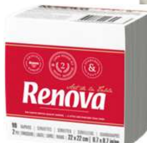
30851-GUARDANAPOS RENOVA B/100 Peq. 22x22 cm. Cx.36