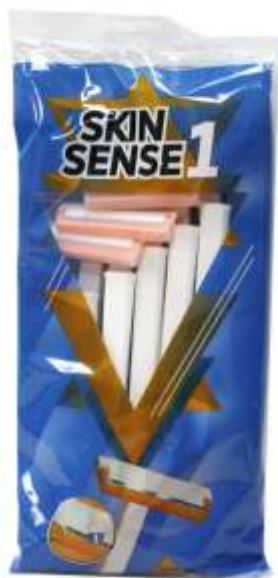
30163-MAQ. BARBEAR SKIN SENSE WHITE 1 10 Unidades Cx.20