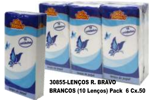
30855-LENÇOS R. BRAVO BRANCOS (10 Lenços) Pack 6 Cx.50