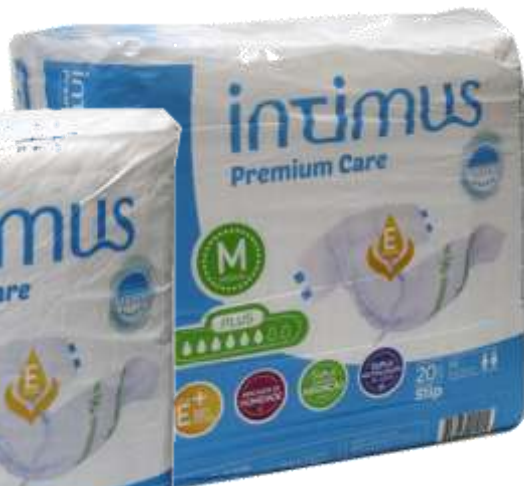
FRALDA INTIMUS ACAMADOS 20 Un. Cx.2