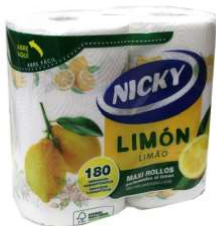
34028-ROLOS COZINHA NICKY MAXI LIMÃO 2 Rolos 180 Folhas Cx.12