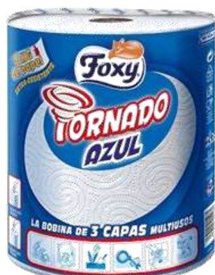
30879-ROLOS COZ. FOXY TORNADO AZUL 1 Kg.