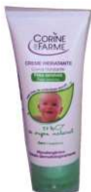
31700-CREME C. FARME HIDRATANTE BÉBÉ 100 ml. Cx.12