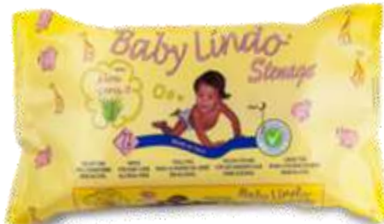
32810-TOALHITAS BABY LINDO REC. 80 un.