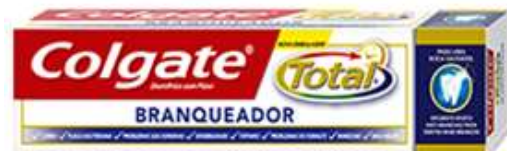
30006-DENT. COLGATE TOTAL BRANQUEADOR 75 ml.