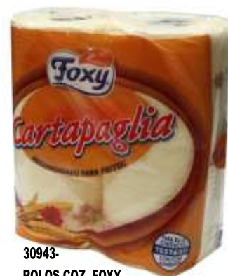
30943- ROLOS COZ. FOXY CARTAPLAGIA F. DUPLA 2 Rolos