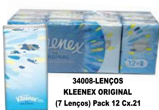
34008-LENÇOS KLEENEX ORIGINAL (7 Lenços) Pack 12 Cx.21

COM BALSAMO ALIVIA O NARIZ COM VITAMINA E