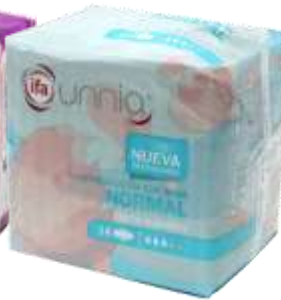
31083-NORMAL ULTRA ALAS 14 un. Cx.12