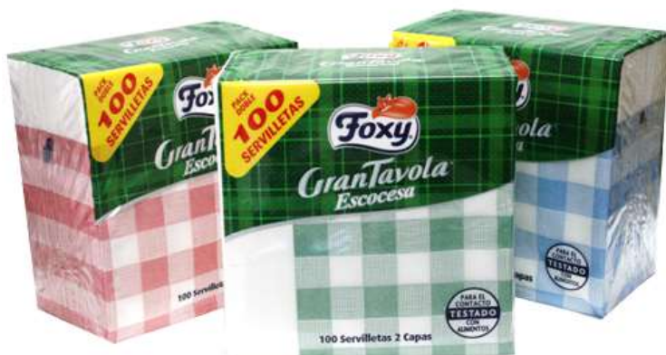
34021-GUARDANAPOS GRANTAVOLA FOXY Folha DUPLA DECOR 100 Unidades