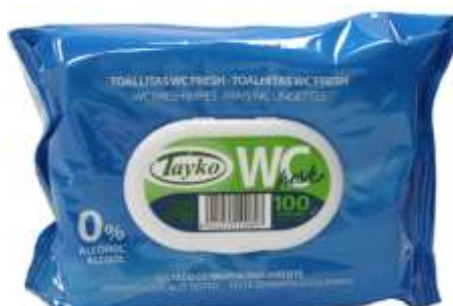
30967-TOALHITAS TAIKO W.C HUMIDAS 100 un.