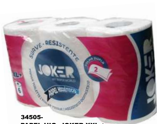
34505- PAPEL HIG. JOKER XXL + FOLHA DUPLA 6 Rolos Pt.10