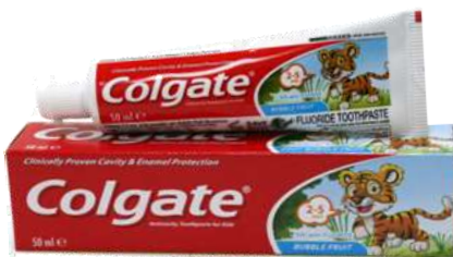
30026-DENT. COLGATE BUBBLE FRUIT 50 ml.