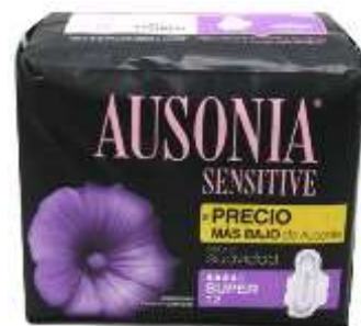
31078-PENSOS AUSONIA SENSITIVE SUPER Com ALAS 12 un. Cx.8