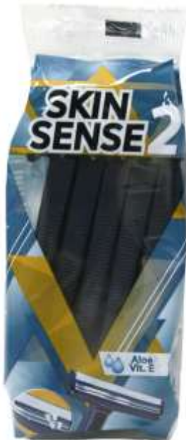
30210-MAQ. BARBEAR SKIN SENSE 2 10 Unidades Cx.20