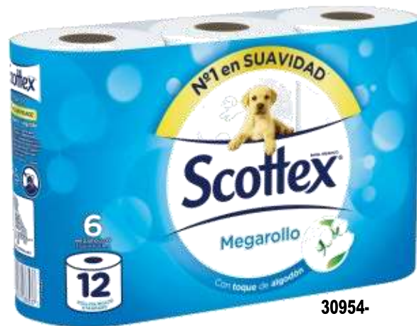
30954- PAPEL HIG. SCOTTEX MEGAROLLO 6=12 Rolos Saco 4