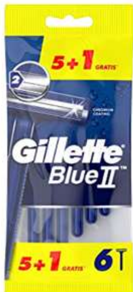
30230-MAQ. BARBEAR GILLETTE BLUE II FIXA 5+1 Maq.