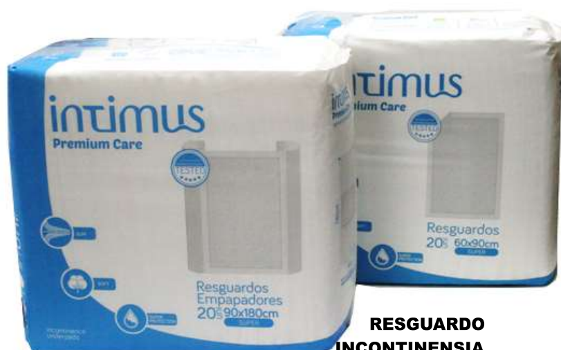
32813- 90x180 cm.