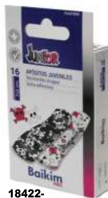
18422-JUNIOR (7x2 cm.) Com 16 Un.