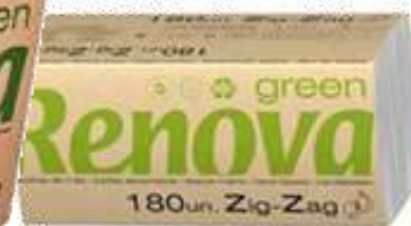
30907-TOALHAS ZIG ZAG GREEN RENOVA MAÇO 180 Folhas Cx.30