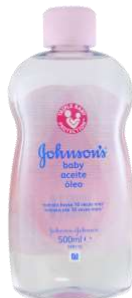
30072-OLEO JOHNSON BABY NORMAL (ROSA) 300 ml.