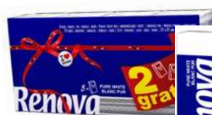
30864-LENÇOS RENOVA BRANCOS (9 Lenços) Pack 6+2