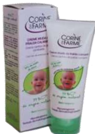
31704-CREME MUFA FRALDAS C. FARME 100 ml. Cx.12