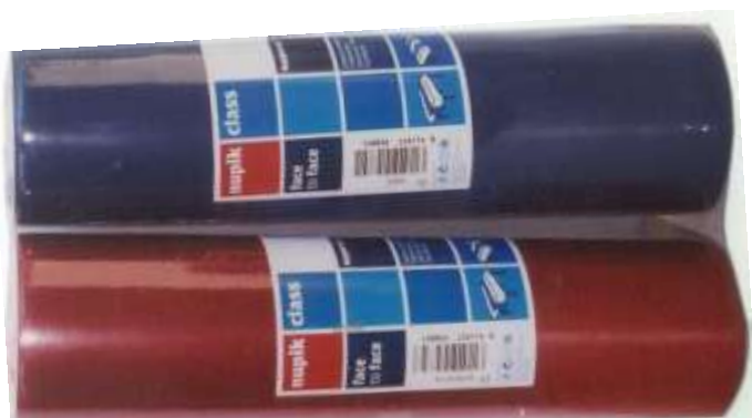
ROLO PAPEL FACE TO FACE 40x120 cm. x 25 un.