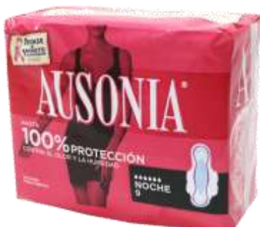
31074-PENSOS AUSONIA NOITE ALAS 9 Un. Cx.16