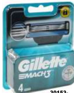
30153- LAMINAS GILLETTE MACH 3 - 4 Recargas