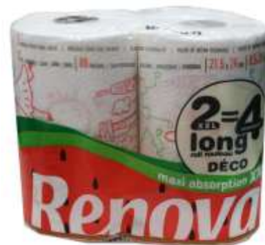
30868-ROLOS COZ. RENOVA MAXI ABSORVENTE DECOR XXL 2=4 S/12