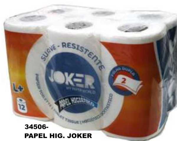
34506- PAPEL HIG. JOKER FOLHA DUPLA 12 Rolos Pt.9