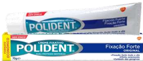
29999-POLIDENT CREME ORIGINAL EXTRA FORTE 70 gr.