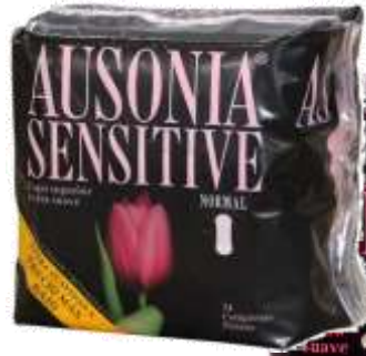
31033-NORMAL S/ALAS 14 Un. Cx.16 PENSOS AUSONIA SENSITIVE