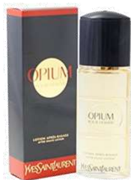
30283-AFTER SHAVE OPIUM 100 ml.