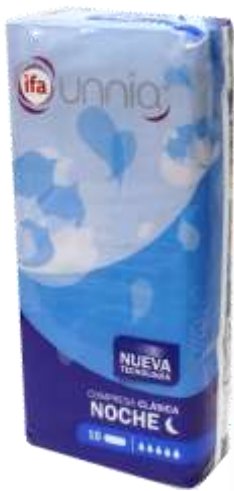
31081-CLASSICA NOITE 10 un. Cx.18