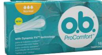
TAMPÕES OB 16 un. 31056-NORMAL - 31077-MINI