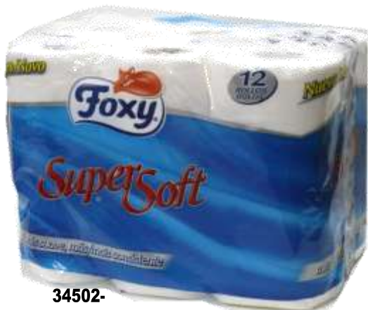
34502- PAPEL HIG. FOXY SUPER SOFT 12 Rolos