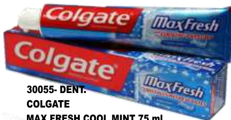
30055- DENT. COLGATE MAX FRESH COOL MINT 75 ml.