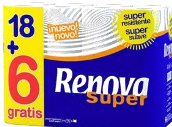
30959-PAPEL HIG. RENOVA SUPER 18+6 Rolos Grátis