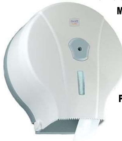
40738-SUPORTE P/PAPEL HIG. JUMBO