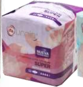
31082-SUPER ULTRA ALAS 12 un. Cx.12