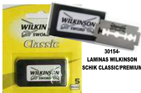
30154- LAMINAS WILKINSON SCHIK CLASSIC/PREMIUM