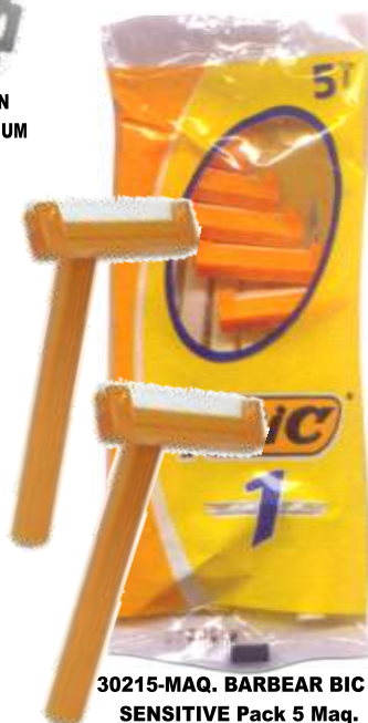
30215-MAQ. BARBEAR BIC 1 SENSITIVE Pack 5 Maq.