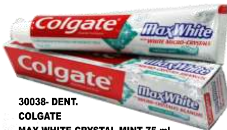
30038- DENT. COLGATE MAX WHITE CRYSTAL MINT 75 ml.