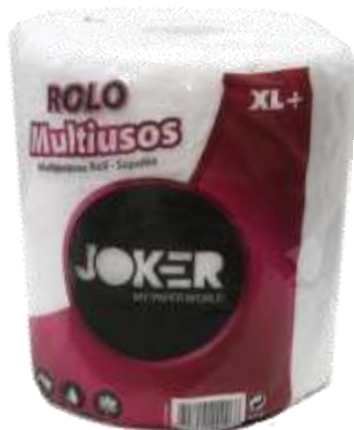
34026-ROLOS COZ. JOKER XL+ F. DUPLA Saco 12 Rolos