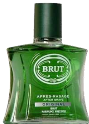
30255-A. SHAVE BRUT ORIGINAL 100 ml.