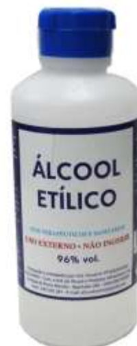
18423-ALCOOL ETILICO ALCOVINO 96° 250 ml. Cx.24