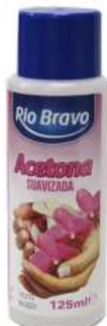
ACETONA R. BRAVO 18414- 125 ml.