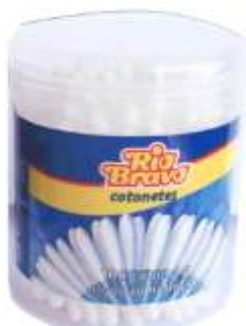
30468-COTONETES RIO BRAVO 100 un. Cx.12