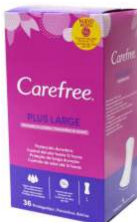
31076-PENSOS CAREFREE PLUS MAXI 36 Cx.12