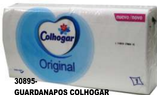
30895- GUARDANAPOS COLHOGAR F. SIMPLES 30x30 cm. 180 Un. Cx.36