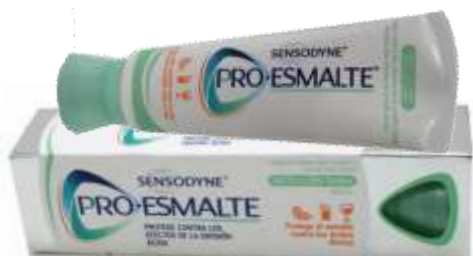
29985-DENT. SENSODYNE PRO-ESMALTE 75 ml. Cx.6