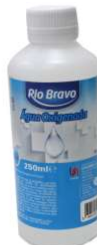
18402-AGUA OXIGENADA Rio Bravo 250 ml. Cx.12