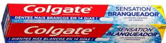
29992-DEN. COLGATE SENSATION BRANQUEADOR 75 ml.