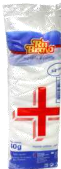
18416-ALGODÃO ZIG ZAG RIO BRAVO 40 gr. Cx.10