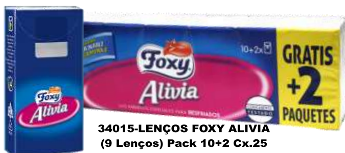
34015-LENÇOS FOXY ALIVIA (9 Lenços) Pack 10+2 Cx.25

COM BALSAMO ALIVIA O NARIZ COM VITAMINA E