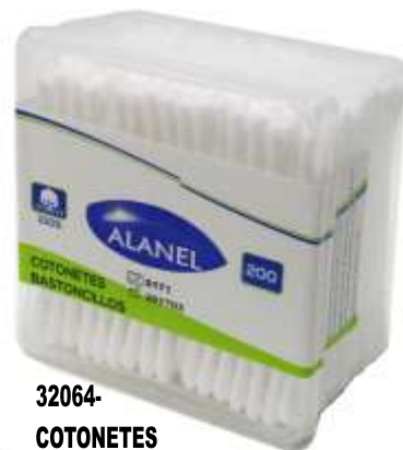
32064-COTONETES ALANEL 200 Unidades Cx.12