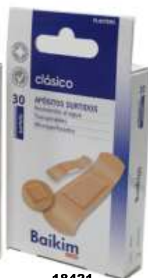
18421-SORTIDOS Com 30 Un.