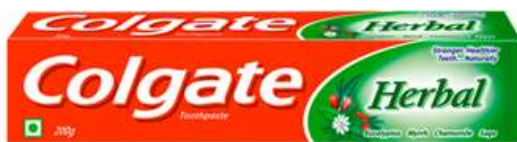
30042-DENT. COLGATE HERBAL 75 ml.