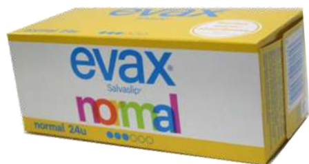
31072-PENSOS EVAX SALVA SLIP NORMAL 24 Un. Cx. 24