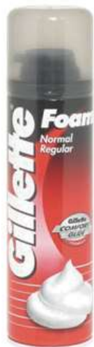
30128- ESPUMA BARBEAR GILLETTE REGULAR 200 ml.