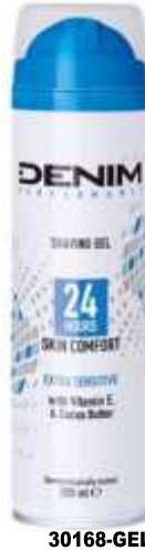
30168-GEL BARBEAR DENIM ESTRA SENST. 200 ml.