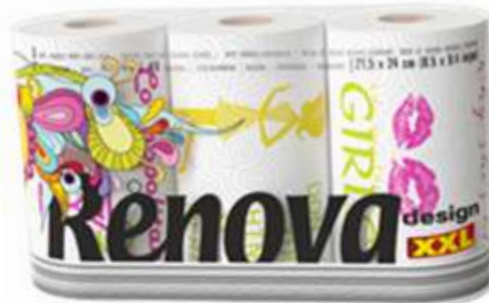
34014-ROLOS COZ. RENOVA DESIGN XXL (3=4,5) 3 Rolos Pt.10