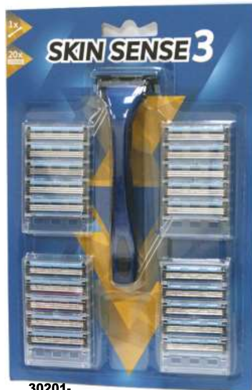
30201- MAQ. BARBEAR SKIN SENSE 3 + 20 CARREGADORES Cx.10