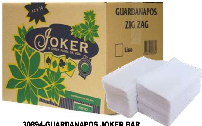
30894-GUARDANAPOS JOKER BAR ZIG ZAG LISO 14x14