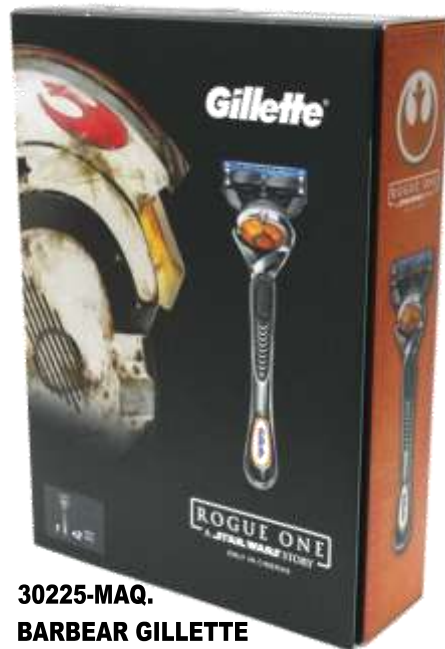
30225-MAQ. BARBEAR GILLETTE FUSION PROGLIDE + REC. Cx.8