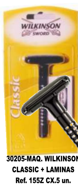
30205-MAQ. WILKINSON CLASSIC + LAMINAS Ref. 155Z CX.5 un.