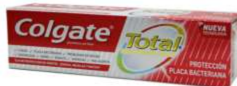
30019-DENT. COLGATE TOTAL PLACA ANTIBACTERIANA 75 ml.