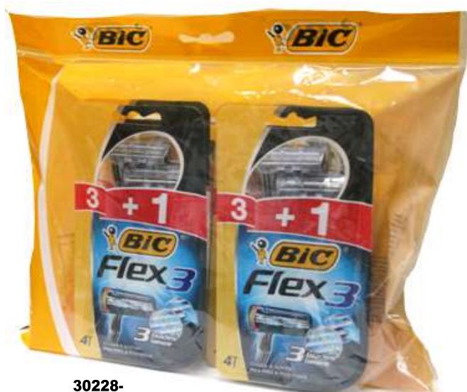
30228- MAQ. BARBEAR BIC 3+1 FLEX 3 Pt/4 Cx.20