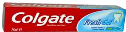
30023-DENT. COLGATE FLUOR GEL 75 ml.