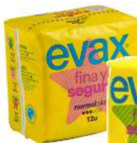
31041-NORMAL ALAS 12 un. Cx.16