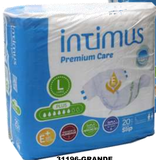
31196-GRANDE 120x160 cm.