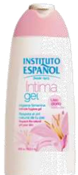
31792-GEL INTIMO INSTITUTO ESPANHOL 300 ml.