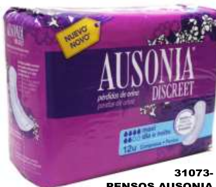
31073- PENSOS AUSONIA DISCREET MAXI 12 Un. Cx.4