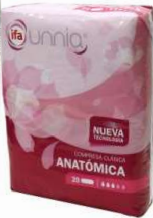
31080-ANATOMICA CLASSICA Sem ALAS 20 un. Cx.12