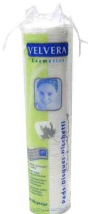
18425-DISCOS DESMAQUILHANTES VELVERA 100 un. Cx.24