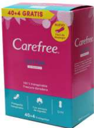
31066-PENSOS CAREFREE COTTON NORMAL 40+4 un. Cx.10