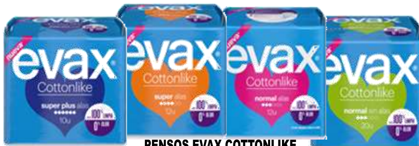
31020-SUPER PLUS ALAS 10 un. Cx.16