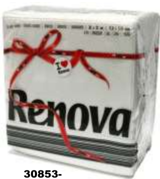
30853- GUARDANAPOS RENOVA T/E Cx.36