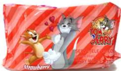
31131-TOALHITAS COTTONINO TOM&JERRY STRABERRY Recarga 72 un. Cx.12