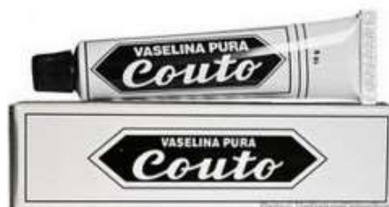
18412-VASELINA PURA COUTO 18 gr. Cx.12