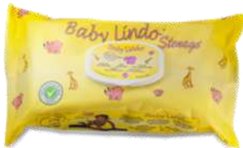
31107-TOALHITAS BABY LINDO REC. 72 un.