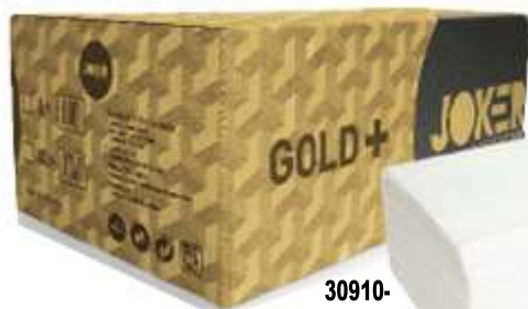
30910- TOALHAS MÃO ZIG ZAG JOKER GOLD 23x24 cm. (TISSUE) 20 Maços