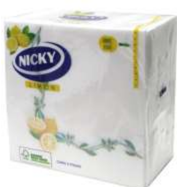
34027-GUARDANAPOS NICKY DECOR LIMÃO 33x33 cm. F. Dupla Cx.18