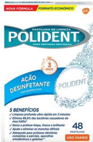
29984-POLIDENTE PASTILHAS OXIGENIO ACTIVO 48 Pastilhas Cx.6