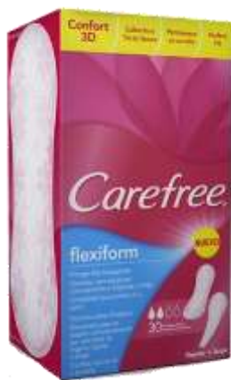
31064-PENSOS CAREFREE FLEXIFORM 30 un. Cx.10