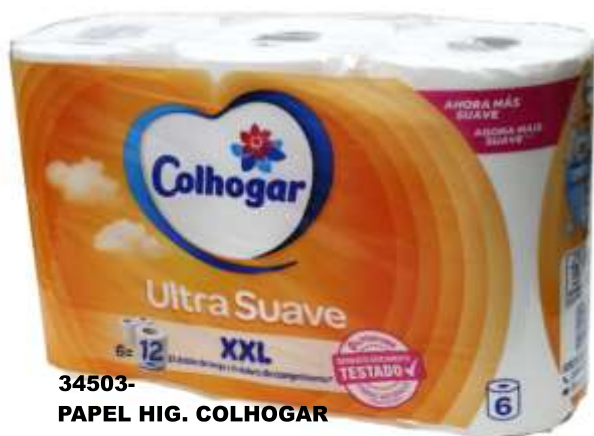
34503- PAPEL HIG. COLHOGAR ULTRA SUAVE XXL 6=12 Rolos Pt.7