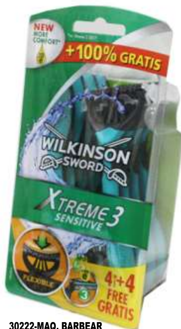
30222-MAQ. BARBEAR WILKINSON XTREME 3 SENSITIVE 4+4 Cx.10