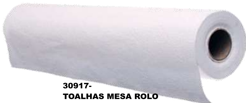
30917- TOALHAS MESA ROLO 1,20 Mt. (+- 150 mt.)