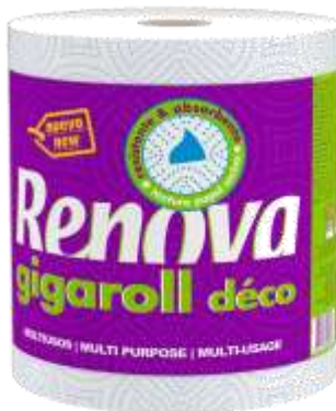
34017-ROLO COZ. RENOVA CIGAROLL DECO 1=10 Rolos