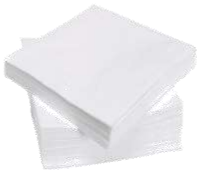
30883-GUARDANAPOS BAR D-1000 17x17 cm. Cx.30