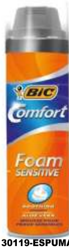
30119-ESPUMA BARBEAR BIC 200 ml.