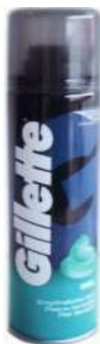
30103- GEL BARBEAR GILLETTE SENSITIVE 200 ml.