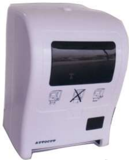
40705-SUPORTE P/TOALHA MÃO ROLO AUTOCORTANTE HCI