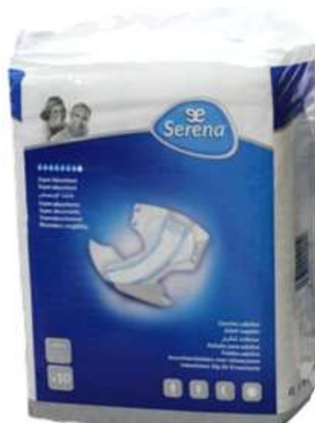
32806-FRALDAS SERENA ACAMADOS 10 un. GRANDE 110x150 cm.