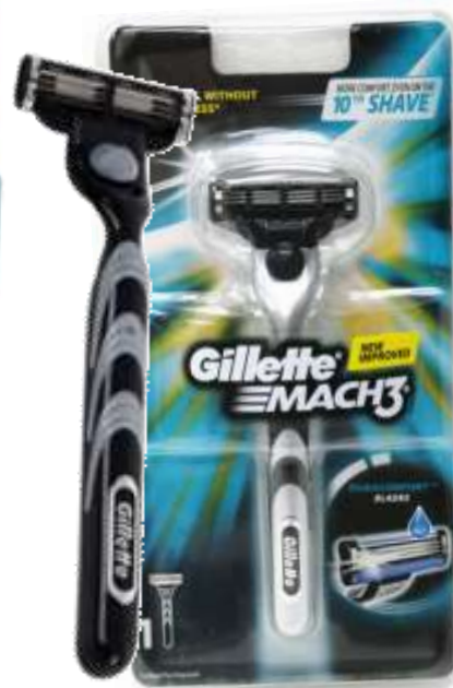
30207-MAQ. BARBEAR GILLETTE MACH 3 Cx.6