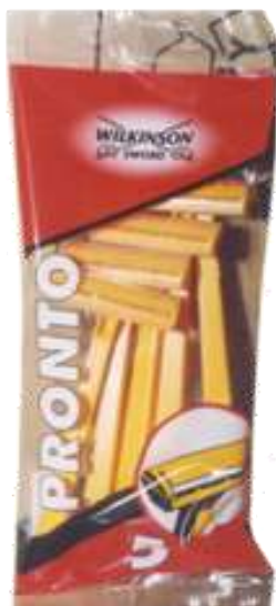
30232- MAQ. BARBEAR WILKINSON PRONTO 5 Maq. PAGUE 10 LEVE 20

PREÇO LIQUIDO DA ACÇÃO: 0,15 € / Pacote = 0,03 Por Unidade