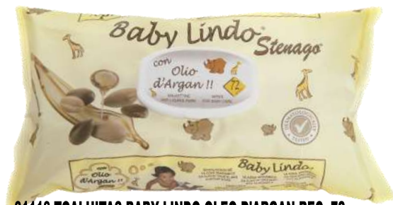
31118-TOALHITAS BABY LINDO OLEO D'ARGAN REC. 72 un.