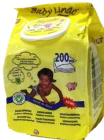
31197-TOALHITAS BABY LINDO Recarga 200 Un.