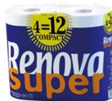
30961-PAPEL HIG. RENOVA SUPER 4=12 Rolos S/5