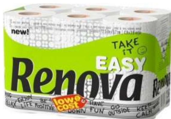
30968-PAPEL HIG. RENOVA EASY 12 Rolos Pt.9