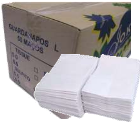
30870-GUARDANAPOS BAR JOKER TIPO L LISO