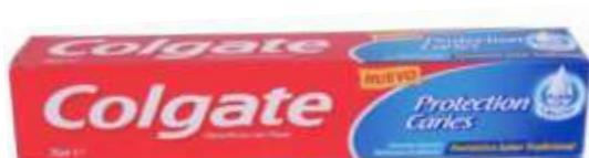
30021-DEN. COLGATE PROTECTION CARIES 75 ml.