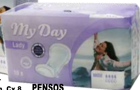
31070- MINI 16 Un. Cx.10