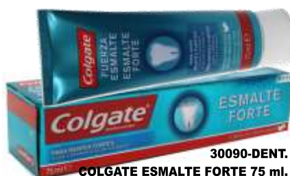
30090-DENT. COLGATE ESMALTE FORTE 75 ml.