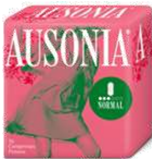
31048-PENSOS AUSONIA NORMAL S/ALAS 16 Un. Cx.16