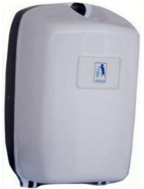
40740-SUPORTE P/TOALHAS MÃOS CHAMINÉ