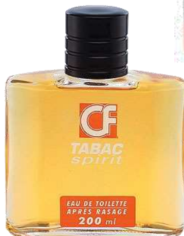
31734-EAU TOILETTE APRÉS RASAGE CORINE FARME MEN 200 ml.