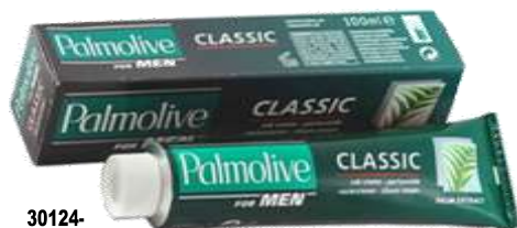
30124- CREME BARBEAR PALMOLIVE CLASSIC 100 ml. Cx.12