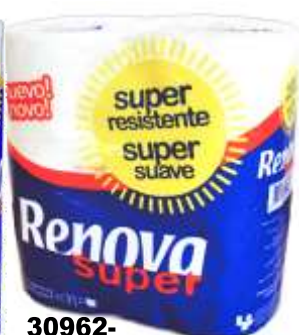
30962- PAPEL HIG. RENOVA SUPER 4 Rolos