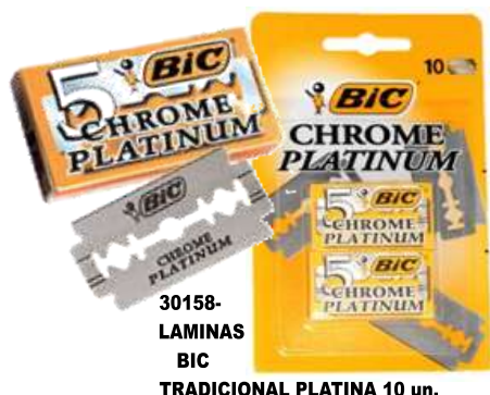
30158- LAMINAS BIC TRADICIONAL PLATINA 10 un.