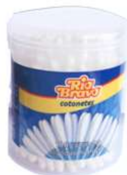
30468-COTONETES RIO BRAVO 100 U.