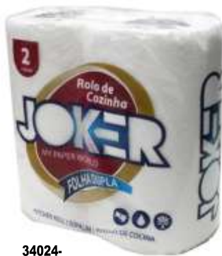
34024- ROLOS COZINHA JOKER L+ BRANCO F. DUPLA 2 Rolos Pt./24