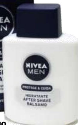
AFTER SHAVE NIVEA 100 ml.