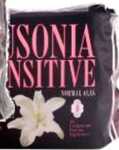
31046-NORMAL ALAS 14 Un. Cx.16