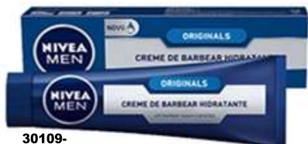
30109- CREME BARBEAR NIVEA ORIGINAL 100 ml.