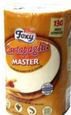
34019-ROLOS COZ. FOXY CARTAPAGLIA MASTER F. DUPLA 1 Rolo Saco 10