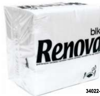
34022- GUARDANAPOS RENOVA Tipo G 40x40 BLK Branco F. DUPLA 75 Un.