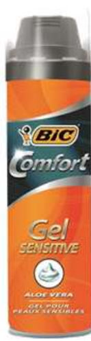
30137-GEL BARBEAR BIC 200 ml.