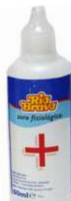
18405-SORO FISIOLÓGICO Rio Bravo 60 ml. Cx.25