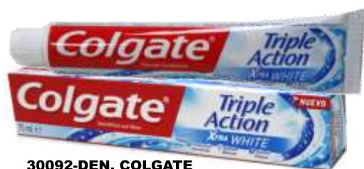
30092-DEN. COLGATE TRIPLE ACTION XTRA WHITE 75 ml.