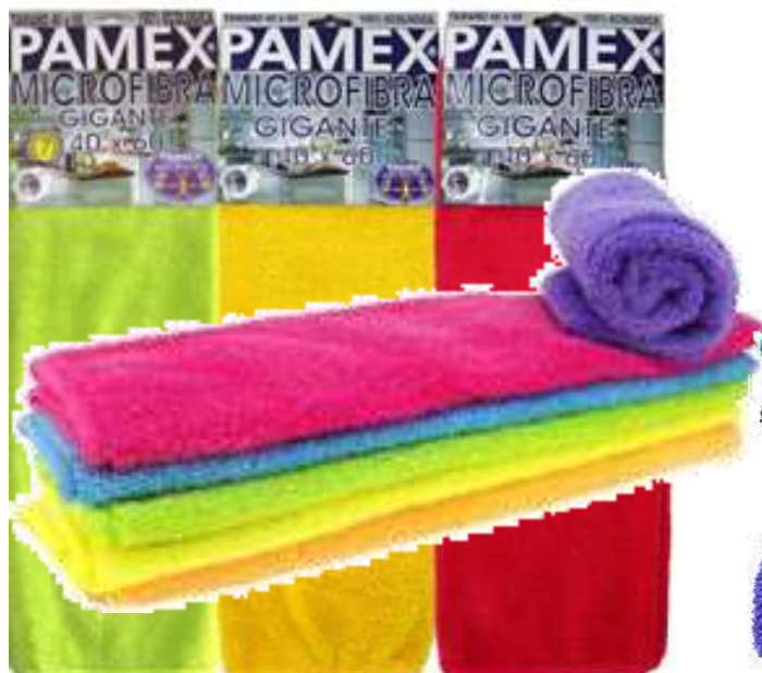
19695-PANOS MICROFIBRAS GIGANTE PAMEX 40x60 cm. S/12 (Cores Vivas)