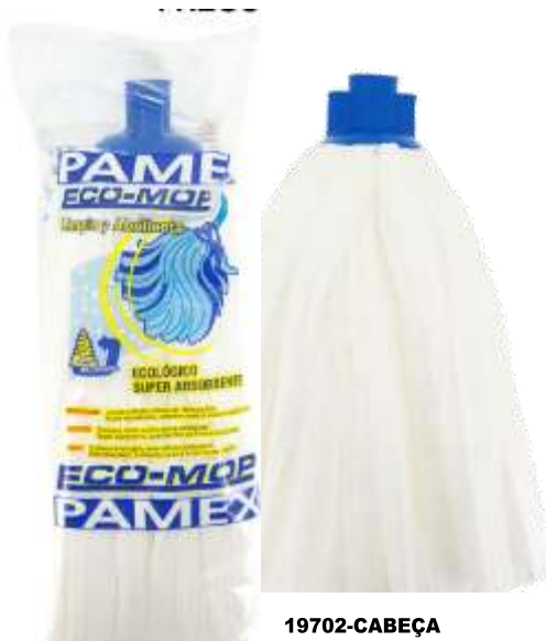
19702-CABEÇA ESFREGONA PAMEX 180 gr. ECO-MOP Cx.24