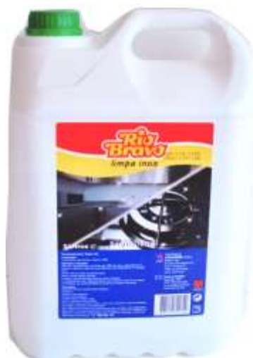
50465-LIMPA FORNOS DESENGORDURANTE R. BRAVO 4x5 Lt.