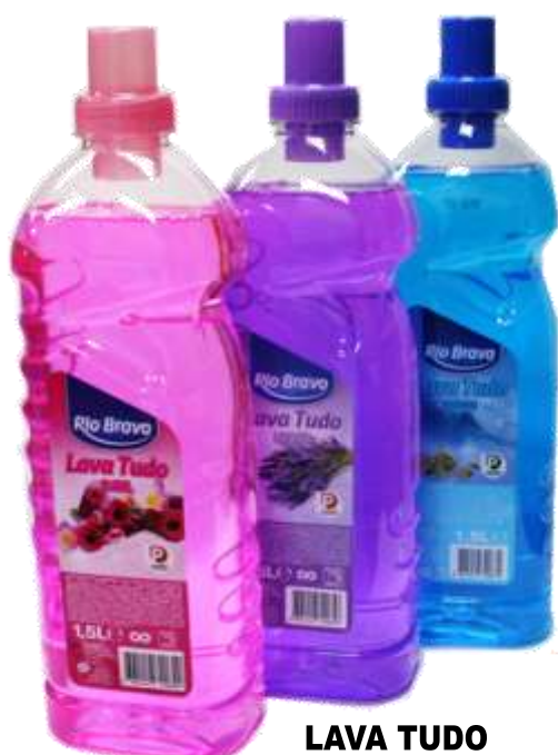
LAVA TUDO R. BRAVO 1,5 Lt. Cx.8 29955-FLORAL, 29956-LAVANDA, 29962-MARINHO