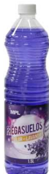
32342-L. TUDO MPL LAVANDA 1,5 Lt. Cx.8