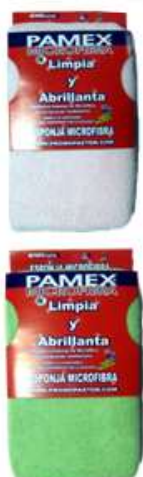
19735-ESPONJA MICROFIBRAS PAMEX 20x12 cm. Cx.12