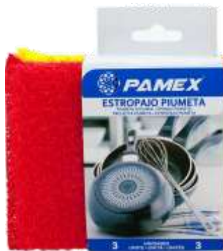
19907-ESFREGÕES PAMEX PIUMENTA Pack 3 un. Cx.24