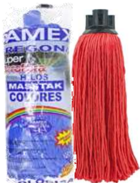
19704-CABEÇA ESFREGONA SUPER MICROFIBRAS MASTAK Cx.24