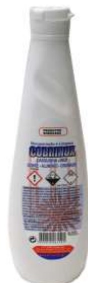
21531-COBRINHO LIMPA METAIS 500 ml. Cx.12