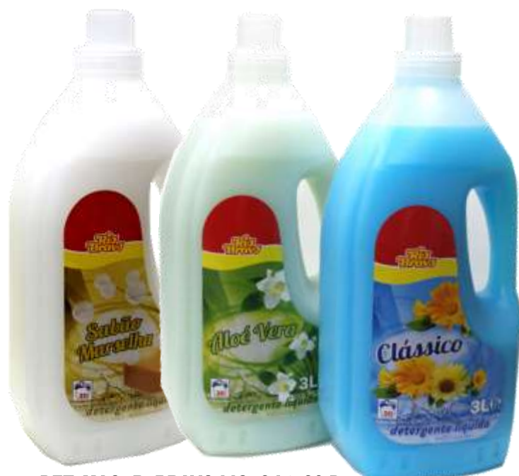
DET. MAQ. R. BRAVO LIQ. 3 Lt. 30 Doses 20077-SABÃO MARSELHA, 20041-ALOE VERA, 19959-CLASSICO