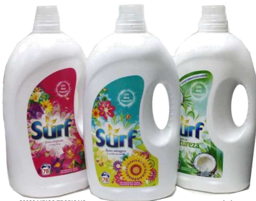
20026-LIRIOS TROPICAIS 19969-FLORES SELVAGENS 20240- CÔCÔ DET. MAQ. SURF LIQ. 3,90 Lt. 78 Doses Cx.2