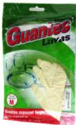
19287-LUVAS SATINADO GASA T/MÉDIO Pt.12