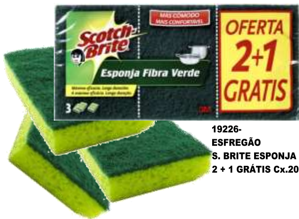
19226- ESFREGÃO S. BRITE ESPONJA 2 + 1 GRÁTIS Cx.20