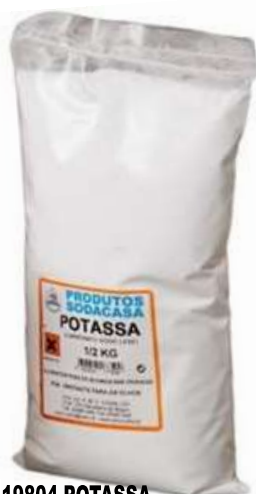
19804-POTASSA SOCASA Saco 1/2 Kg. Cx.24