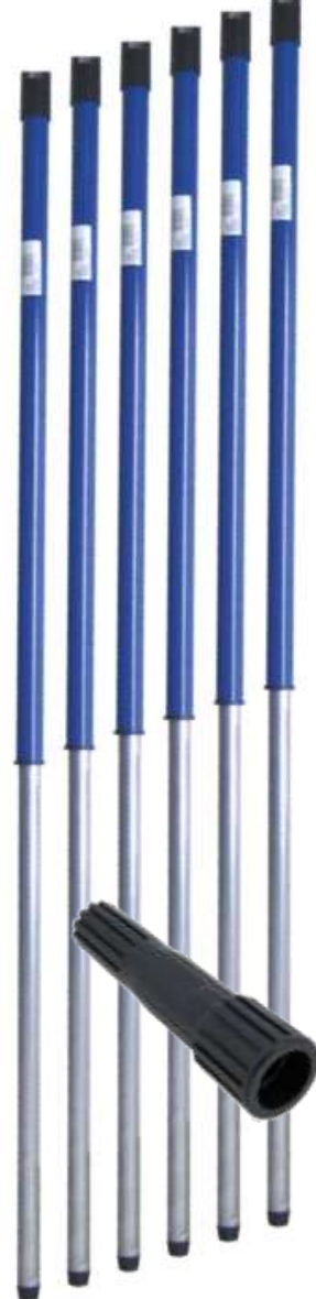
19729-CABOS EXTENSIVEL 2 Mt. C/ADAPTADOR PAMEX At./12