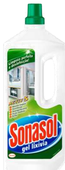
20944-SONASOL GEL L. TUDO C/LIXIVIA 650 ml. Cx.15