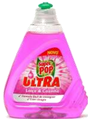
20138- LOIÇA & COZINHA 500 ml. Cx.12