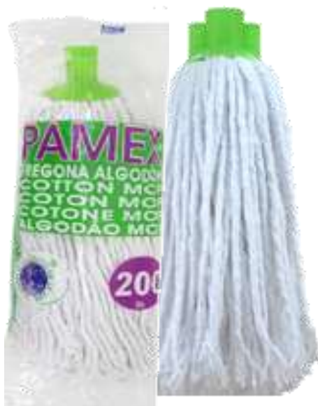
19699-CABEÇA ESFREGONA PAMEX 200 gr. ALGODÃO Cx.12