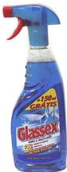
20521-GLASSEX MULTIUSOS C/PIST. 600+150 ml. Cx.12