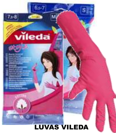
LUVAS VILEDA UNIVERSAL STYLE Cx.12 19299-T-M Médio 19249-T-S Pequeno