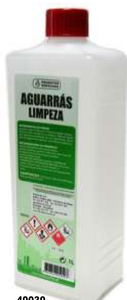
40030- AGUARRAZ LIMPEZA SODACASA 1 Lt. Cx.12