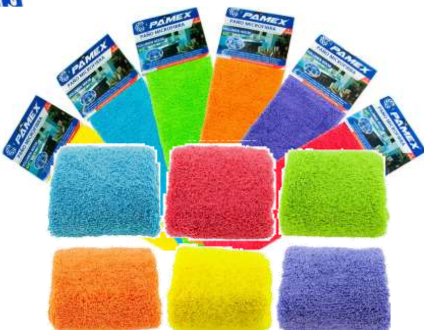
19719-PANOS MICROFIBRAS PAMEX 40x38 cm. Cx.12

PANO ANTI-BACTERIANO Com COBRE Composição 60% viscose, 40% fibra de cobre As micropartículas do pano eliminam até 99% dos germes e impedem o crescimento de bactérias no tecido sem ter que usar produtos químicos.