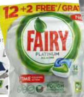
21658-DET. MAQ. LOIÇA FAIRY PLATINUM ORIGINAL 12+2 Past- Cx.5