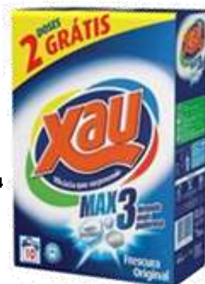
21394-HIGIENE & PROTEÇÃO

20010-DET. MAQ. XAU ORIGINAL (8+2) 10 Doses Cx.14