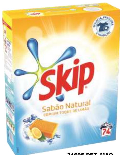
21695-DET. MAQ. SKIP SABÃO NATURAL 74 Doses