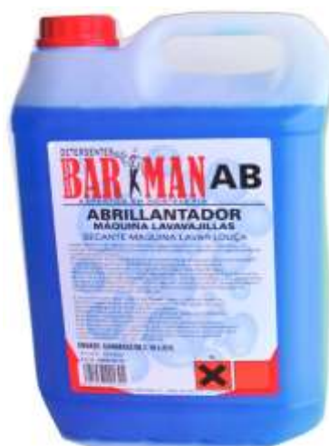
50470-BARMAN ABRILHANTADOR MAQ. LOIÇA (AB) 5 Lt. Cx.4

Quality Insured BAR K MAN EXPECIALISTAS EM HOTELARIA