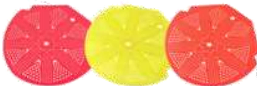
21512-TAPETE URINÁRIO ABSORVE ODORES PAMEX Cx.72