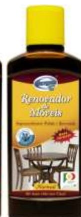
RENOVADOR MARGEM 150 ml. Cx.6 20558-ESCURO 20531-NORMAL