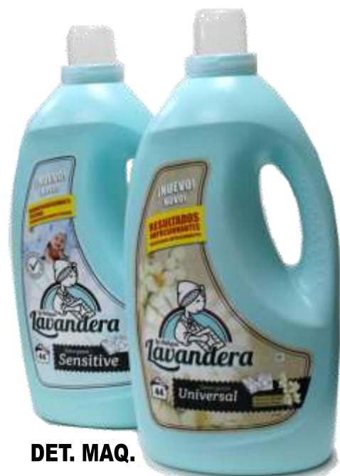
DET. MAQ. LIQ. LAVANDERA 44 Doses 21388-SENSITIVE, 21389-UNIVESAL