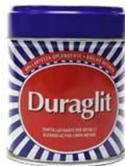
20535-DURAGLLIT LIMPA METAIS ALGODÃO 75 gr. Cx.12