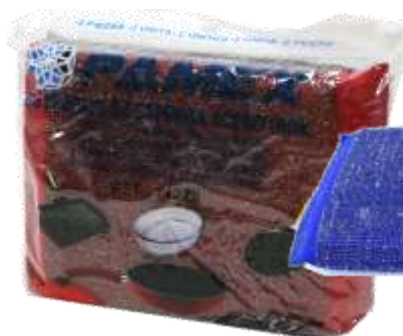
19741-ESFREGÕES ESPONJA INOX PAMEX Pack 2 un. REF.71228 Cx.12