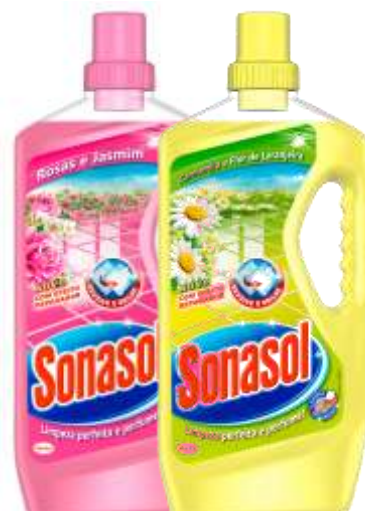
L.TUDO SONASOL 700ml. Cx.15 32207-ROSAS/JASMIM 20926-CAMOMILA/F.LARANJEIRA