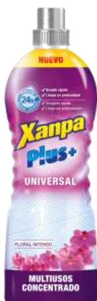
32215-XAMPA PLUS + UNIVERSAL 1 Lt. Cx.12