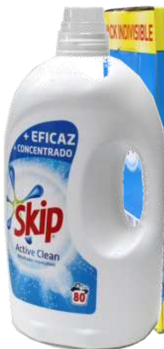
21398- DET. MAQ. SKIP LIQ. ACTIVE CLEAN XXL (2x80)= 160 Doses