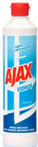
20154-AJAX LIMPA VIDROS 500 ml.