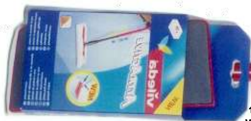
19181- VILEDA ATTRACTIVE KIT SISTEMA LIMPEZA C/CABO TELESCÓPIO Cx.6