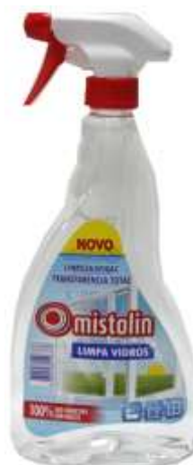
32218-MISTOLIN LIMPA VIDROS C/PISTOLA 750 ml.