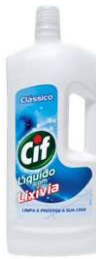
20133-CIF LIQ. C/LIXIVIA CLASSICO 700 ml.