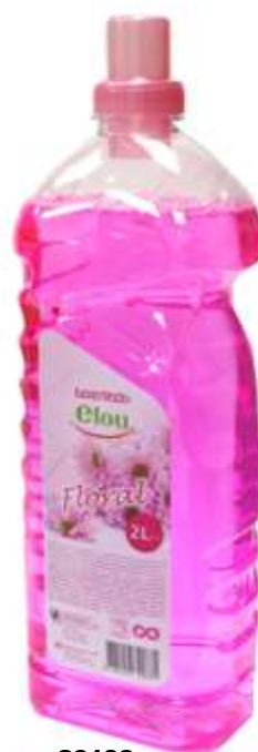
20193- L. TUDO ELOU 2 Lt. Cx.6