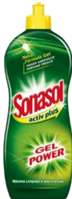
20226-SONASOL ACTIV PLUS GEL POWER 1,250 ml. Cx.12