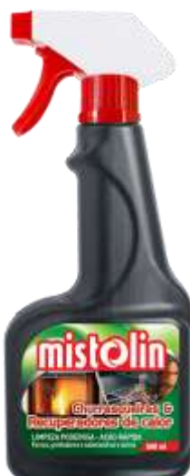
32335-MISTOLIN LIMPA VIDROS CHURRASQUEIRAS RECUPERADORES 500 ml. Cx.12