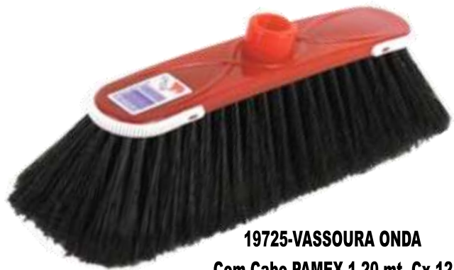
19725-VASSOURA ONDA Com Cabo PAMEX 1,20 mt. Cx.12