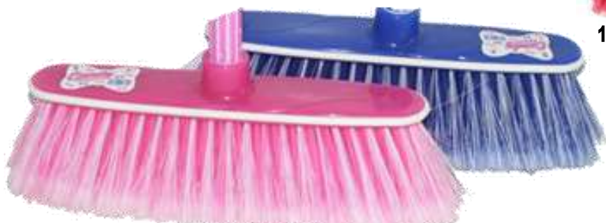
19909-VASSOURA CANDY Com CABO PAMEX