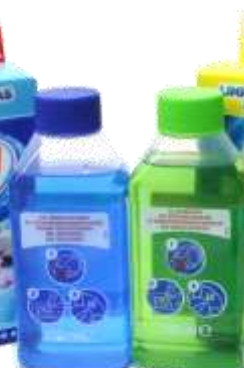
XAU LIMPA MAQUINAS ROUPA 250 ml. Cx.12