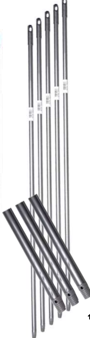
19728-CABOS TITANIO C/ROSCA/FURO PAMEX 1,40 Mt. At./12