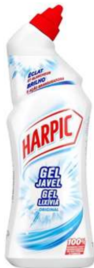
20464-HARPIC GEL CLÍXIVIA 750 ml. Cx.12