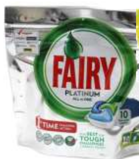
21675-DET. MAQ. LOIÇA FAIRY PLATINUM 10 Past.