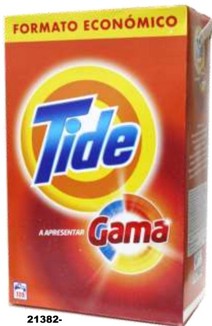
21382- DET. MAQ. TIDE 120 Doses