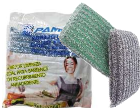
19742-ESFREGÕES ESPONJA INOX MEGA-R PAMEX Pack 2 un. REF.712047 Cx.12