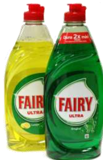
DET. LOIÇA FAIRY (Nac.) 480 ml. Cx.16 32214-LIMÃO, 32213-ORIGINAL