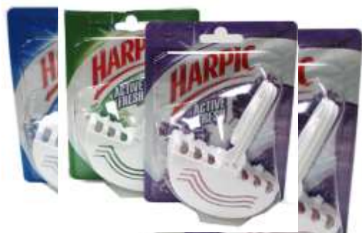
BLOCO SANITÁRIO HARPIC 38 gr. 20448-MARINE, 20416-PINHO, 20452-LAVANDA