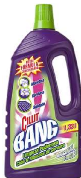
20512-CILIT BANG MANCHAS & GORDURAS 1,5 Lt.