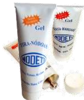
20609-TIRA NODOAS NODET 95 ml. Cx.12