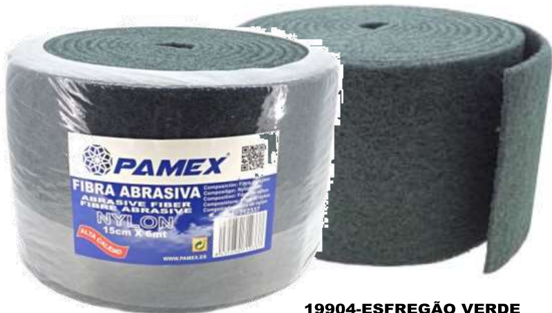
19904-ESFREGÃO VERDE FIBRA ABRASIVA ROLO PAMEX 15 cm. 6 mt. Cx.6