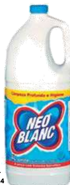
20392- 4 lt. Cx.4