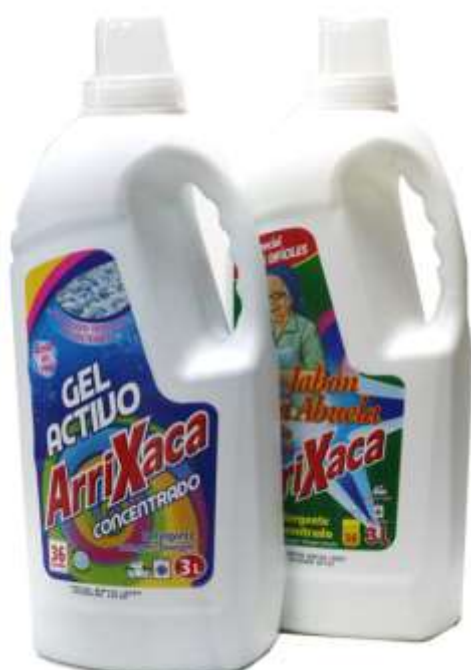
DET. MAQ. ARRIXACA LIQ. 3 Lt. 36 Doses Cx.4 20002-GEL ACTIVO 20435-SABÃO AVÔ