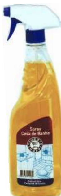
20167-EURO LIQ. CASA BANHO C/PISTOLA A. CALCÁRIO 1 Lt.