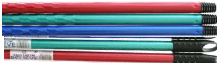
18652-CABO ALUMINIO RELIEVE 1,40 mt.