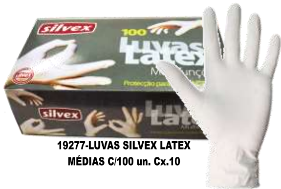
19277-LUVAS SILVEX LATEX MÉDIAS C/100 un. Cx.10