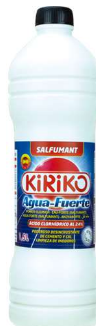
32339-L. TUDO KIRIKO AGUA FORTE 1,5 Lt. Cx.8