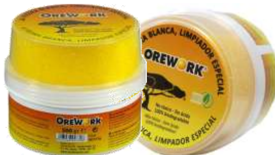
20945-DET. MULTIUSOS PEDRA BRANCA PASTA ONEWOK 500 gr.