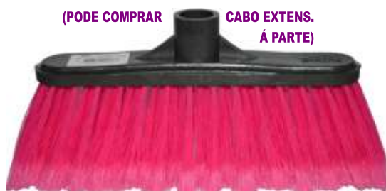
19634-VASSOURA ESPANADOR DIREITO Nº12B SIBINA C/Cabo Metalico 1,20 mt. Cx.12