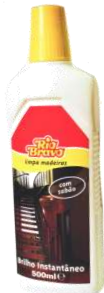
20575-LIMPA MADEIRAS C/SABÃO R. Bravo 500 ml.