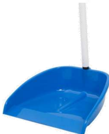
19748-PÁS PLASTICO GRANDE Com CABO PAMEX Cx.36