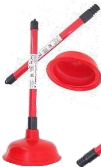
19901-DESENTUPIDOR BORRACAHA 36 Cm. PAMEX Cx.24