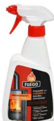
32326-L. VIDROS LAREIRAS/SALAMANDRAS OK FUEGO 500 ml.