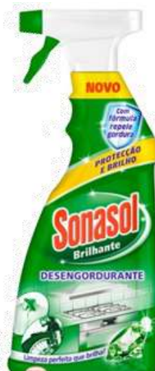
20941-SONASOL BRILHANTE DESENGORDURANTE C/PISTOLA 750ml. Cx.8