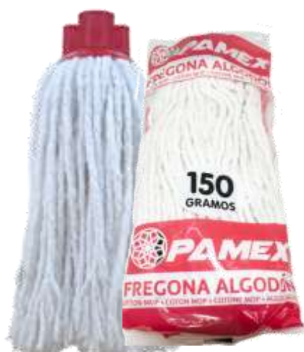
19131-CABEÇA ESFREGONA PAMEX 150 gr. ALGODÃO Cx.12