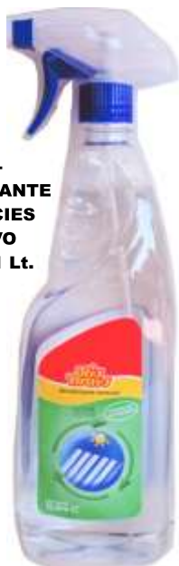
50462- DESINFECTANTE SUPERFICIES R. BRAVO C/Pistola1 Lt.