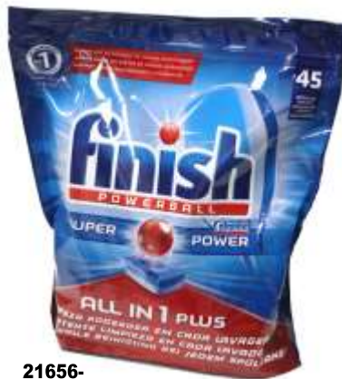
21656- DET. MAQ. LOIÇA Tudo em 1 FINISH REGULAR 45 Past.