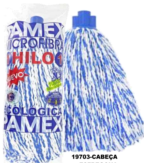
19703-CABEÇA ESFREGONA PAMEX LINHAS MICROFIBRAS Cx.24