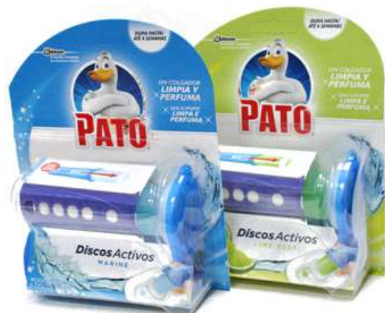
21468-W.C PATO DISCO + APARELHO Cx. MISTA (5 un. MARINE + 5 un. LIME)