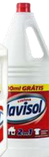
20387- 2,800 ml. Cx.6