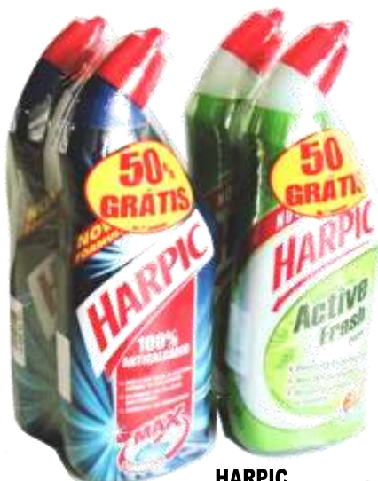
HARPIC LIQ. Pack 2x750 ml. 20430-ANTI-CACÁRIO, 20433-PINHO