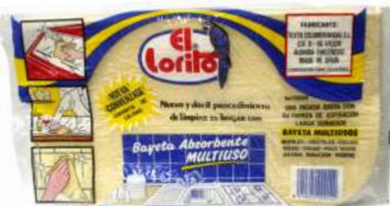
19169-PANOS MULTIUSOS EL LORITO Tipo CAMURÇA 40 cm. x 35 cm. Ref.00014 Emb.12