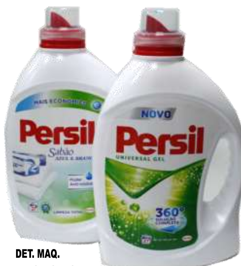
DET. MAQ. PERSIL GEL 27 Doses 21373-SABÃO AZUL&BRANCO, 21372-UNIVERSAL