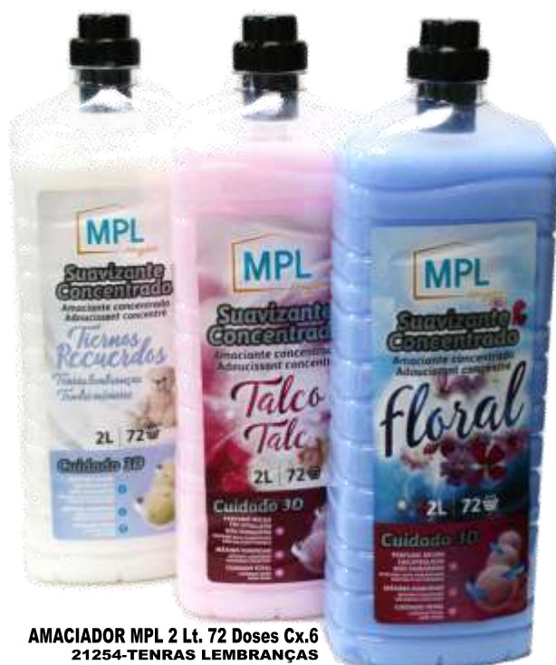
AMACIADOR MPL 2 Lt. 72 Doses Cx.6 21254-TENRAS LEMBRANÇAS 21252-TALCO ROSA 21253-FLORAL AZUL