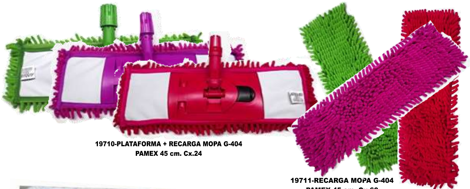
19710-PLATAFORMA + RECARGA MOPA G-404 PAMEX 45 cm. Cx.24