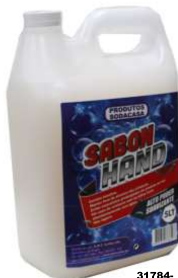
31784- SABONETE LIQ. SABONhand 5 Lt. Cx.4