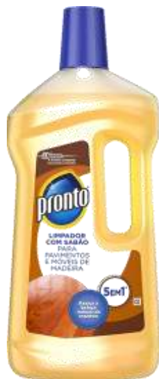
20530-PRONTO LIMPA MADEIRAS C/SABÃO 5em1 - 750 ml.