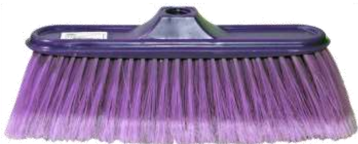
19640-VASSOURA ESPANADOR Nº11 ALTO D SIBINA C/Cabo Metalico 1,20 mt. Cx.12