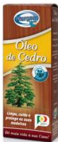
20572-OLEO CEDRO MARGEM 200 ml. Cx.12