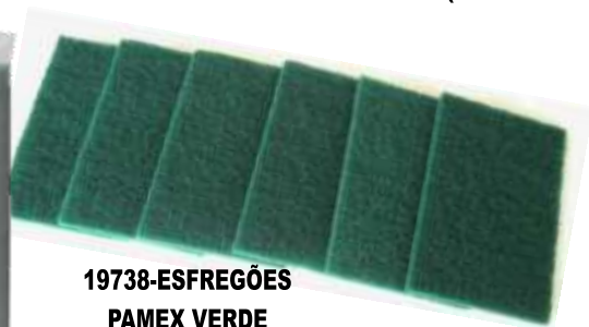
19738-ESFREGÕES PAMEX VERDE 10x15 Pack 6 un. Cx.24