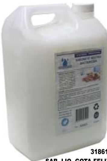
31861- SAB. LIQ. GOTA FELIZ BACTERICIDA NEUTRO 5 Lt. Cx.3