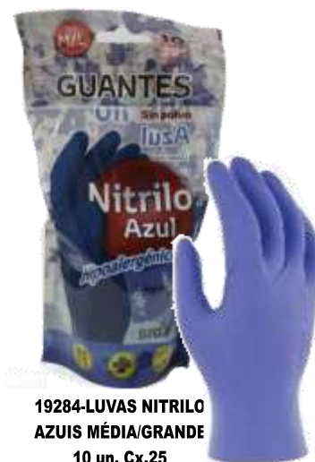
19284-LUVAS NITRIL AZUIS MÉDIA/GRANDE 10 un. Cx.25