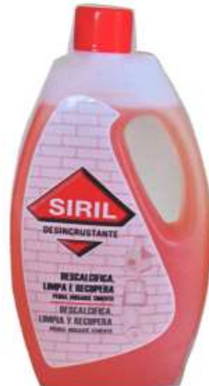
20519-SIRIL DESINCRUSTANTE 1 Lt.