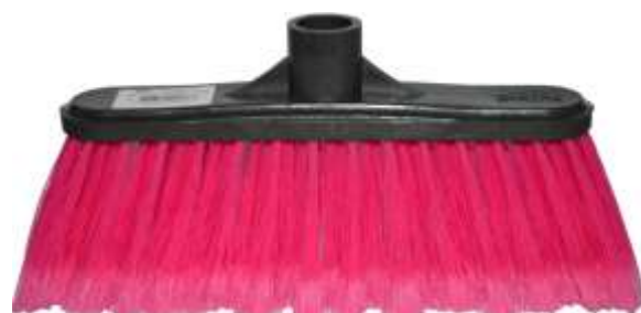
19634-VASSOURA ESPANADOR DIREITO N°12B SIBINA C/Cabo Metalico 1,20 mt. Cx.12