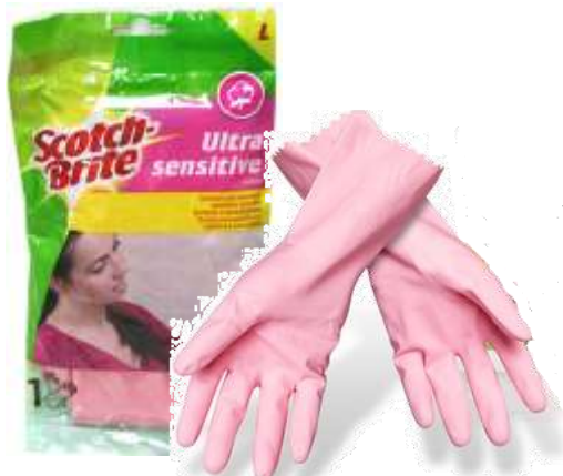
LUVAS S. BRITE SENSITIVE Cx.24 19297-MÉDIA 19298-GRANDE