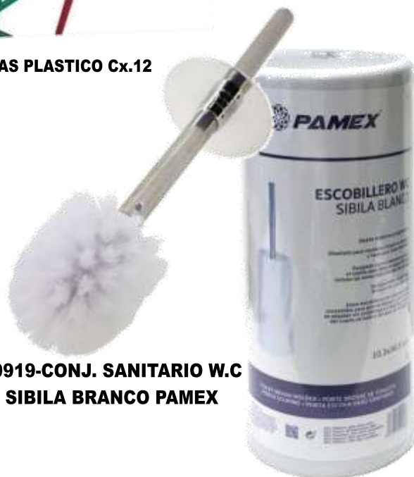
19919-CONJ. SANITARIO W.C SIBILA BRANCO PAMEX