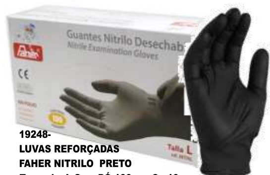
19248- LUVAS REFORÇADAS FAHER NITRIL PRETO Tamanho L Sem PÓ 100 un. Cx.10