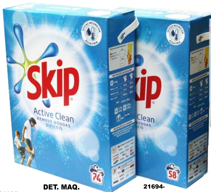
21695- 74 Doses Cx.4