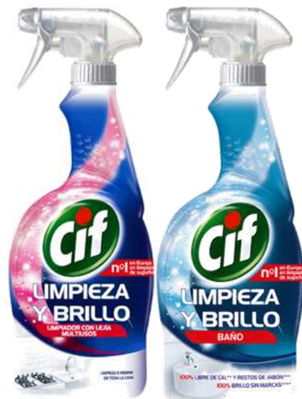
CIF LIMPEZA & BRILHO C/PISTOLA 750 ml.

20935-HERBAL 20130-C/Lixivia 20123-LIMÃO