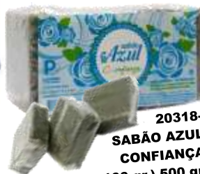
20318- SABÃO AZUL CONFIANÇA (5x100 gr.) 500 gr.