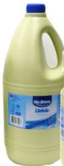
20380- 2,5 lt. Cx.6