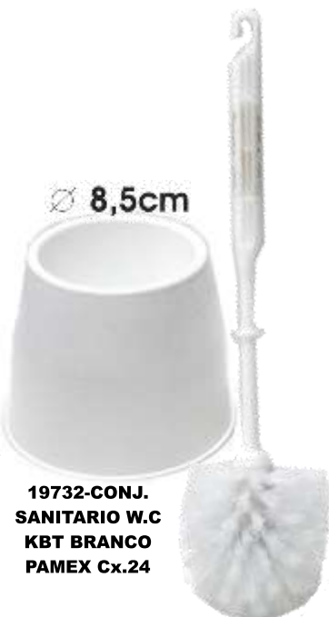
19732-CONJ. SANITARIO W.C KBT BRANCO PAMEX Cx.24