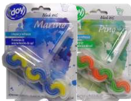
BLOCO SANITARIO TDOY 45 gr. Cx.12 21509-MARINHO, 21510-PINHO