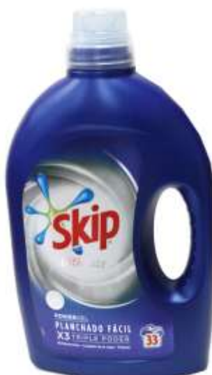
21697-DET. MAQ. SKIP LIQ. ULTIMATE ENGOMA FÁCIL 1,65 Lt. 33 Doses