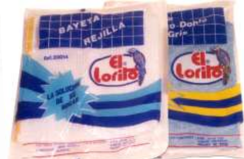
19165-PANOS PÓ EL LORITO Ref.2008 Emb.12