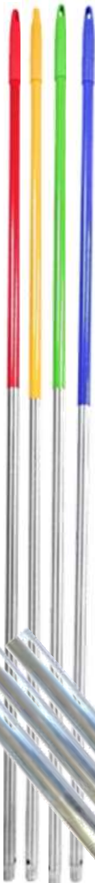
19644-CABOS ALUMINIO PAMEX 1,40 Mt. At./12

340 Gramas MAIS FORTE E RESISTENTE Á PROVA DE GOLPES