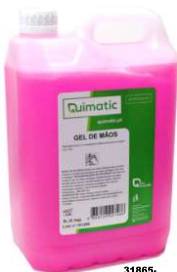
31865- SAB. LIQ. GEL QUIMATIC ROSA 5 Lt. Cx.3