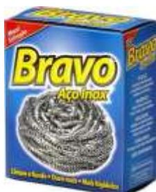
19089-ESFREGÕES BRAVO AÇO INOX