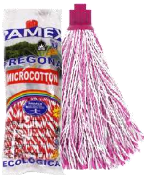
19700-CABEÇA ESFREGONA PAMEX 180 gr. MICROCOTTON Cx.24