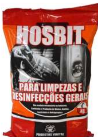
19809-LAVA VASILHA HOSBIT 1 Kg.