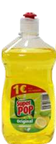
32324-DET. LOIÇA SUPER POP LIMÃO 460 ml.