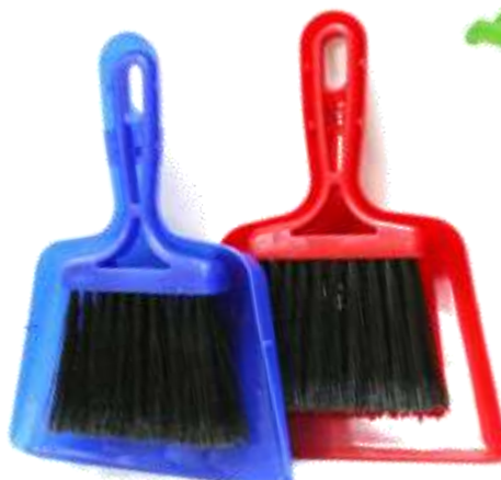
19910-PÁ DO LIXO C/VASSOURA PEQUENA PAMEX Cx.12