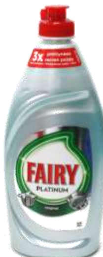
32332-DET. LOIÇA FAIRY PLATINUM 500 ml. Cx.16