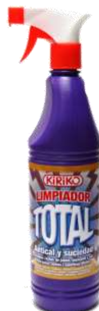
29952-KIRIKO LIMPADOR TOTAL C/PISTOLA 750 ml.