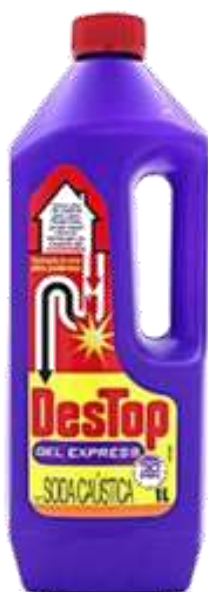
20584-DESTOP EXPRESS GEL DESENTUPIDOR 1 Lt. Cx.8