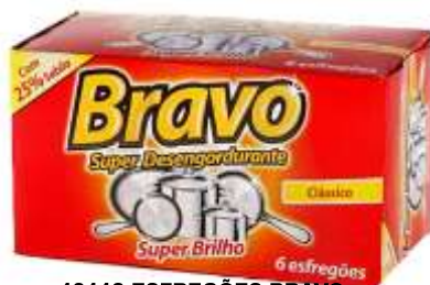
19113-ESFREGÕES BRAVO CLASSICO Cx.60