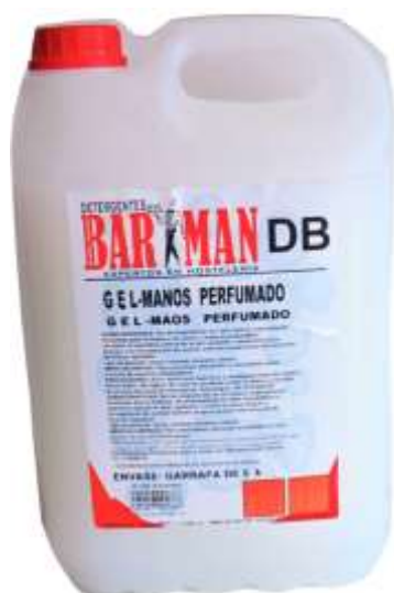
50475-BARMAN GEL MÃOS PERFUMADO ALIM./HOSPITALAR (DB) 4x5 Lt.