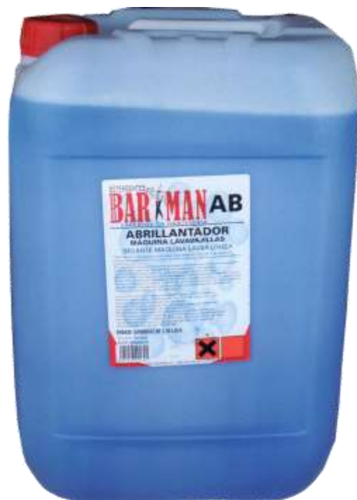
50487-BARMAN ABRILHANTADOR Maq. Loiça Industrial (AB) 25 Kg.