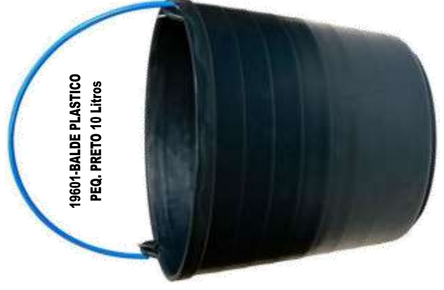
19601-BALDE PLASTICO PEQ. PRETO 10 Litros