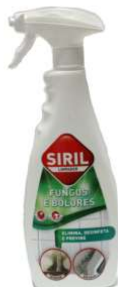
32209-SIRIL LIMPA FUNGOS E BOLORES 500 ml. Cx.12