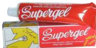
20615-TIRA NODOAS SUPER GEL 100 gr.