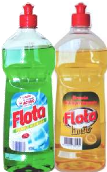
DET. LOIÇA FLOTA 850 ml. 20185-VERDE 20234-LIMÃO 850 ml.