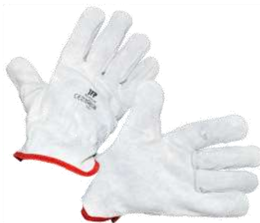
19289-LUVAS Tipo CHEFE PELR GENUINA Branca MÉDIA Nº9 Cx.12