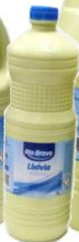
20397- 1 lt. Cx.12