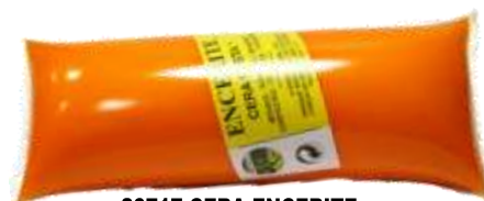
20717-CERA ENCRITE AMARELA BOLSA 250 gr. Cx.12