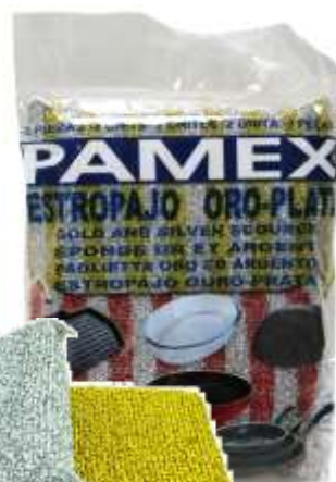
19908-ESFREGÕES ESPONJA INOX PAMEX ORO-PLATA Pack 2 un. Cx.12