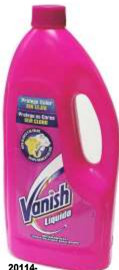
20114- VANISH LIXIVIA ROUPA DELICADA 1 Lt. Cx.12