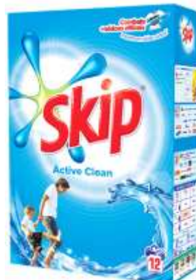
21370-DET. MAQ. SKIP A. CLEAN 12 Doses