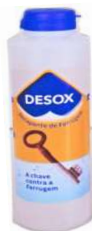
20541-DESOX REMOVEDOR FERRUGEM 300 gr.