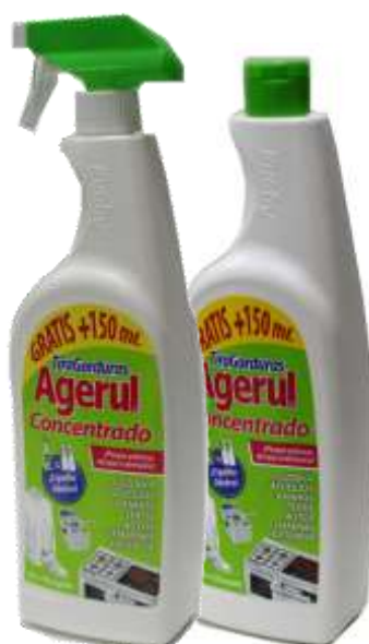
ALGERUL TIRA GORDURAS