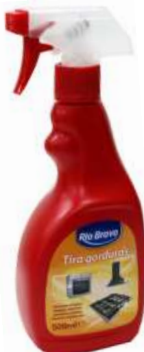
20566-R. Bravo TIRA GORDURAS C/PISTOLA 750 ml.