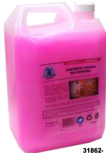
31862- SAB. LIQ. GOTA FELIZ BACTERICIDA ROSA 5 Lt. Cx.3