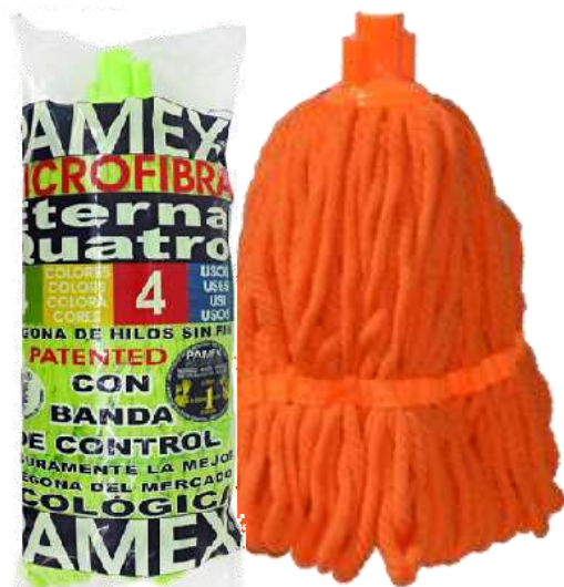
19706-CABEÇA ESFREGONA SUPER MICROFIBRAS DE CORES ETERNA Cx.24