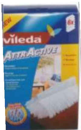
19209-VILED A ESPANADOR AGARRA PÓ RECARGA Cx.6