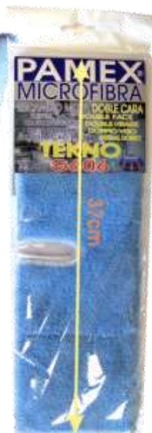
19713-RECARGA MOPA PAMEX 2 FACES G-606 37 cm. Cx.6