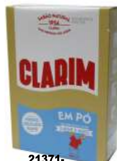
21371- DET. MANUAL CLARIM EM PÓ 540 gr. Cx.6