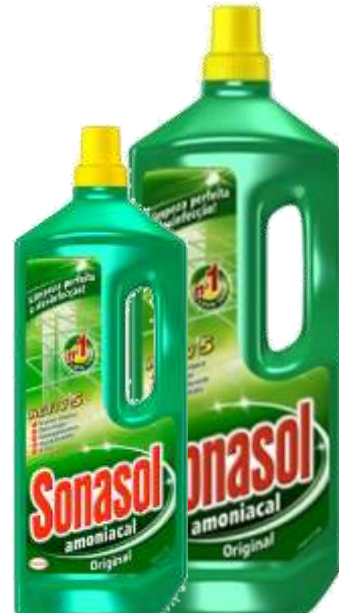
SONASOL ORIGINAL AMONICAL 29942- 20931- 650 ml. cx.16 1,3 Lt. Cx.12