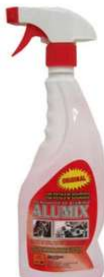
20580-LIMPADOR ALUMÍNIO C/PIST. 750 ml. Cx.12