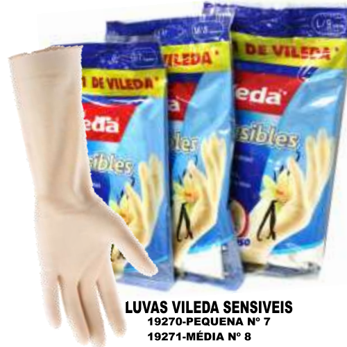
LUVAS VILEDA SENSIVEIS 19270-PEQUENA Nº 7 19271-MÉDIA Nº 8 19272-GRANDE Nº 9