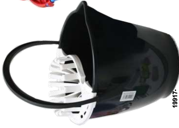
19917- BALDE 13 Lt. PLASTICO + ESPRIMEDOR PAMEX