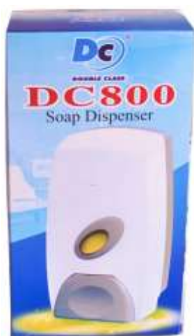
50480-SUPORTE P/SABONETEIRA DC-800