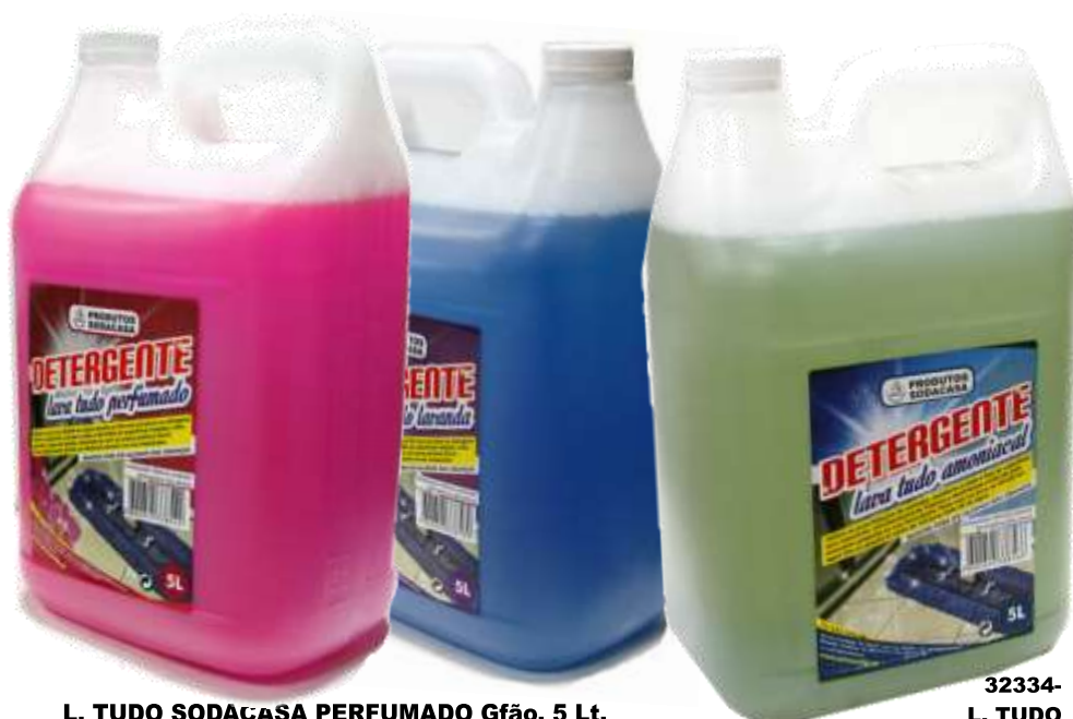
L. TUDO SODACASA PERFUMADO Gfão. 5 Lt. 29954-FLORAL, 20921-LAVANDA