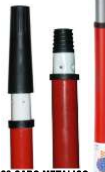
18629-CABO METALICO EXTENSIVEL C/ADAPTADOR 1,5 Mt. PAMEX At./12