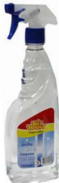
32322-R. Bravo LIMPA VIDROS C/PISTOLA 750 ml.