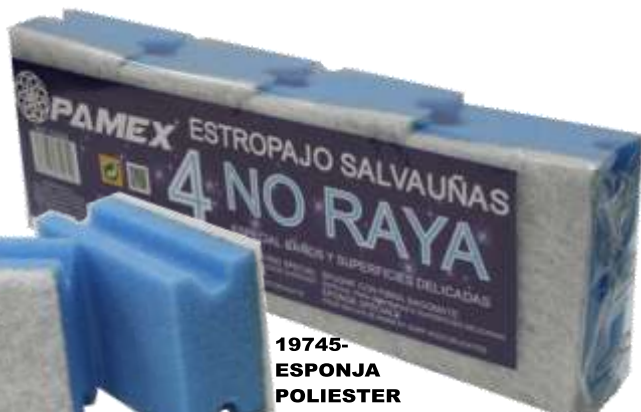
19745-ESPONJA POLIESTER S. UNHAS PAMEX Pack 4 un. Ref.712320 Cx.24 (NÃO RISCA)