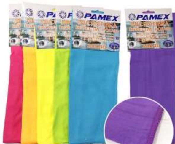
19707-PANOS PÓ MICROFIBRAS PAMEX 30x40 cm. Cx.12