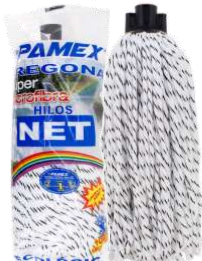
19911-CABEÇA ESFREGONA PAMEX HILOS MICROFIBRAS NET Cx.24