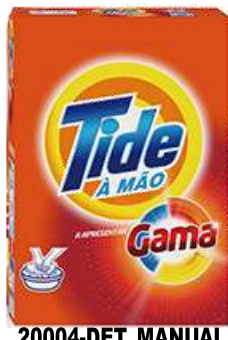
20004-DET. MANUAL TIDE E-3 Cx12