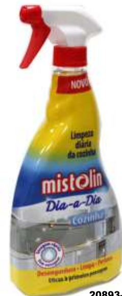
20893- MISTOLIN DIA DIA COZINHA 750 ml. Cx.12