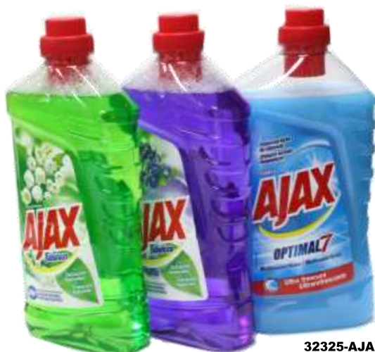
AJAX FABULOSO 1 Lt. Cx.12 20142-LAVANDO, 20210-MONTANHA, 20151-FLORES PRIMAVERA, 20189-FLORAL