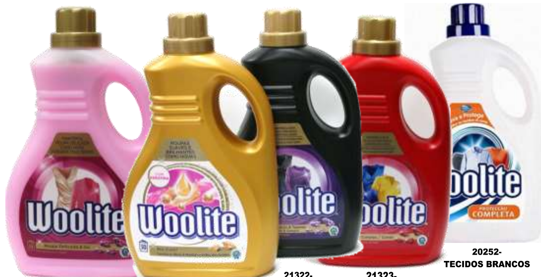
21330-WOOLITE ROUPA DELICADA & LÃS CLASSIC 34 Doses