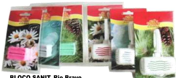
BLOCO SANIT. Rio Bravo RECARGA 2 Un. Cx.12 20445-PINHO 20423-FLORAL 20438-MARINHO