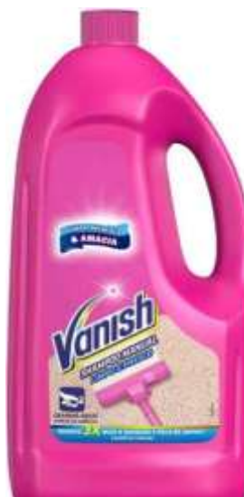
21526-KARPEX VANISH LIQUIDO SH. MANUAL 950 ml.