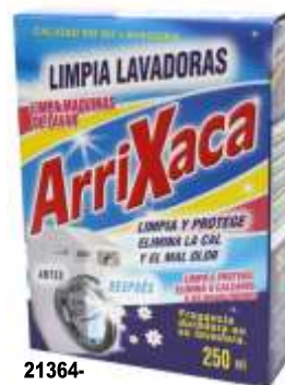
21364- ARRIXACA LIMPA MAQUINAS ROUPA 250 ml. Cx.10