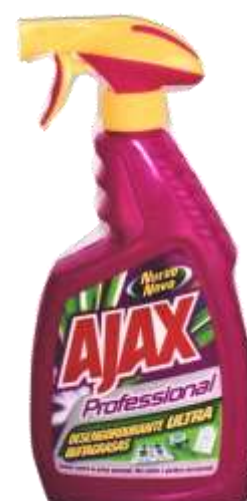
20246-AJAX PROFESSIONAL DESENGORD. DOUBLE POWER 750 ml.