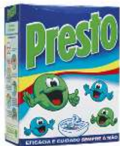
20001-DET. MANUAL PRESTO E-3 Cx6