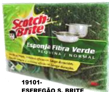
19101- ESFREGÃO S. BRITE NORMAL Cx.36