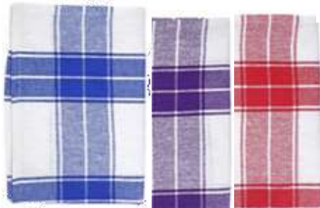
19861-PANOS ALGODÃO CLASSICO COZINHA 50X70 cm. PAMEX S/12