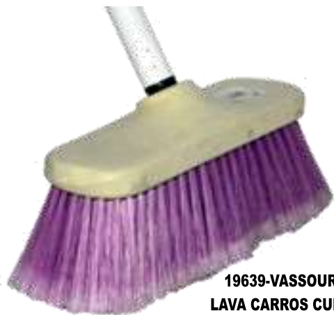
19639-VASSOURA LAVA CARROS CURVA SIBINA C/CABO Metal Cx.12