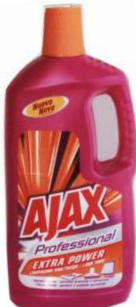
20159-AJAX PROFESSIONAL EXTRA POWER 1,250 ml. Cx.9