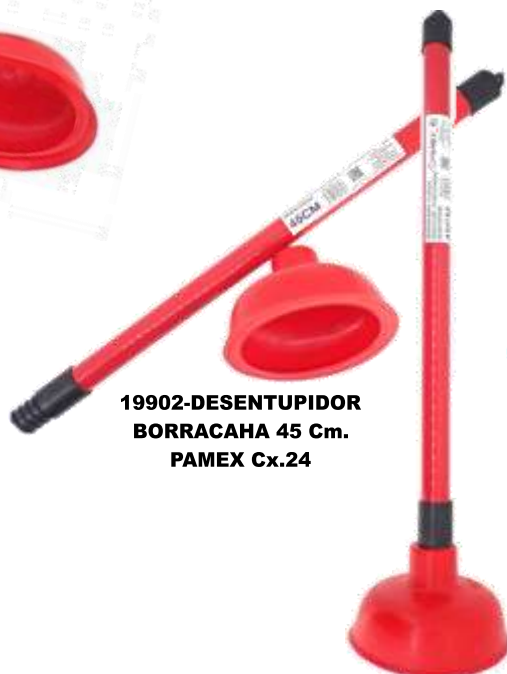
19902-DESENTUPIDOR BORRACAHA 45 Cm. PAMEX Cx.24