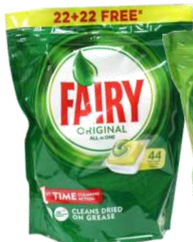
21660-DET. MAQ. LOIÇA FAIRY ORIGINAL LIMÃO 22+22 Past. Cx.4