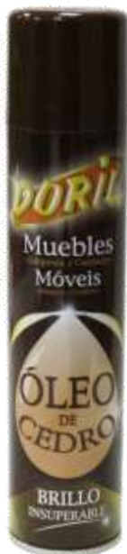
20751-OLEO CEDRO DORIL SPRAY 300 ml. Cx.6