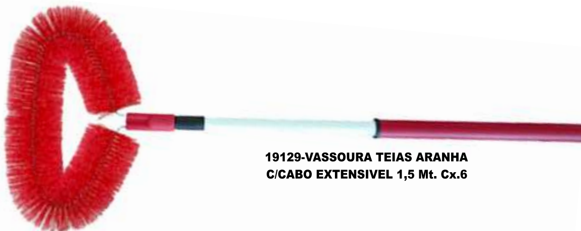
19129-VASSOURA TEIAS ARANHA C/CABO EXTENSIVEL 1,5 Mt. Cx.6