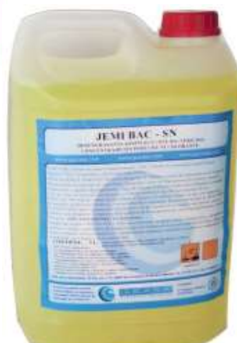
50482-BARM/JEMI-BAC DESINFECTANTE/BACTERICIDA SEM PERFUME 5 Lt. Cx.4