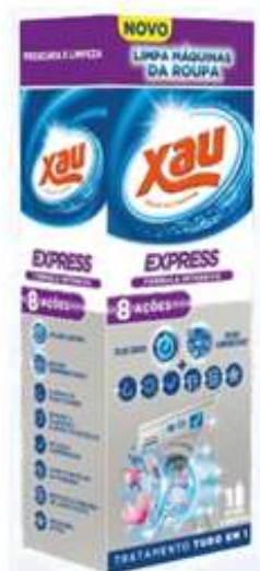
21670-XAU LIMPA MAQ. ROUPA EXPRESS 250 ml. Cx.12