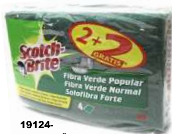
19124- ESFREGÕES S. BRITE NORMAL 2+2 Grátis Cx.12