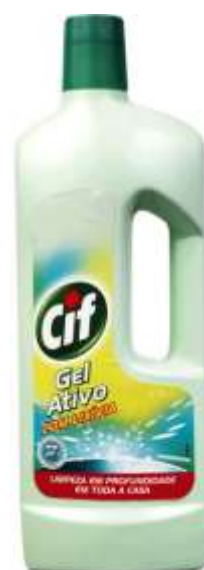
20232-CIF GEL ACTIVO C/LIXIVIA 750 ml.