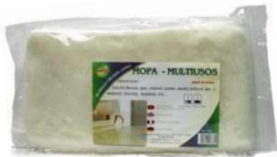
19068-LAVA PAREDES RECARGA Cx.12