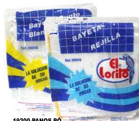
19200-PANOS PÓ EL LORITO ALGODÃO Ref.2014/12 Emb.12