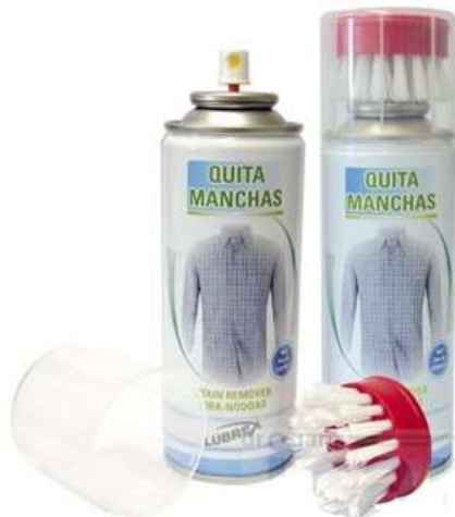
20608-TIRA NODOAS LUBREX SPRAY C/ESCOVA 200 ml. Emb.10