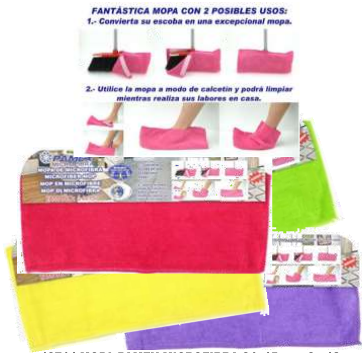
19714-MOPA PAMEX MICROFIBRA 34x15 cm. Cx.12