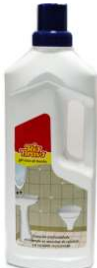
20916-RIO BRAVO GEL CASA BANHO 750 ml.