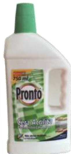
20711-CERA PRONTO ACRILICA PAVIMENTO CERÂMICO 750 ml.