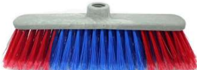
19715-VASSOURA REGINA SENSUAL Sem Cabo Cx.12

EXCEPCIONAL PRODUCTO TANTO PARA PROFESIONALES COMO PARA USO DOMESTICO COSIDA A MANO SUPER FUERTE SUPER RESISTENTE