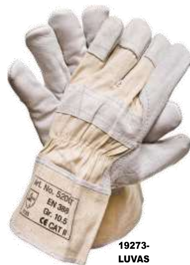
19273-LUVAS PELE MISTA TIPO AMERICANO Ref. 813 Pt.12