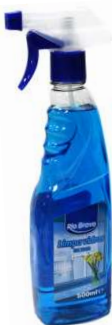
20905-R. Bravo MULTIUSOS C/PISTOLA 500 ml.