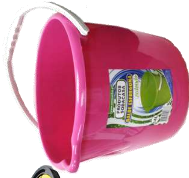
19915-BALDE Sem ESPRIMEDOR REDONDO 14 Lt. SODACASA