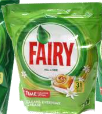
DET. MAQ. LOIÇA FAIRY 31 Pastilhas Cx.5 21680-ORANGE 21682-ORIGINAL