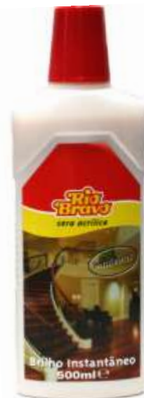
20723-CÊRA ACRILICA MADEIRAS R. Bravo 500 ml. Cx.6