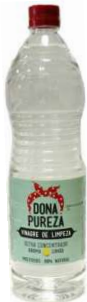
29959-VINAGRE LIMPEZA DONA PUREZA 1 Lt. Cx.6