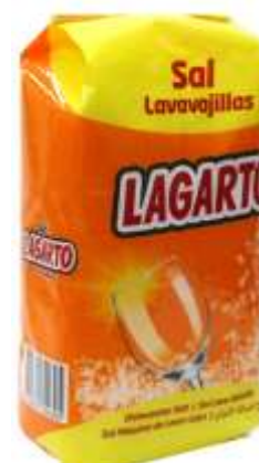
21611-SAL P/MAQ. LAVAR LOIÇA LAGARTO 2 Kg. Cx.6