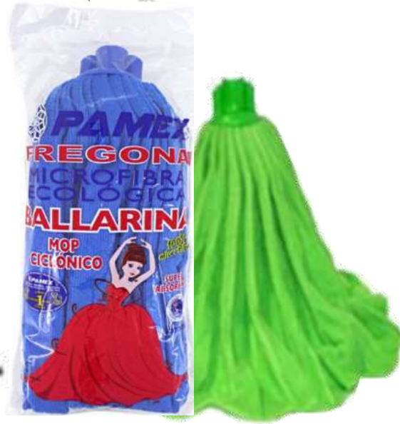
19921-CABEÇA ESFREGONA PAMEX BAILARINA Cx.24