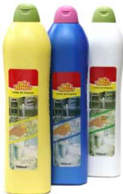
R. Bravo CREME LIMPEZA 750 ml.

20935-HERBAL 20130-C/Lixivia 20123-LIMÃO