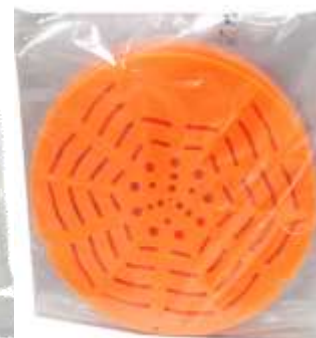
21542-MISTOLIN CORES Cx.5