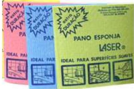
19161-PANOS ESPONJA LASER PEQUENO 17,5 cm. x 19,5 cm. Com 10 Un. Emb. 12