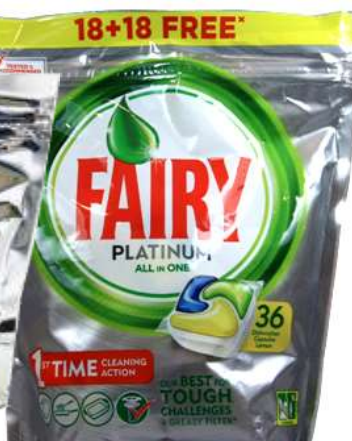
21667-DET. MAQ. LOIÇA FAIRY PLATINUM LIMÃO 18+18 Past.