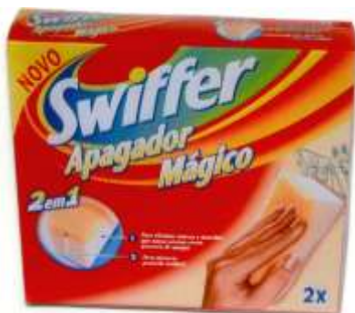
19225-SWIFFER APAGADOR 2em1 MAGICO 2 un. Cx.12