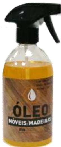
20499-OLEO P/MOVEIS FACOTIL C/PISTOLA 500 ml. Cx.15