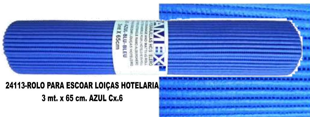
24113-ROLO PARA ESCOAR LOIÇAS HOTELARIA 3 mt. x 65 cm. AZUL Cx.6