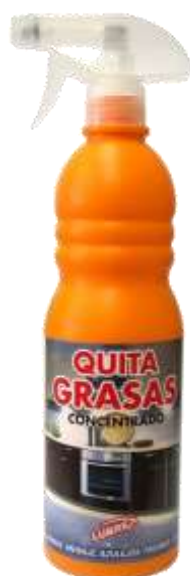
20574-LUBREX TIRA GORDURAS C/PISTOLA 750 ml.