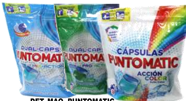
DET. MAQ. PUNTOMATIC 21396-PRO-ACTIVE 12 Doses 21397-ACCION COLOR 16 Doses 21377-MIX ACTION 12 Doses