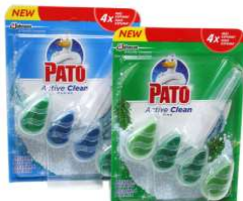
BLOCO SANITARIO WC PATO ACTIVE CLEAN 38,6 gr. 21532-MARINE, 21533-PINHO