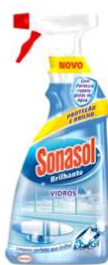
20942-L.VIDROS SONASOL BRILHANTE C/PISTOLA 750ml. Cx.8