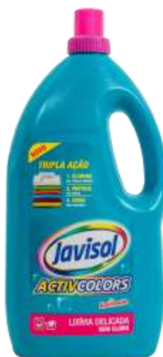
20401-DELICADA ACTIVCOLORS 2 Lt. Cx.6