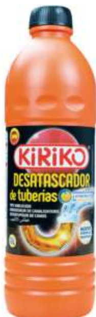
20586-KIRIKO DESENTUPIDOR CANOS GEL 1 Lt. Cx.12