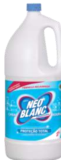
20365- 2 lt. Cx.10