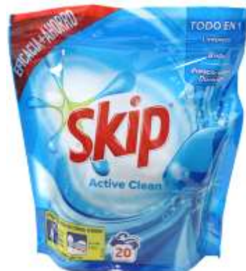
21354-DET. MAQ. SKIP CAPSULAS A. CLEAN 20 un.