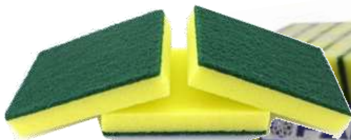
14x10x2,5 cm 19740-ESFREGÕES PAMEX ESPONJA 14x10 Pack 10 un. Cx.24