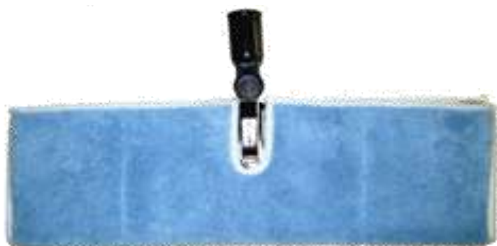
19712-PLATAFORMA + RECARGA 2 FACES TEKNO 37 cm. PAMEX Cx.24