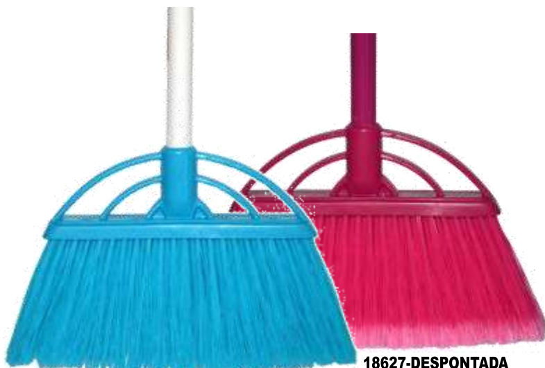
19632-RIJA 18627-DESPONTADA VASSOURA N°6 SIBINA C/Cabo Metalico 1,20 mt. Cx.12