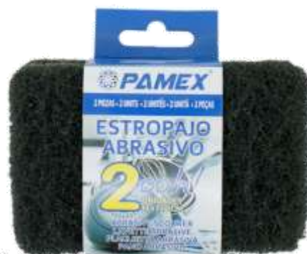
19906-ESFREGÕES ABRASIVO PAMEX Pack 2 un. Cx.24