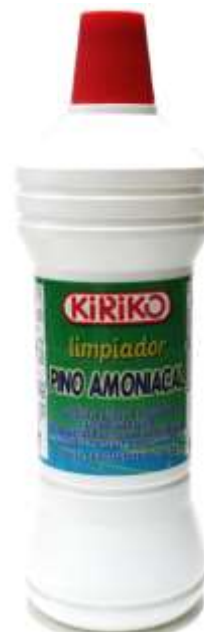
29953-L. TUDO KIRIKO AMONIACAL PINHO 1 Lt.