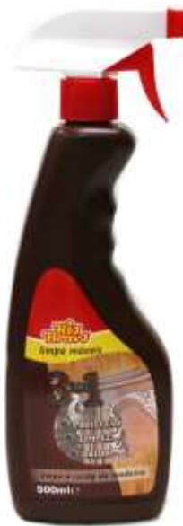
20747-RIO BRAVO LIMPA MOVEIS C/PISTOLA 500 ml. Cx.12