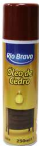
20503-OLEO CEDRO SPRAY R. BRAVO 250 ml.