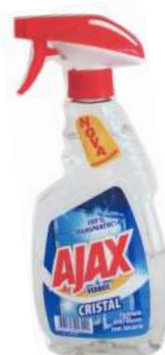
20146-AJAX CRISTAL C/PISTOLA 500 ml. Cx.12