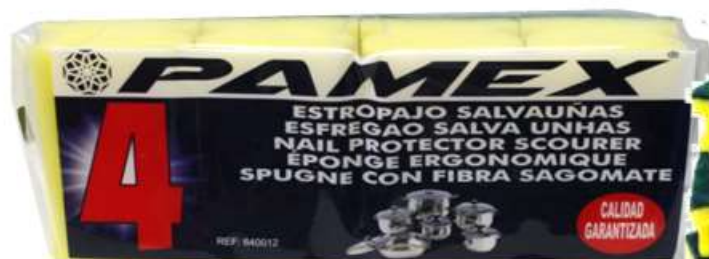
19744-ESFREGÕES PAMEX SALVA UNHAS Pack 4 un. Cx.24