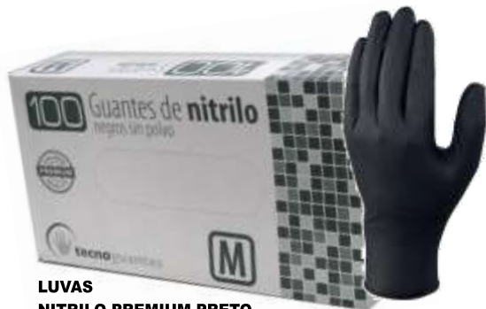
LUVAS NITRIL PREMIUM PRETO Sem PÓ 100 un. Cx.10 19300-Tamano XL 19247-Tamano L 19251-Tamano M