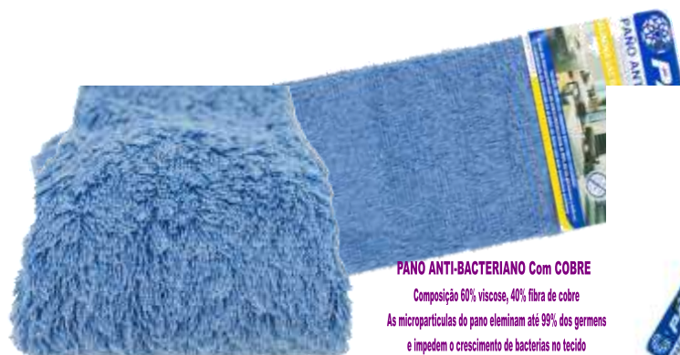
19867-PANO ANTI-BACTERIANO AZUL PAMEX 38x40 cm.

PANO ANTI-BACTERIANO Com COBRE Composição 60% viscose, 40% fibra de cobre As micropartículas do pano eliminam até 99% dos germes e impedem o crescimento de bactérias no tecido sem ter que usar produtos químicos.