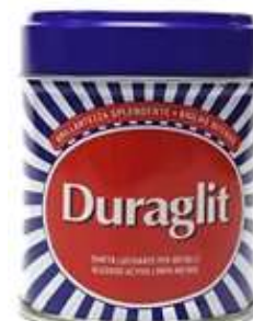
20535-DURAGLLIT LIMPA METAIS ALGODÃO 75 gr. Cx.12