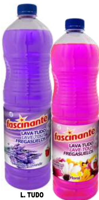
L. TUDO FASCINANTE 1,5 Lt. Cx.12 20165-LAVANDA 20163-FLORAL