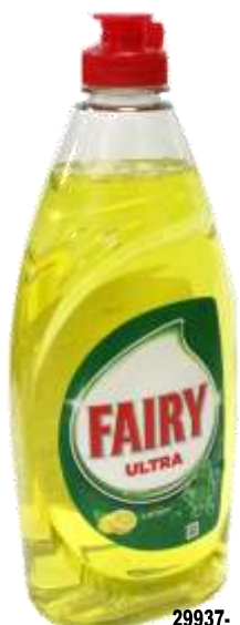
29937- DET. LOIÇA FAIRY LIMÃO 520 ml. Cx.16