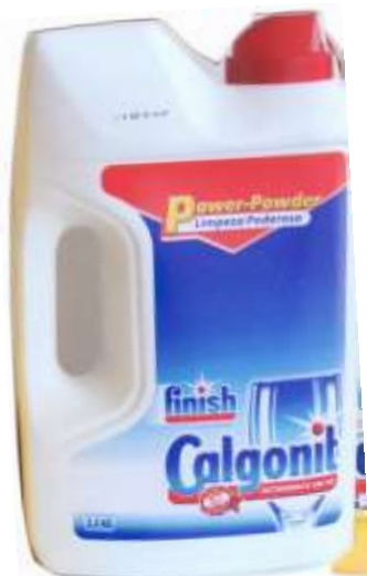
21620-DET. MAQ. LOIÇA CALGONIT POWER PÓ REGULAR 2,5 Kg.