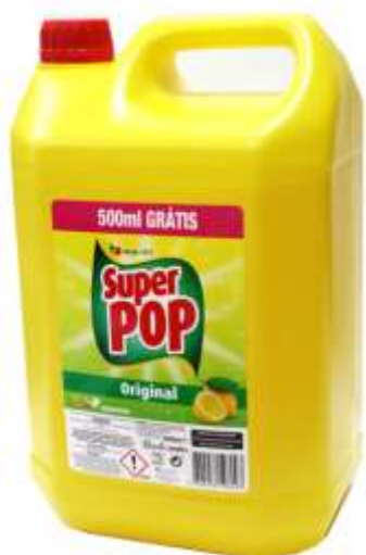
20199-SUPER POP LOIÇAS LIMÃO 4 Lt. + 500 ml. GRÁTIS