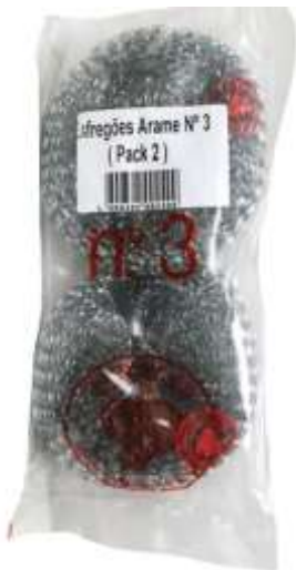
19100-ESFREGÕES ARAME Nº3 Pack 2 un. Emb.10