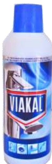
20117-VIAKAL ANTI-CALCÁRIO 500 ml.