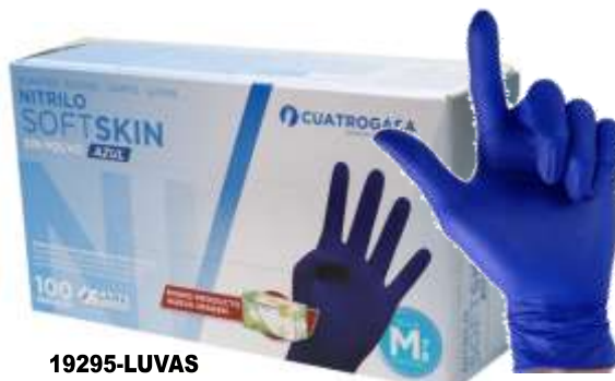
19295-LUVAS NITRIL TOUCH AZUL MÉDIA 100 Un. Cx.10