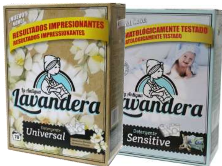
DET. MAQ. LAVANDERA 70 Doses 21387-UNIVERSAL, 21386-SENSITIVE