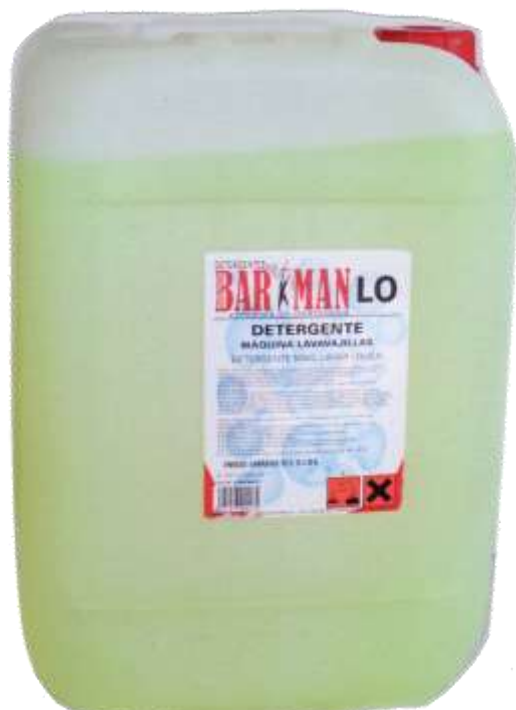
50486-BARMAN DET. MAQ. LOIÇAS Industrial (LO) 30 Kg.