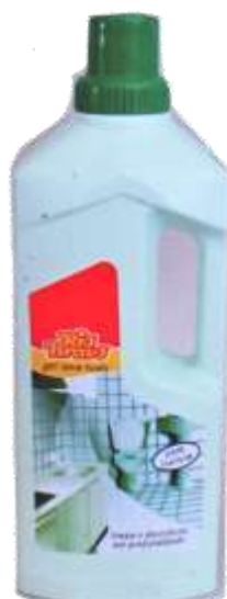
20915-RIO BRAVO GEL L. TUDO C/LIXIVIA 750 ml.