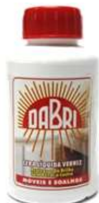
20715-CERA DABRI PEQ. 0,4 Lt. Cx.12