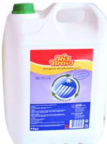
50464-DESINFECTANTE SUPERFICIES R. BRAVO 4x5 Lt.