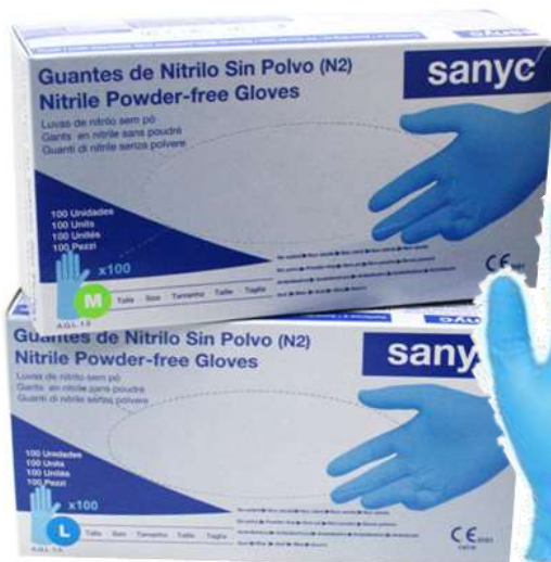
LUVAS NITRIL SANYC AZUL REFORÇADO 100 un. 19253-Tamano MÉDIO 19276-Tamano LARGE