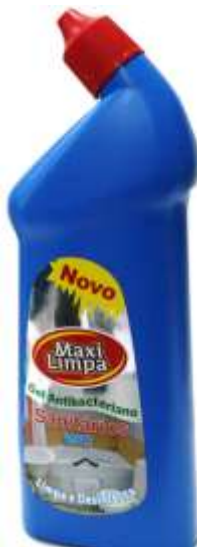
21541-MAXI LIMPA GEL SANITÁRIO 750 ml. Cx.12