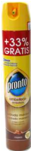
20502-PRONTO P/MOVEIS SPRAY 300 ml. + 33%