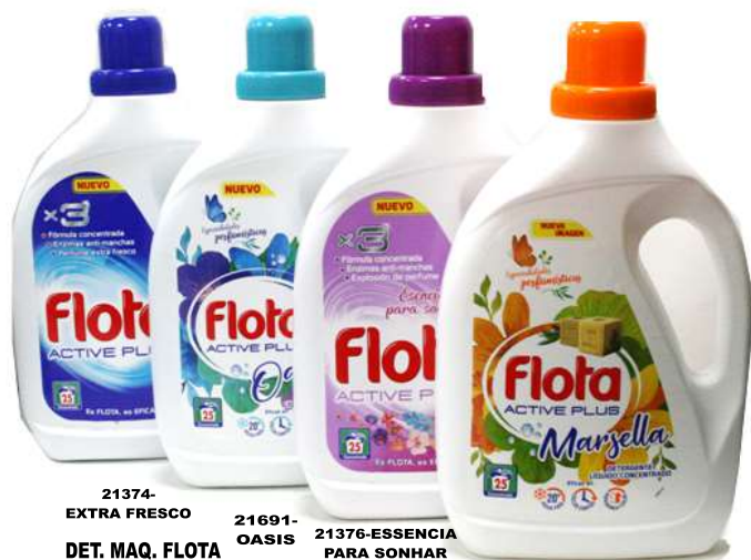
21374- EXTRA FRESCO DET. MAQ. FLOTA LIQ. ACTIVE PLUS 25 Doses 21691- OASIS DET. MAQ. FLOTA LIQ. ACTIVE PLUS 25 Doses 21376-ESSENCIA PARA SONHAR DET. MAQ. FLOTA LIQ. ACTIVE PLUS 25 Doses