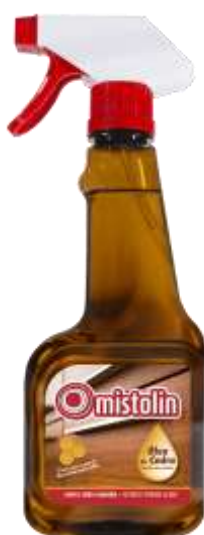
20947-OLEO CEDRO MISTOLIN C/Pistola 360 ml. Cx.12