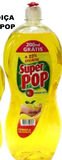
32210- 1,200 + 200 ml.