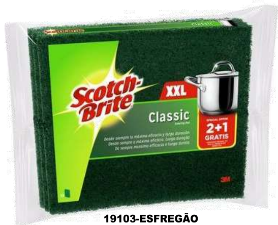
19103-ESFREGÃO S. BRITE GRANDE 2+1 GRATIS Cx.16