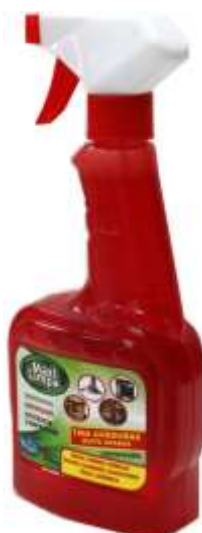
20951-MAXI LIMPA TIRA GORDURAS C/PIST. 500 ml. Cx.12