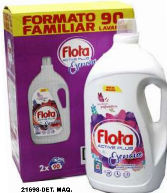
21698-DET. MAQ. FLOTA LIQ. ESENCIA Pack (2x90) 180 Doses