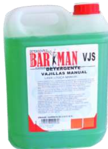
50474-DET.LOIÇA MANUAL BARMAN (VJS) 5kg Cx.4

Quality Insured BAR K MAN EXPECIALISTAS EM HOTELARIA