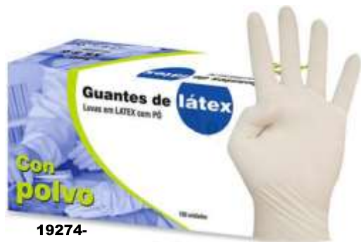
19274- LUVAS LATEX EXAMEN MÉDIA 100 un. Cx.10