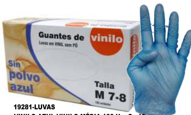
19281-LUVAS VINILO AZUL VINILO MÉDIA 100 Un. Cx.10