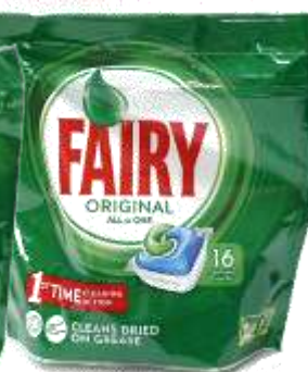
21661-DET. MAQ. LOIÇA FAIRY ORIGINAL 16 Past. Cx.5