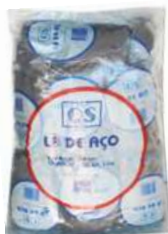
19073-LÃ AÇO 40 Gr. Saco 25 Un.