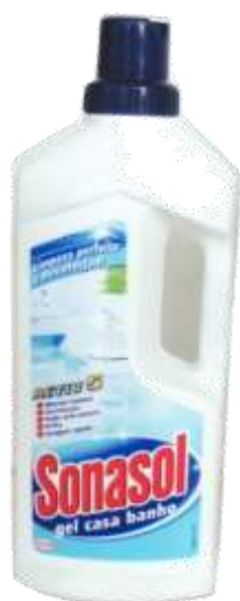
29944-SONASOL CASA BANHO GEL 650 ml. Cx.16