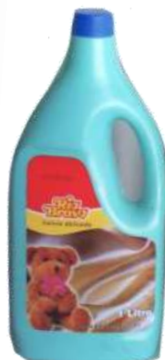
20355-LIX. R. Bravo DELICADA 1 lt. Cx.12