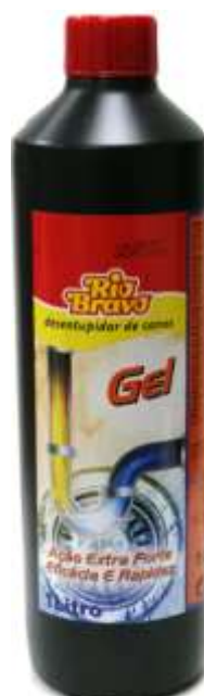
20946-DESENTUPIDOR CANOS GEL R. BRAVO 1 Lt. Cx.6