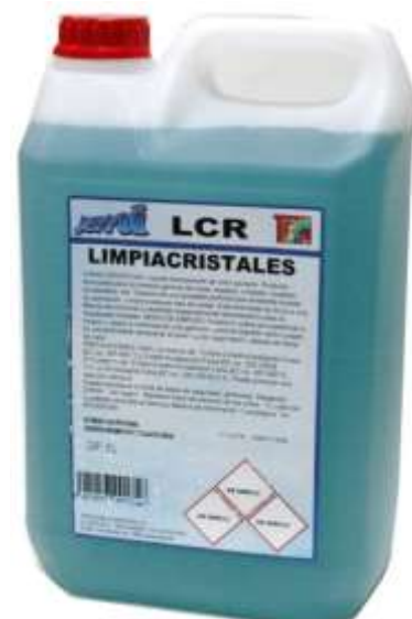
50489-LIMPA VIDROS BARMAN/TEIN JEMI (LCR) 5 Lt. Cx.4