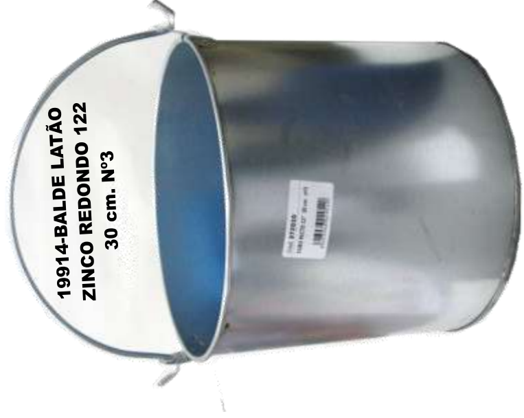
19914-BALDE LATÃO ZINCO REDONDO 122 30 cm. Nº3