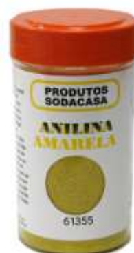
20948-ANILINA HOLLIDAY AMARELA SODACASA Frasco 120 gr. Cx.12