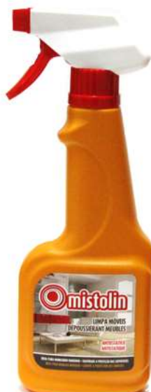
20741-MISTOLIN LIMPA MOVEIS C/Pistola 360 ml. Cx.12