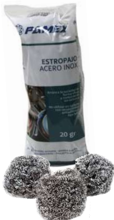
19923-ESFREGÕES AÇO INOX PAMEX Pack 3 un. Cx.96