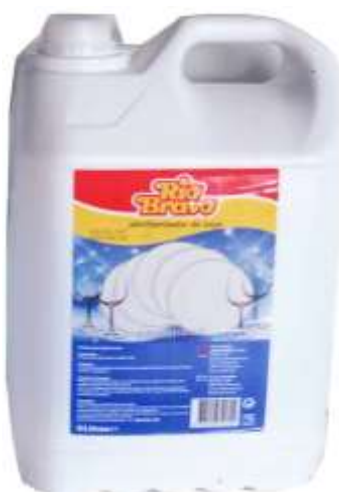
50485-ABRILHANTADOR MAQ. LOIÇA R. Bravo 5 Lt. Cx.4