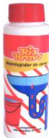
20545-DESENTUPIDOR CANOS R. Bravo 350 gr.