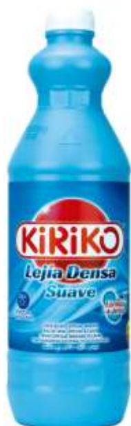
20357-LIXIVIA KIRIKO GEL DENSA SUAVE 1,5 Lt. Cx.8