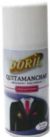
20603-TIRA NODOAS SPRAY DORIL 150 ml. Cx.12