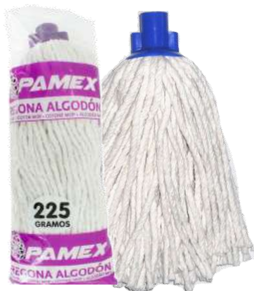
19900-CABEÇA ESFREGONA ALGODÃO 225 gr. PAMEX S/12