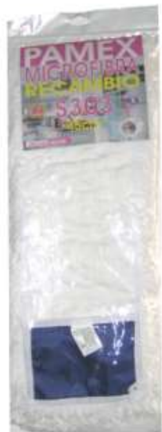
19709-RECARGA MOPA S-303 PAMEX 45 cm. Cx.6