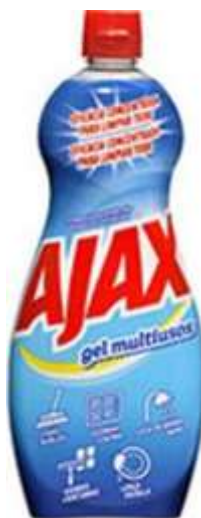
20148-AJAX GEL MULTIUSOS 750 ml.