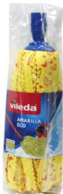
19116-CABEÇA ESFREGONA VILEDA SUAVE Cx.24