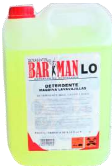
50469-BARMAN DET. MAQ. LOIÇAS Industrial (LO) 6 Lt. Cx.4