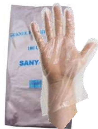
19262-LUVAS POLITILENO DESCATAVEIS SANIC BOLSA 100 un.