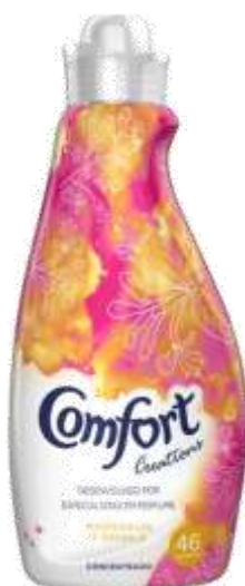
21256-AMACIADOR CONFORT MADRESSILVA&SANDALO 1,15 Lt. 46 Doses Cx.6