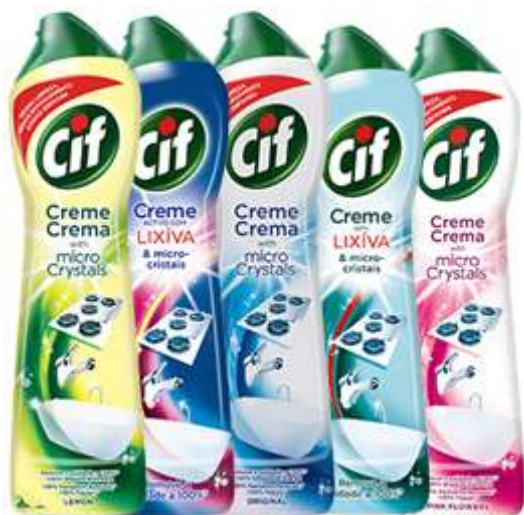
CIF CREME 500 ml. Cx.16 20178-BRANCO 20160-C/LIXIVIA VERDE 20204-LIMÃO 20147-ACTIVE C/LIX. AZUL 20180-PINK FLOWER