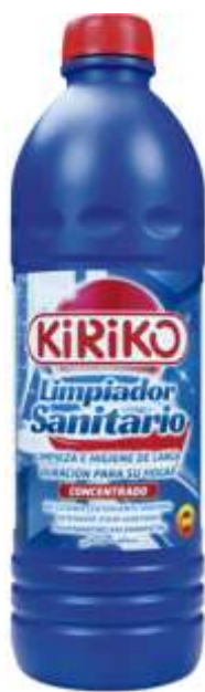
20554-KIRIKO LIMPADOR SANITÁRIO 1 Lt.