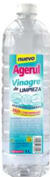
32327-ALGERUL VINAGRE LIMPEZA 1 Lt. Cx.12