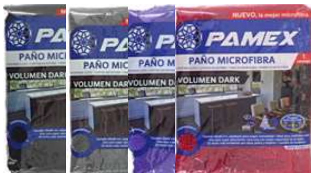
19869-PANOS MICROFIBRAS DARK (Cores Escuras) PAMEX 30x40 cm.