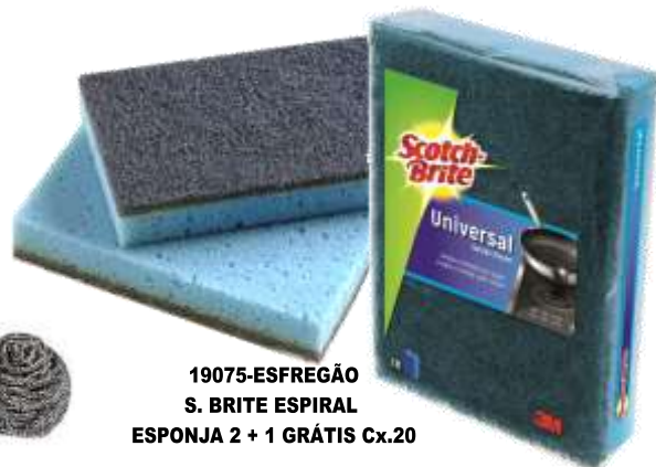
19075-ESFREGÃO S. BRITE ESPIRAL ESPONJA 2 + 1 GRÁTIS Cx.20