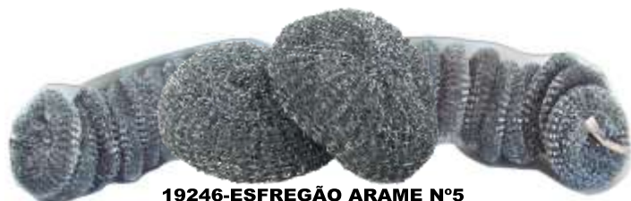
19246-ESFREGÃO ARAME Nº5 Atado 25 Un.