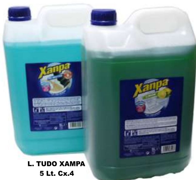
L. TUDO XAMPA 5 Lt. Cx.4 32340-NEUTRO, 32341-LIMÃO