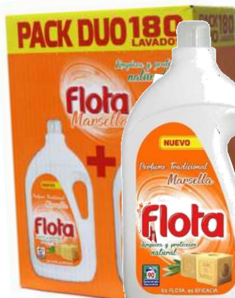
21390- DET. MAQ. FLOTA LIQ. MARSELHA (Pack 2x90) 180 Doses