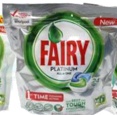
DET. MAQ. LOIÇA FAIRY PLATINUM 24 Past. 21666-ORIGINAL, 21681-LIMÃO