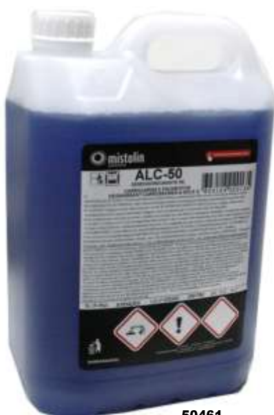
50461- DET. DESENGORDURANTE CARROCERIAS ALC-50 MISTOLIN 5 Lt. Cx.3