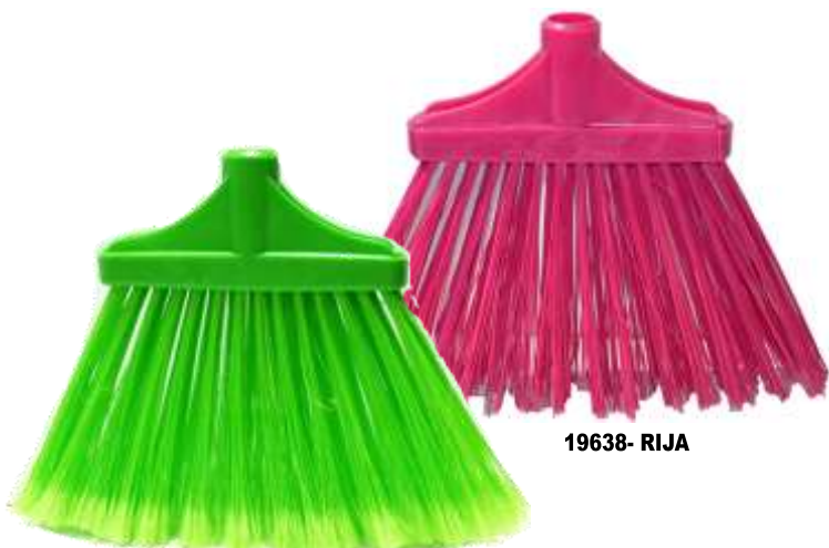
VASSOURA N°2 SIBINA C/Cabo Metalico 1,20 mt. Cx.12 19635-DESPONTADA