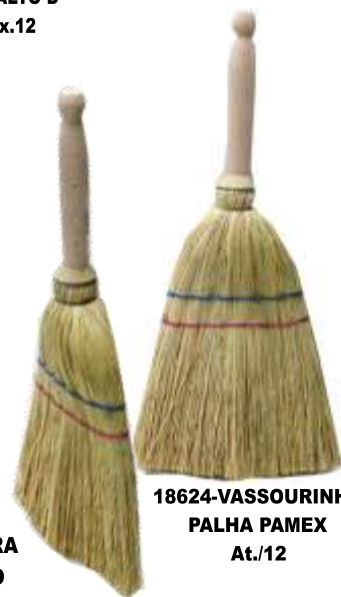
18624-VASSOURINHA PALHA PAMEX At./12