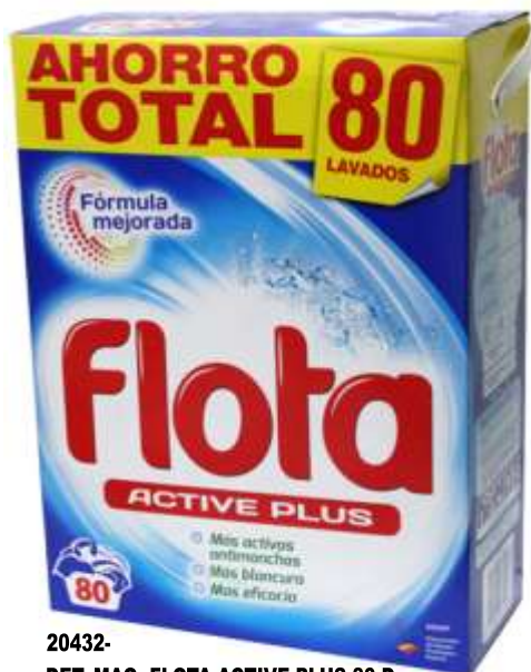
20432- DET. MAQ. FLOTA ACTIVE PLUS 80 Doses