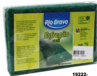
19222-ESFREGÕES R. Bravo VERDE 3 Unidades Cx.12