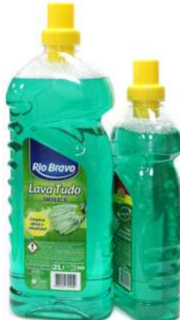
L. TUDO R. BRAVO AMONICAL 20901- 2 lt. 20900- 1 lt.