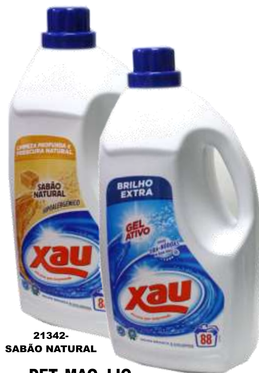
21342- SABÃO NATURAL