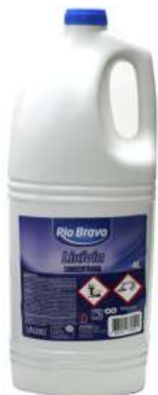
20356-LIXIVIA Rio Bravo 4% CLORO CONCENTRADA 4lt. Cx.4