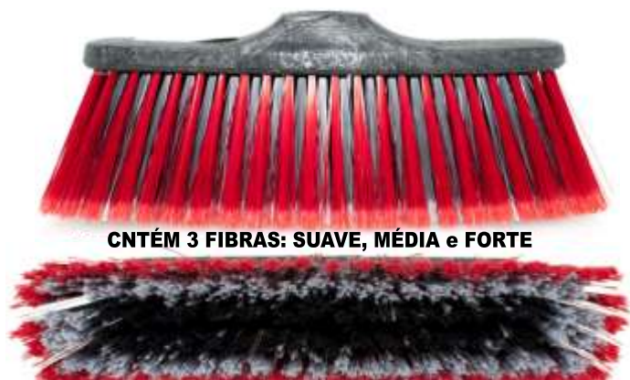
CNTÉM 3 FIBRAS: SUAVE, MÉDIA e FORTE