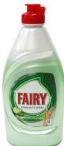
32338-DET. LOIÇA FAIRY ALOE VERA 350 ml. Cx.10