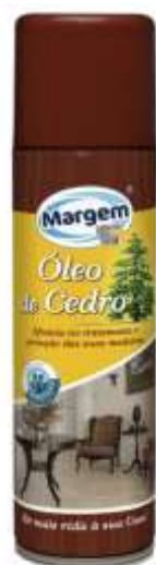
20539-OLEO CEDRO MARGEM SPRAY 250 ml. Cx.12