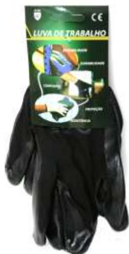
19261-LUVAS NYLON NITRIL MÉDIA Nº9