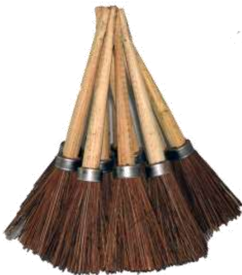
19078-TOCOS PIASSABA Nº1