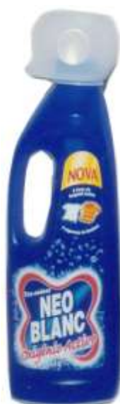
20377-LIXIVIA NEOBLANC OXIGENIO ACTIVO 10x1 Lt.