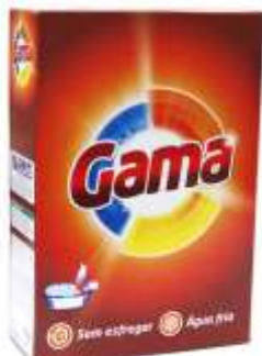
21692-DET. MANUAL GAMA 510 gr. Cx.12