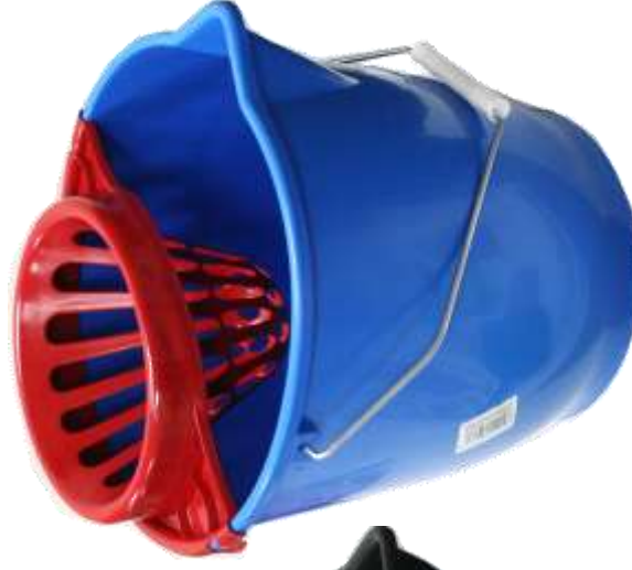
19736-BALDE 13 Lt. C/ASA METAL + ESPRIMEDOR PAMEX