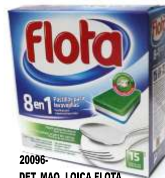
20096- DET. MAQ. LOIÇA FLOTA CAPS 15 PASTILHAS 315 gr.