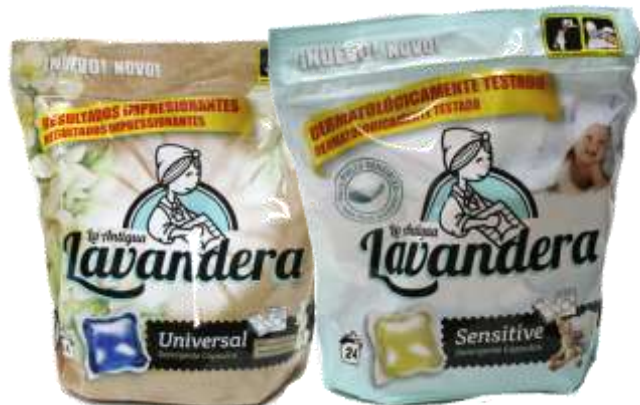
DET. MAQ. CAPSULAS LAVANDERA 24 Un. 21385-UNIVERSAL, 21384-SENSITIVE