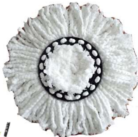
19722-CABEÇA ESFREGONA 360° PAMEX Cx.12