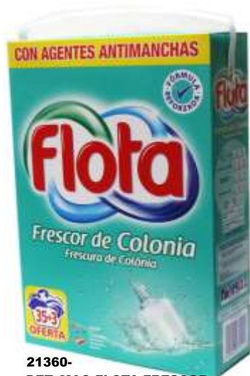
21360- DET. MAQ. FLOTA FRESCOR COLONIA 35+3 Doses Cx.4