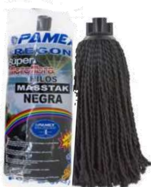
19872-CABEÇA ESFREGONA SUPER MICROFIBRAS TIRAS DARK Cx.24