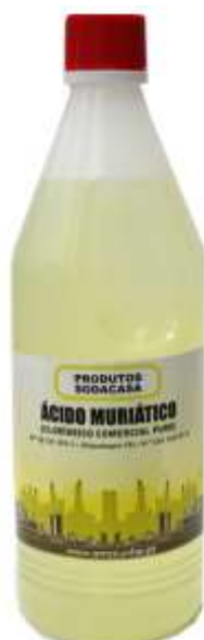
39993-ACIDO MOURIATICO 1 Lt. Cx.12