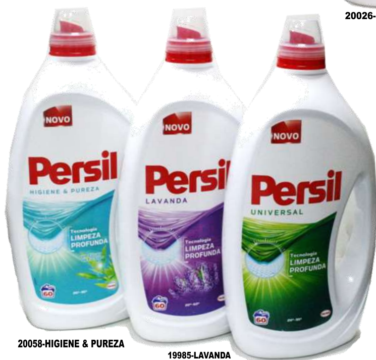
20058-HIGIENE & PUREZA 19985-LAVANDA 19978-UNIVERSAL DET. MAQ. PERSIL GEL 60 Doses Cx.4