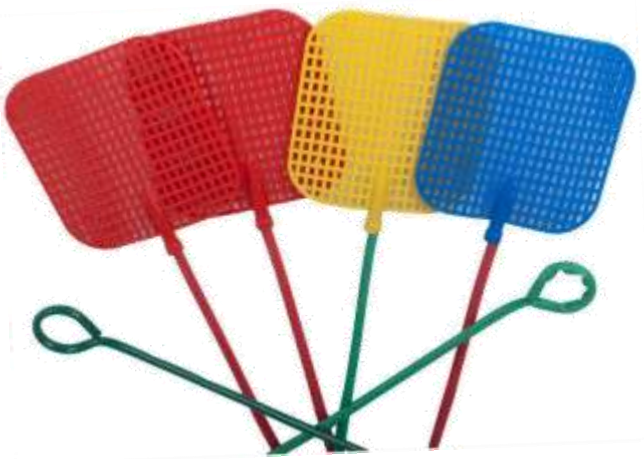
19058- MATA MOSCAS PLASTICO Cx.12