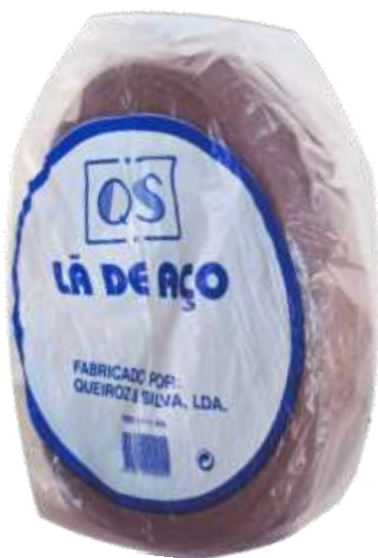
19087-LÃ AÇO BOBINES 1 Kg.