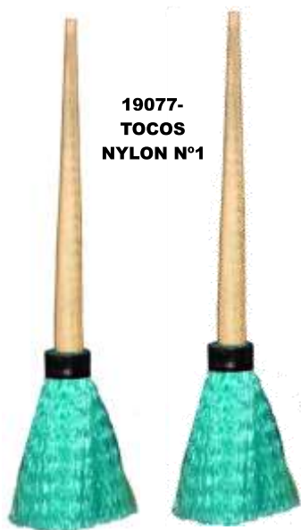
19077- TOCOS NYLON Nº1