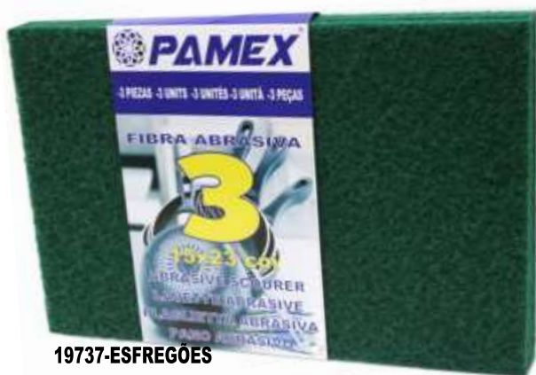
19737-ESFREGÕES PAMEX VERDE GRANDE 15x23 Pack 3 un. Cx.24