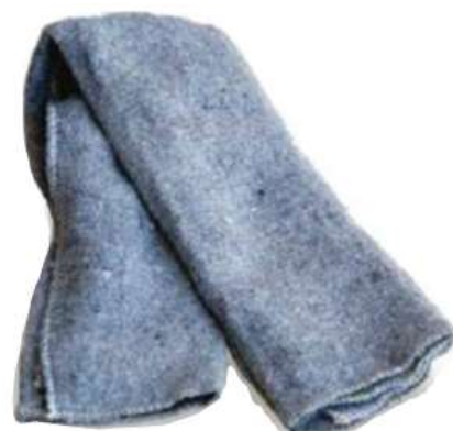
19691-PANO LIMPA CHÃO ALGODÃO 60x65 cm. AT/12