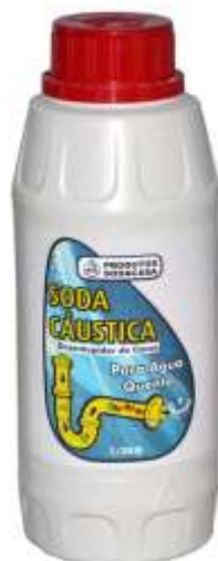
40080- SODA CAUSTICA SODACASA Frasco 1/2 Kg.