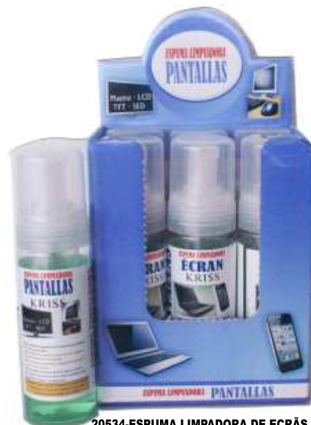
20534-ESPUMA LIMPADORA DE ECRÃS KRIS 150 ml. Cx.72 (Shering Expositor 9 un.)