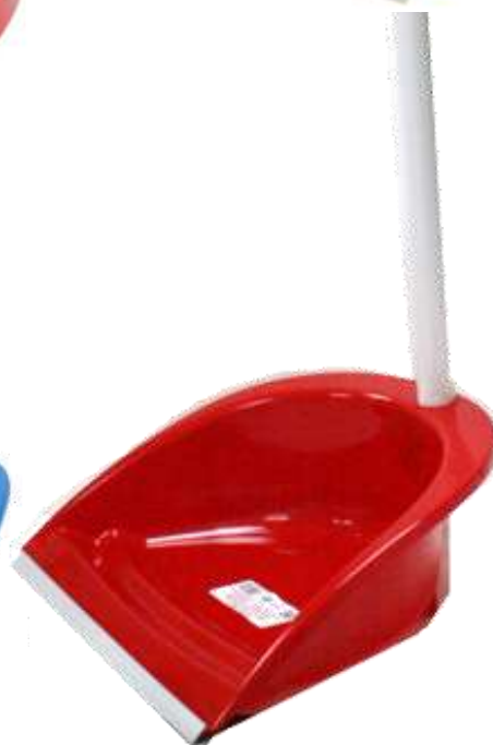
19749-PÁS PLASTICO GRANDE C/BORRACHA E CABO PAMEX Cx.36