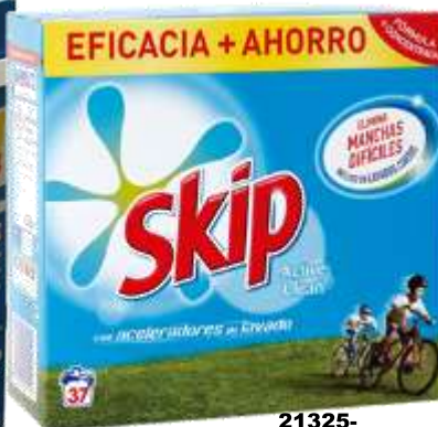
21325- 37 Doses