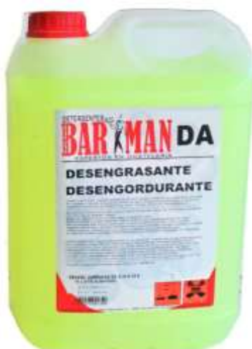
50471-BARMAN DESENGORDURANTE GERAL (DA) 4x5 Lt.