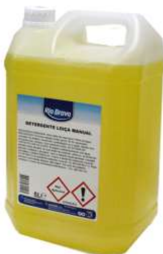
50488-DET. MANUAL LOIÇA R. Bravo 5 Lt. Cx.4