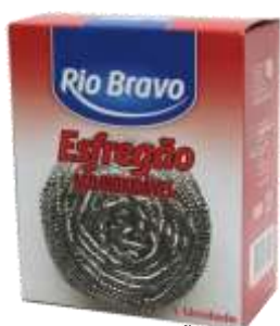
19149-ESFREGÕES R. BRAVO AÇO INOX