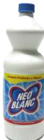
LIXIVIA NEOBLANC REGULAR 20364- 1 lt. Cx.18