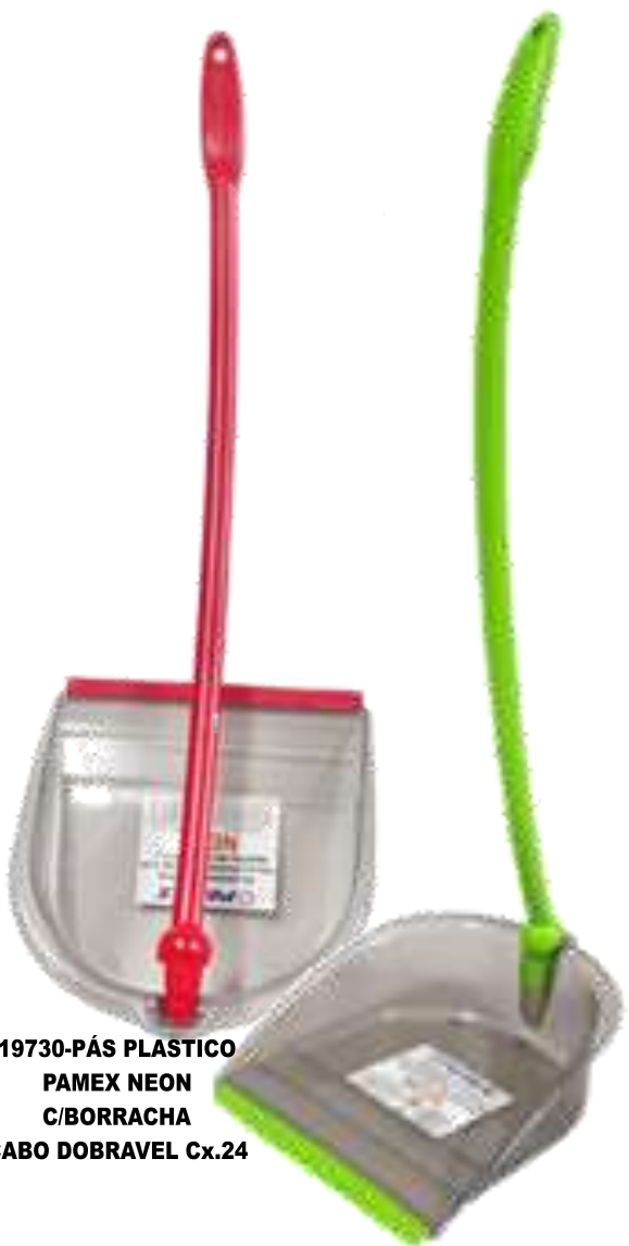
19730-PÁS PLASTICO PAMEX NEON C/BORRACHA CABO DOBRAVEL Cx.24