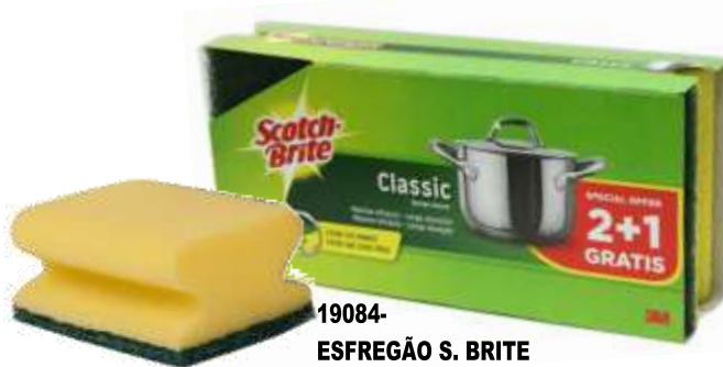
19084- ESFREGÃO S. BRITE SALVA UNHAS cx.36 LEVE 3 PAGUE 2