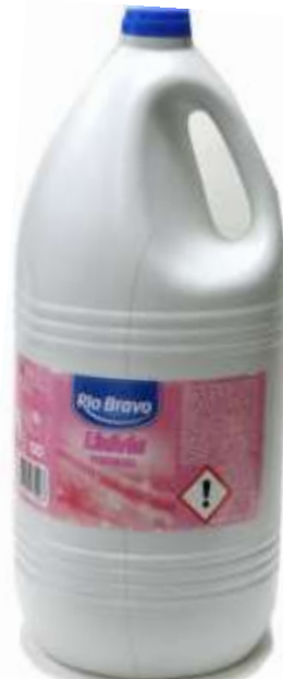
20395-LIXIVIA R. Bravo PERFUMADA 5 Lt. Cx.3