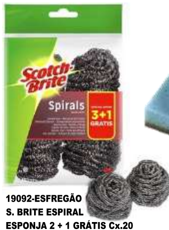
19092-ESFREGÃO S. BRITE ESPIRAL ESPONJA 2 + 1 GRÁTIS Cx.20