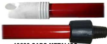
19630-CABO METALICO C/ADAPTADOR 1,40 Mt. At./12