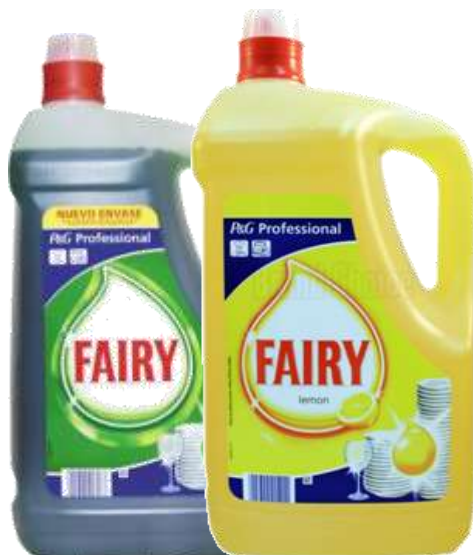
DET.LOIÇA FAIRY LIQ. PROFISSIONAL 5 Lt. 20925-DREFT Cx.2 29939-LIMÃO Cx.3