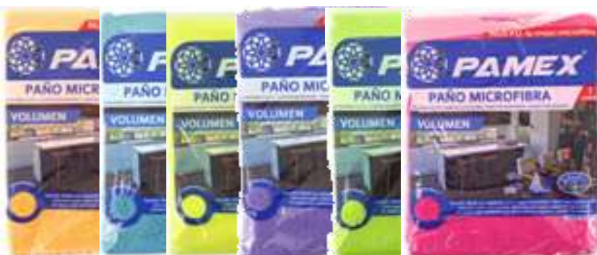
19694-PANO MICROFIBRAS PAMEX (Cores Vivas) 30x40 cm. Cx.12