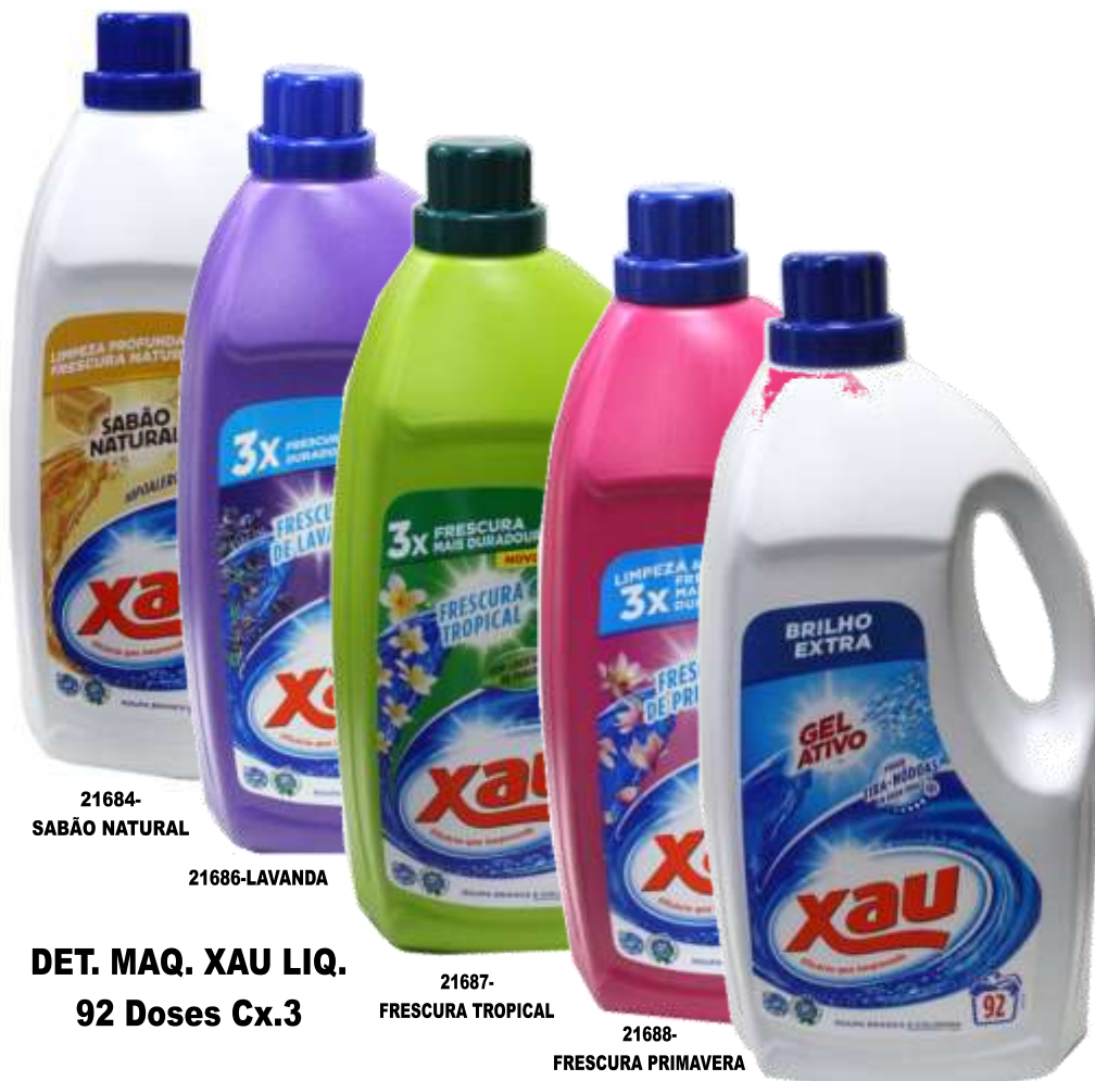
21684- SABÃO NATURAL