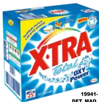
19941- DET. MAQ. X-TRA OXI POWER 25 Doses Cx.4