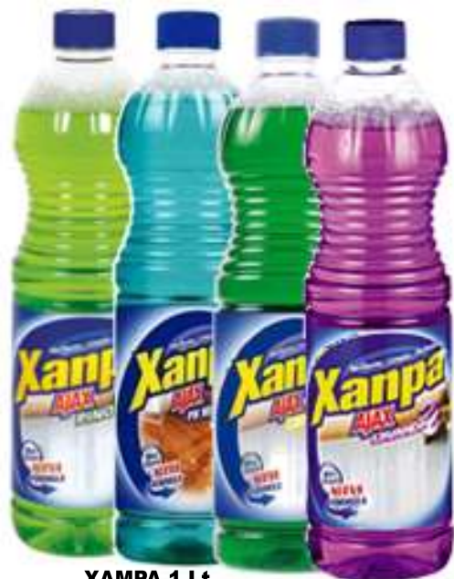
XAMPA 1 Lt. 20927-LAVANDA, 20179-LIMÃO, 20936-PINHO, 20175-NEUTRO