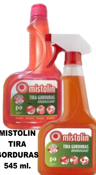
MISTOLIN TIRA GORDURAS 545 ml.