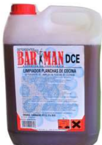
50472-BARMAN DET. LIMPEZA CHAPAS/GRELHADORES Indust. (DCE) 4x6 Lt.