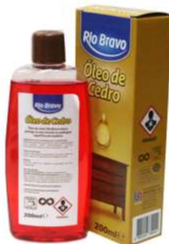
20746-OLEO CEDRO FRASCO R. Bravo 200 ml.