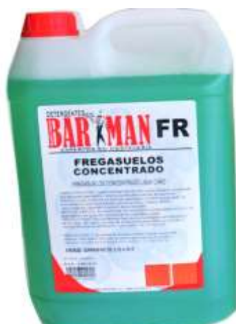
50473-BARMAN DET. LAVA CHÃO CONCENTRADO Industrial (FR) 4x5 Lt.