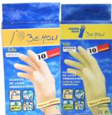
LUVAS LATEX BEHOLI 10 un. Cx.10 19269-MÉDIAS, 19291-GRANDE