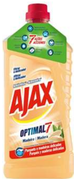
20890-AJAX LIMPA MADEIRAS OPTIMAL 7 AMENDOIA 1 Lt.