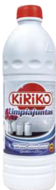
20949-KIRIKO LIMPA JUNTAS 1 Lt. Cx.12