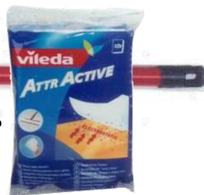
19163-VILEDA PANO ATTRACTIVE RECARGA 12 Panos