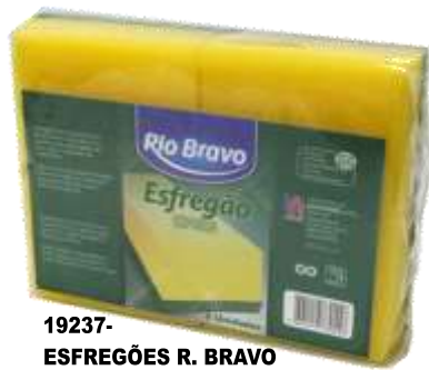
19237-ESFREGÕES R. BRAVO ESPONJA Pack 2 un. Cx.12