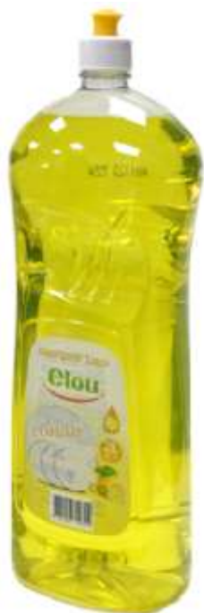
20191-DET. LOIÇA ELOU 2 Lt. Cx.9