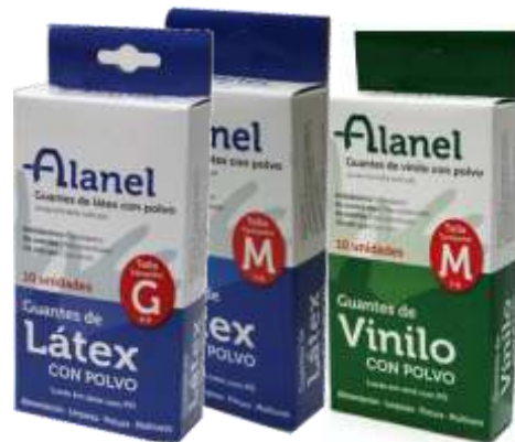
LUVAS ALANEL 10 un. 19296-LATEX GRANDE 19280-LATEX MÉDIA 19285-VINILO T/MÉDIA