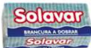
20304-SABÃO SOLAVAR AZUL 400 gr. cx.50