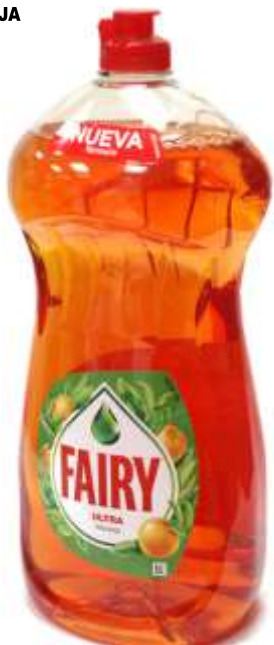
32331-DET. LOIÇA FAIRY ULTRA LARANJA 1,5 Lt. Cx.9