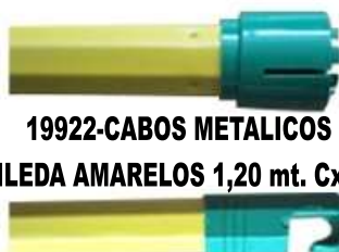
19922-CABOS METALICOS VILEDA AMARELOS 1,20 mt. Cx.12