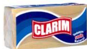
20309-SABÃO CLARIM 400 gr. cx.50