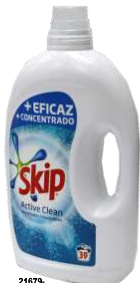
21679- DET. MAQ. SKIP LIQ. A. CLEAN 2,34 Lt. 39 Doses Cx.4