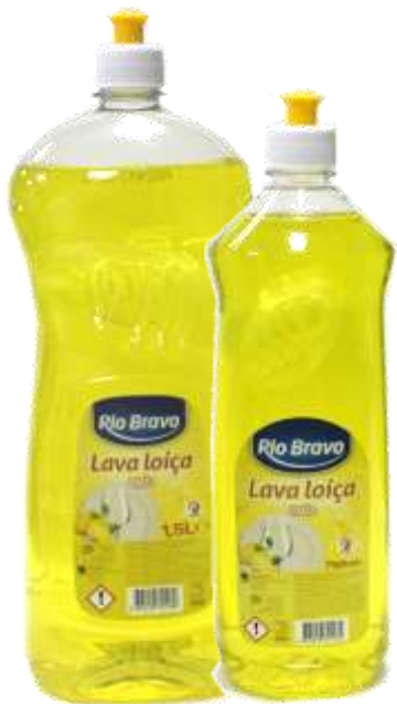
RIO BRAVO DET. LOIÇA 20914- 1,5 Lt. 20195- 750 ml.