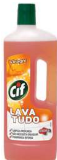
20238-CIF LIQ. VINAGRE 750 ml..