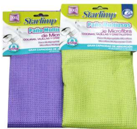
19871-PANOS STARLIMP MICROFIBRAS XXL 50x50 cm. Cx.12