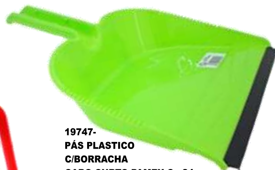
19747- PÁS PLASTICO C/BORRACHA CABO CURTO PAMEX Cx.24