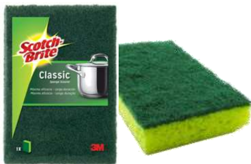
19096-ESFREGÃO S. BRITE ESPONJA CLASSIC (2x10) Cx.20