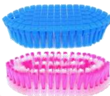
19649-ESCOVA LAVADEIRA FLEXIVEL PAMEX Cx.24