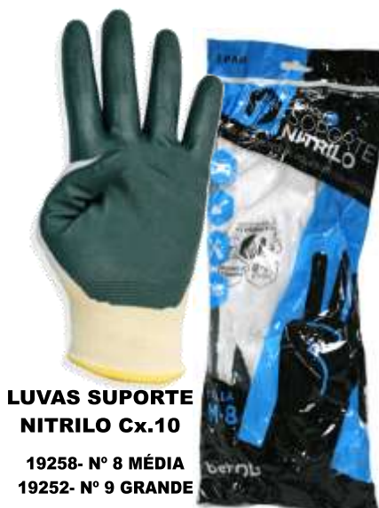
LUVAS SUPORTE NITRILO Cx.10 19258- Nº 8 MÉDIA 19252- Nº 9 GRANDE