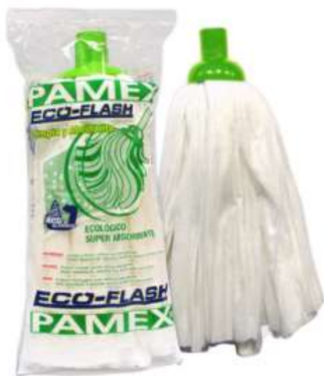
19701-CABEÇA ESFREGONA PAMEX 140 gr. ECO FLASH Cx.24