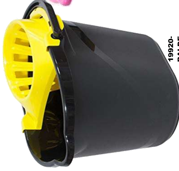
19920- BALDE PLASTICO PRETO 15 Litros + ESPRIMEDOR PAMEX