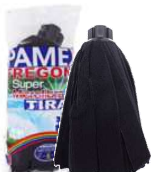
19705-CABEÇA ESFREGONA SUPER MICROFIBRAS TIRAS DARK Cx.24