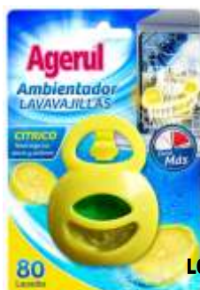
21530-AMBIENTADOR MAQ. LOIÇA AGERUL CITRICO 5,7 gr.