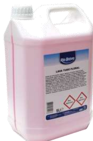
32337-DET. L. TUDO FLORAL R. BRAVO 5 Lt. Cx.4