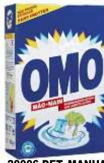
20006-DET. MANUAL OMO E-3 Cx6