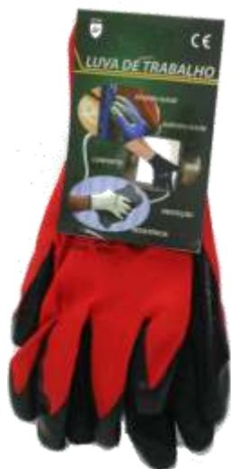
19288-LUVAS TRABALHO AREADA MÉDIA Nº9 Cx.12