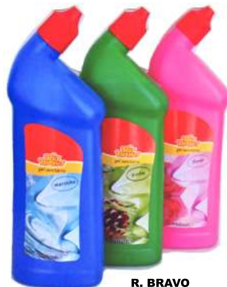
R. BRAVO GEL SANITÁRIO 750 ml. 21409-FLORAL, 21410-MARINHO, 21411-PINHO