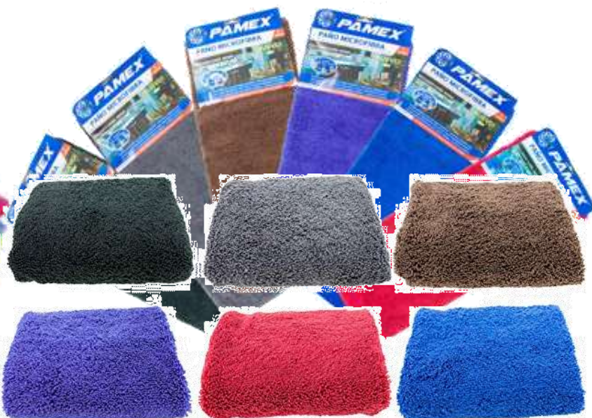
19870-PANOS MICROFIBRAS DARK GIGANTE PAMEX 40x60 cm. S/12 (Cores Escuras)