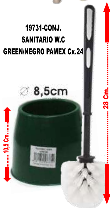
19731-CONJ. SANITARIO W.C GREEN/NEGRO PAMEX Cx.24