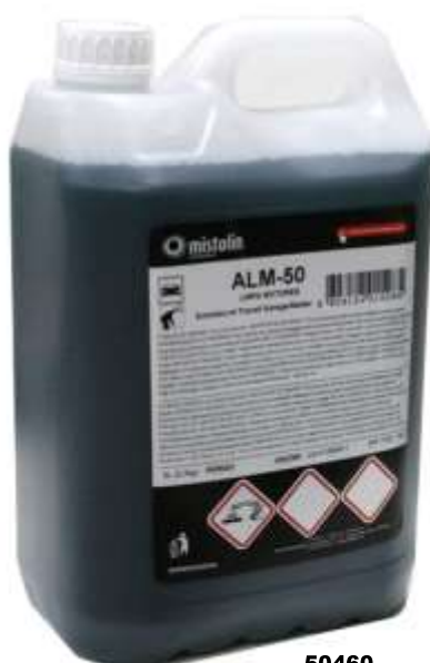
50460- DET. LIMPA MOTORES ALM-50 MISTOLIN 5 Lt. Cx.3