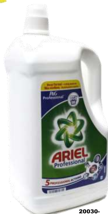
20030- DET. MAQ. ARIEL LIQ. ACTILIFT PROFISSIONAL 100 Doses 5 Lt. Cx.3