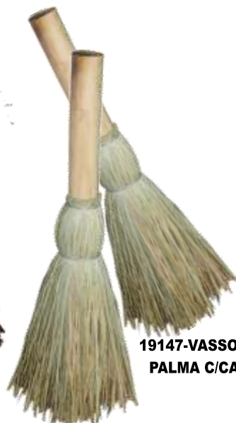
19147-VASSOURA PALMA C/CABO