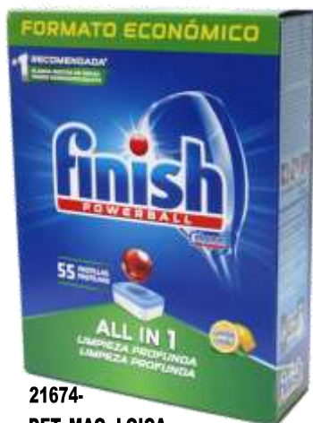
21674- DET. MAQ. LOIÇA Tudo em 1 FINISH LIMÃO 55 Past.