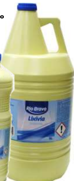
20399- 5 lt. Cx.3