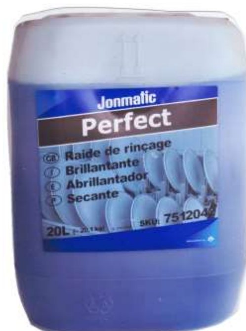
50430-SECANTE ABRILHANTADOR JOMATIC PERFECT JHONSON 20 Lt.