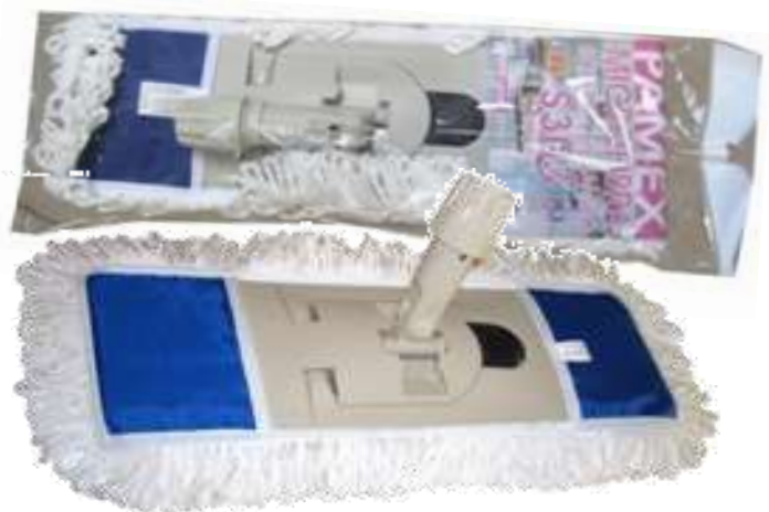
19708-PLATAFORMA + MOPA S-303 PAMEX 45 cm. Cx.24