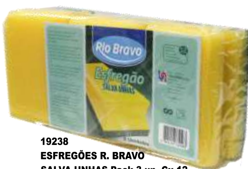
19238-ESFREGÕES R. BRAVO SALVA UNHAS Pack 3 un. Cx.12