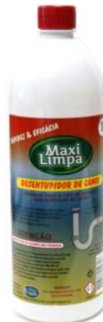
20950-DESENTUPIDOR CANOS LIQ. MAXI LIMPA 1 Lt.