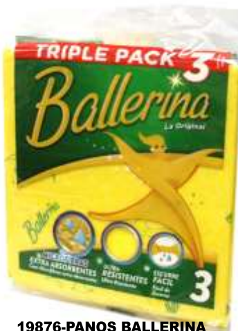
19876-PANOS BALLERINA SUAVE 3 Panos Cx.15