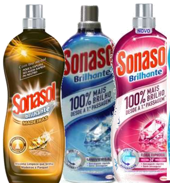
SONASOL BRILHANTE 1,10 Lt. Cx.12 32211-MADEIRAS, 20939-UNIVERSAL, 20136-FLORAL EUPHORIA, 20940-OXIG. ACTIVO UNIVERSAL