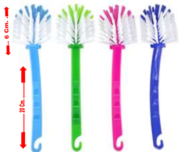
19733-ESCOVA LAVA PRATOS PAMEX Cx.20