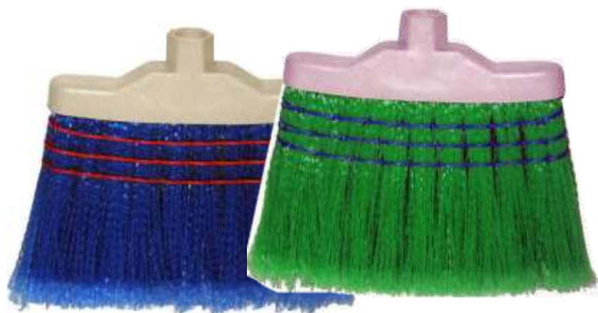
19912-VASSOURA CROMA CORES Sem CABO PAMEX Cx.12