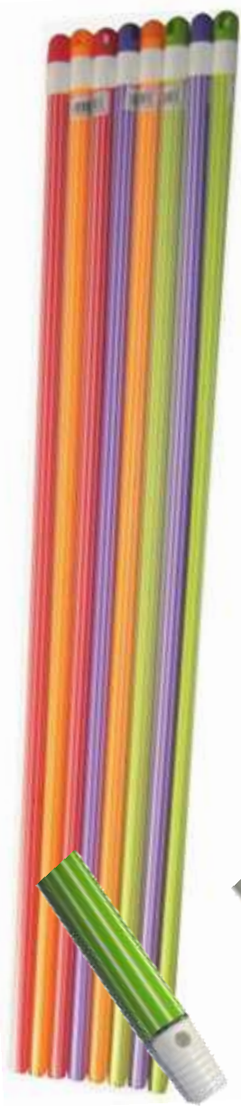
19727-CABOS TEKNIKO ANTI DESLIZANTE C/ROSCA/FURO PAMEX 1,40 Mt. At./12