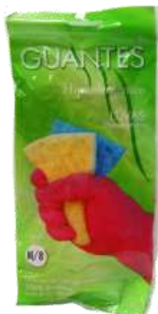
19286-LUVAS PVC HIPOALERGICO MÉDIA