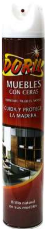
20752-LIMPA MOVEIS SPRAY 750 ml. Cx.12