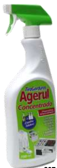
20742- AGERUL TIRA GORDURAS 750 ml.