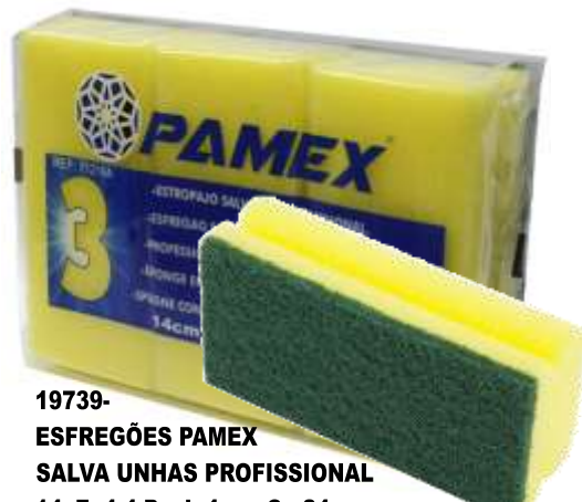
19739-ESFREGÕES PAMEX SALVA UNHAS PROFISSIONAL 14x7x4,4 Pack 4 un. Cx.24