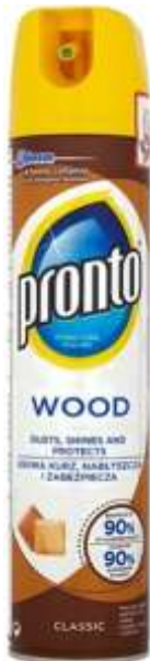
20556-PRONTO P/MOVEIS SPRAY 400 ml.