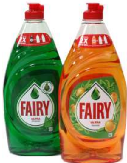
DET. LOIÇA FAIRY 820 ml. Cx.8 32344-ORIGINAL, 32343-LARANJA