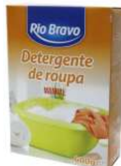
20040-DET. MANUAL R. BRAVO 600 gr. Cx.6