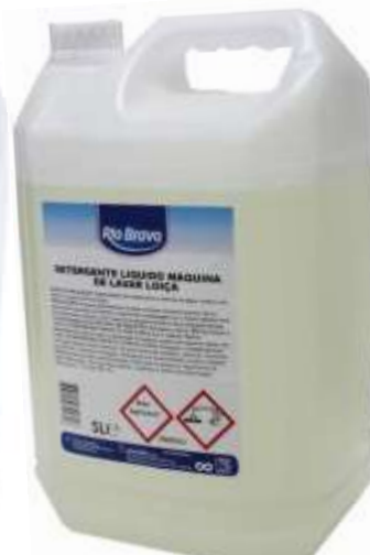
50484-DET. MAQ. LOIÇA R. Bravo 5 Lt. Cx.4