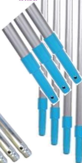
19903-CABOS FIBRA VIDRO PAMEX 1,4 mt. S/12

340 Gramas MAIS FORTE E RESISTENTE Á PROVA DE GOLPES